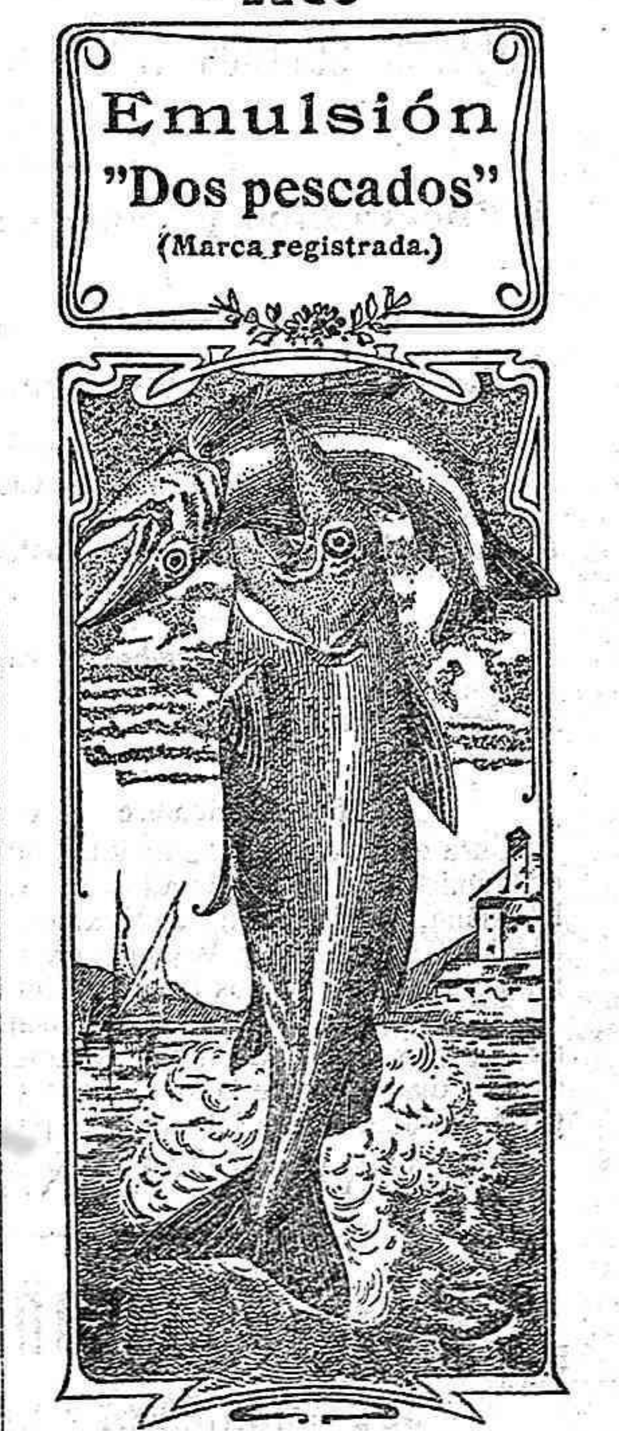
La que en menos tiempo alcanzó más popularidad y estimación de la clase médica y obtuvo más medallas de oro.—Dr. Doyen.

reajadas en todos los sistemas que se pujan. ¡No os dejéis engañar! Visita! este establecimiento y os convenceréis. Calle de San Pedro núm. 11 -- LUGO --