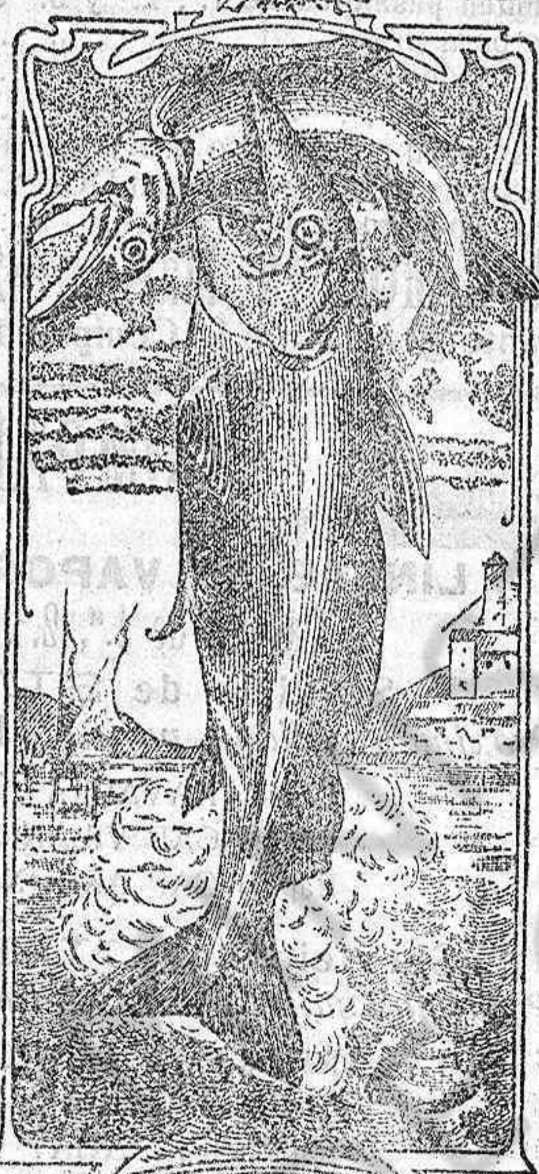
La última palabra

Emulsión "Dos pescados" (Marca registrada.)