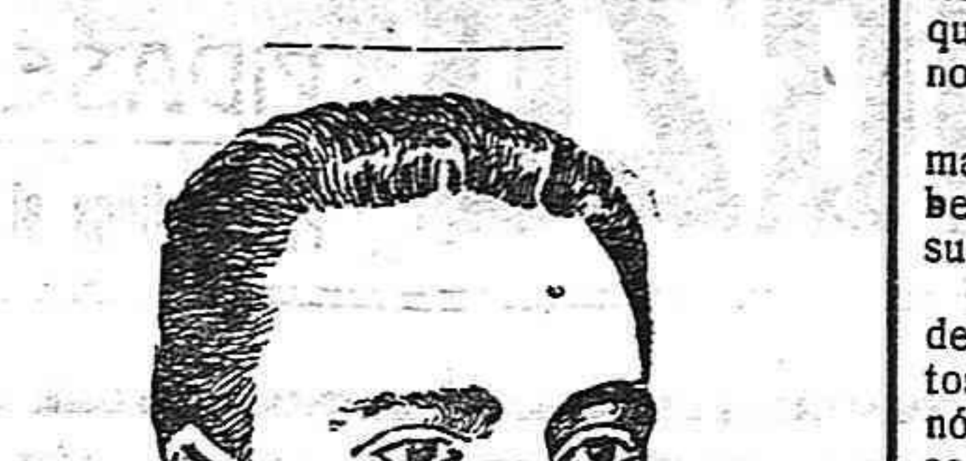
El presidente del Consejo de Rumania, señor Brantino.

La vida del gabinete Bratiano de Rumania, es cada día más difícil. El presidente del Consejo sigue creyendo que la más absoluta neutralidad es lo que más conviene por el momento a los intereses de su país, pero las opiniones sobre este asunto son tan contrarias, que los esfuerzos que tiene que realizar para mantener el equilibrio austro-eslavico son cada día mayores.