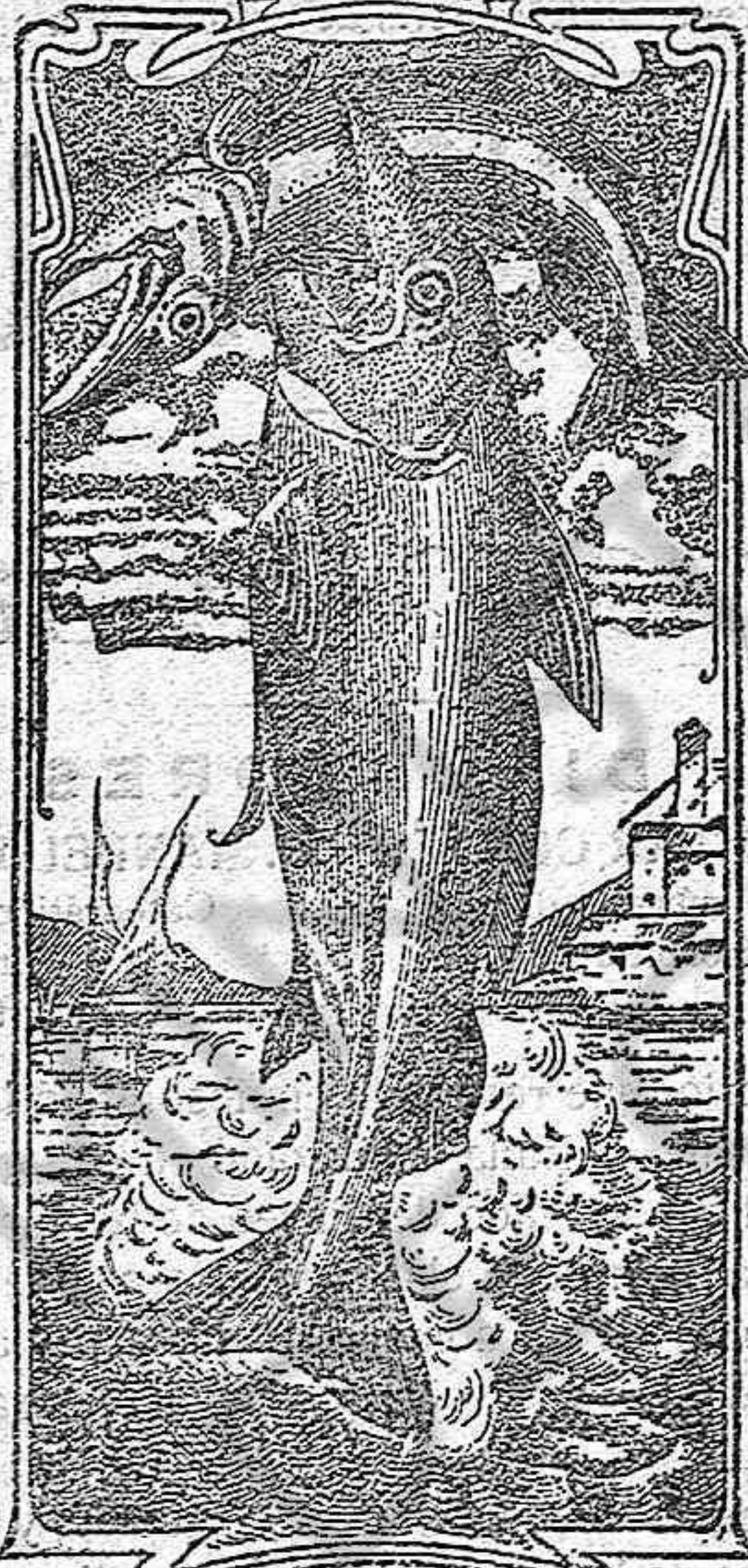
La última palabra

Nos referimos a una nueva y excelente preparación de Emulsión «DOS-PESCADOS» (marca registrada) la que compete con todas, las extranjeras y españolas, tanto en calidad como en precio.