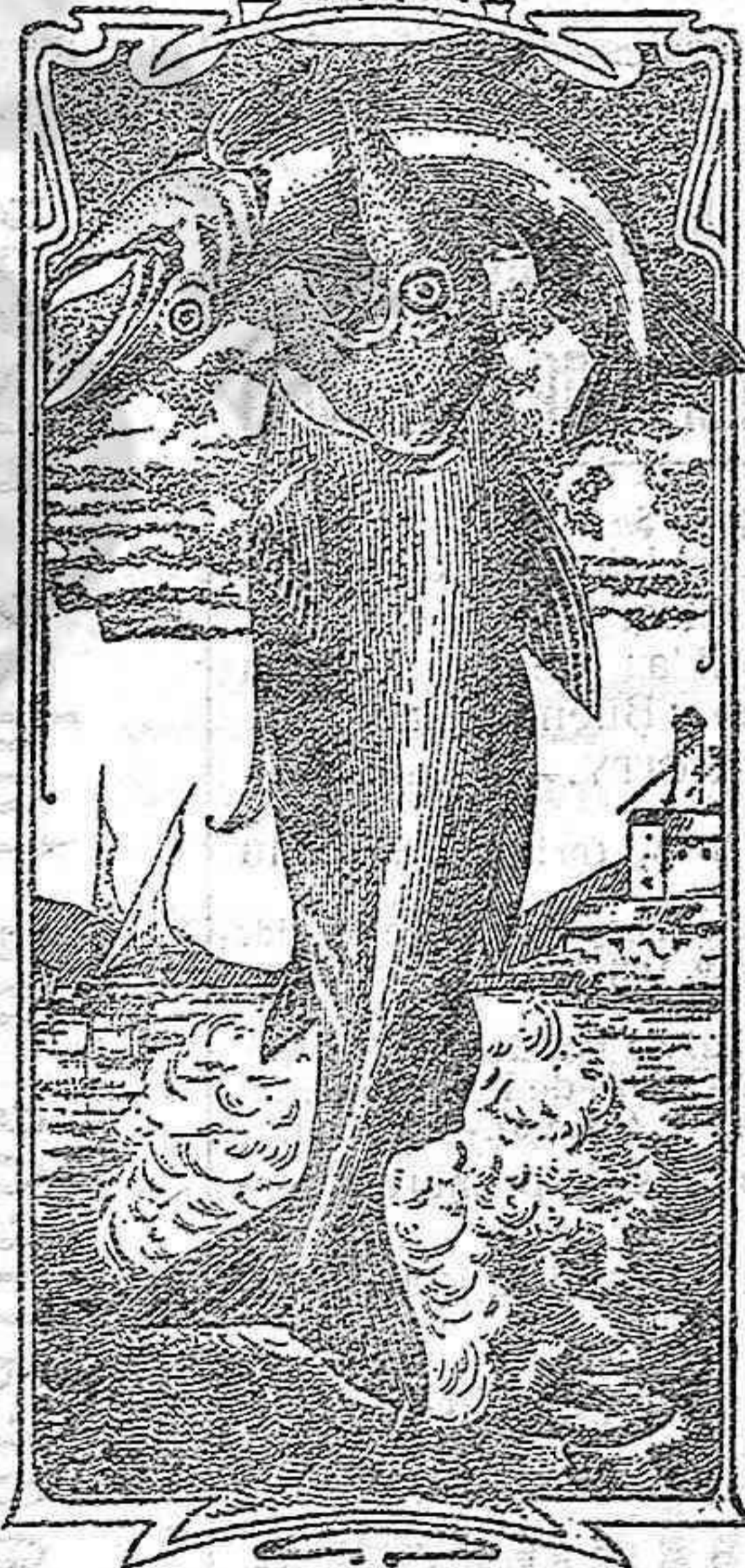
La última palabra

Emulsión "Dos pescados" (Marca Registrada.)