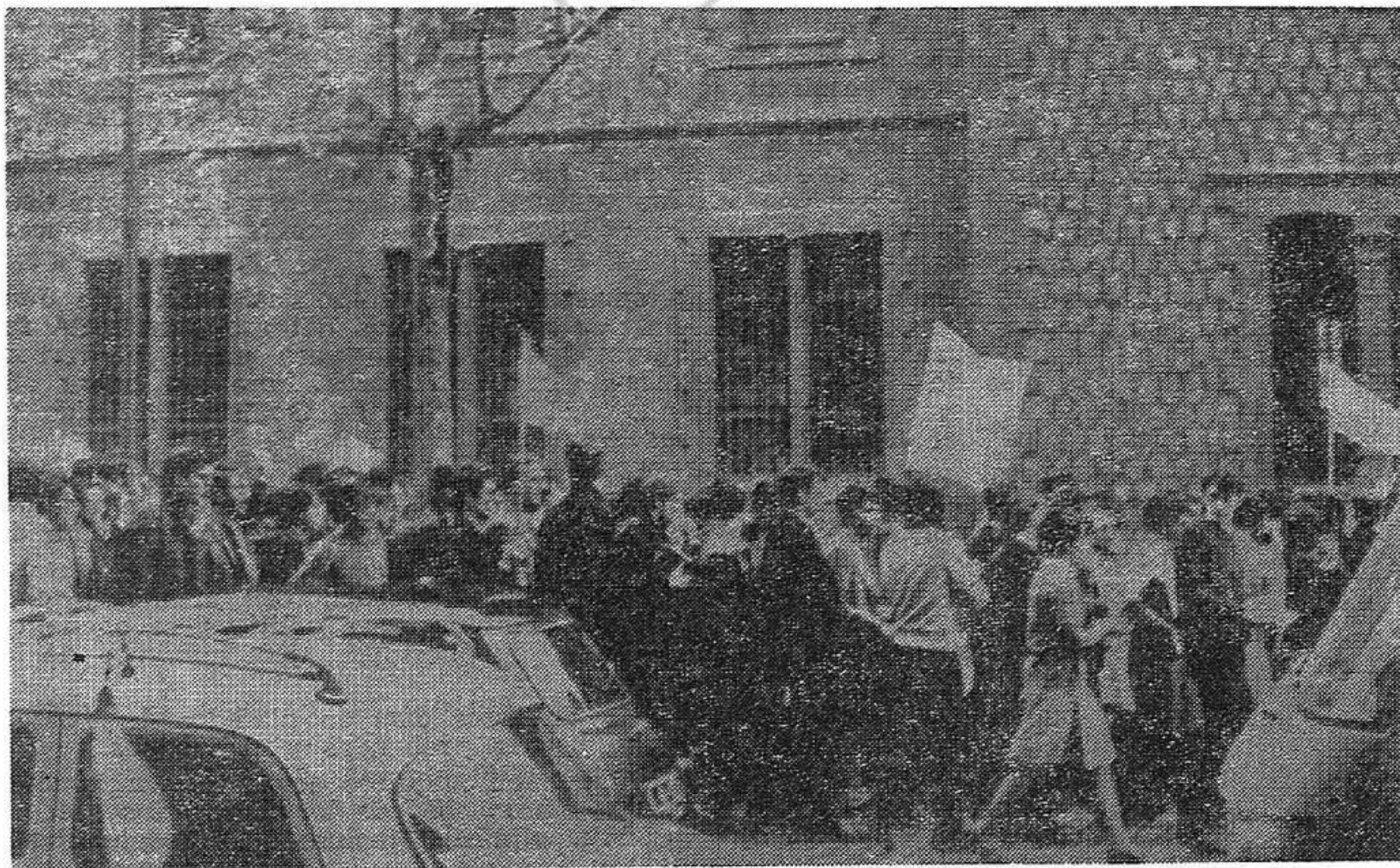
Manifestación de estudiantes de Medicina de Barcelona. Febrero 70.

Debemos fijarnos también, para este segundo trimestre, el objetivo de coordinar políticamente y organizativamente el movimiento estudiantil a nivel de distrito, formando amplios órganos de dirección, que además, representen a los estudiantes ante el movimiento obrero y popular. Y con ello sentaremos las bases para una coordinación del movimiento estudiantil de todo el país, que, de cara al derrocamiento del régimen a través de la Huelga General y Huelga Nacional, tendrá cada día más importancia. ESTUDIANTES COMUNISTAS DE BARCELONA