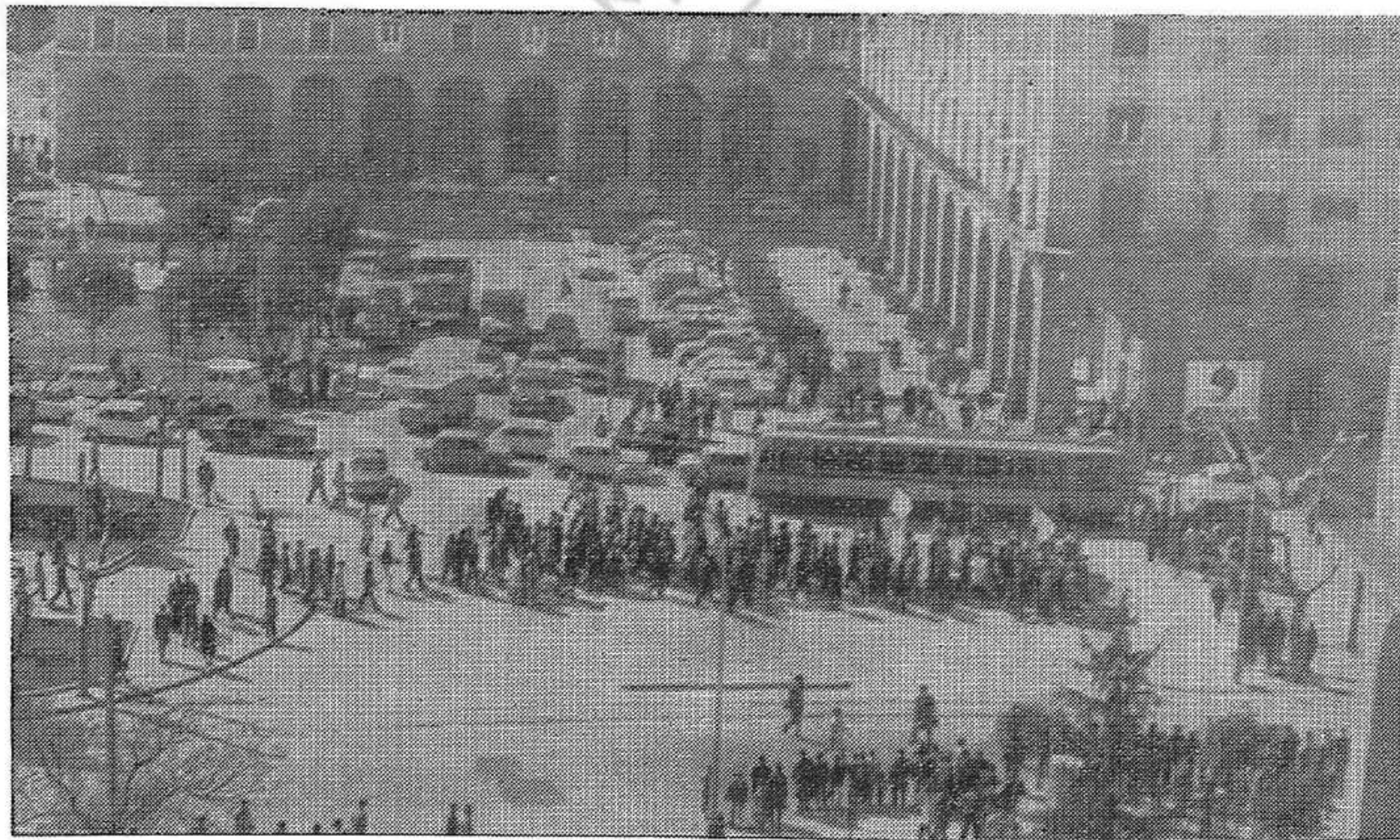
Manifestación el 11 de marzo 1970 en la ciudad Universitaria de Zaragoza contra las bases USA en España. La pancarta dice: «¡Yanquis, fuera!». La lucha de masas lo decidirá todo; también el Pacto para la libertad.

res hoy confundidos y alejados de la vida política por la represión y la demagogia fascistas. La conclusión de un Pacto para la libertad sería una señalada victoria política sobre los ultras y un paso importante para crear la gran coalición de fuerzas que propiciaría un cambio pacífico hacia una situación de libertades democráticas. El pacto es posible, es conveniente, es necesario. El movimiento revolucionario y democrático lo saludaría. Pero los sectores evolucionistas burgueses cometerían un error si creyesen que tienen en sus manos las llaves del porvenir, si considerasen que están en condiciones de regular la dirección y el ritmo de los acontecimientos. Las llaves del porvenir están en manos del movimiento de masas; la dirección y el ritmo de los acontecimientos dependen de su lucha. En un plazo mayor o menor, de una u otra forma, con pacto o sin pacto, el movimiento de masas encontrará fuerzas para poner fin al poder fascista de la oligarquía y abrir a España una nueva época de desarrollo democrático.