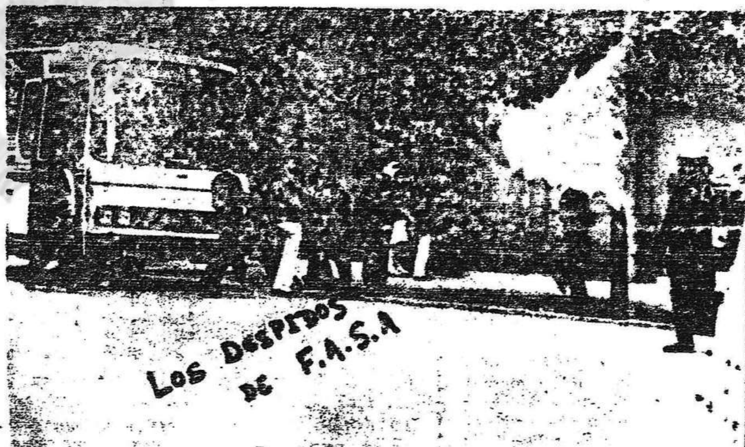
Los testigos de la empresa llegan a Magistratura

LUCHEMOS POR LOS DESPIDIDOS Y LAS MEJORAS SOCIALES