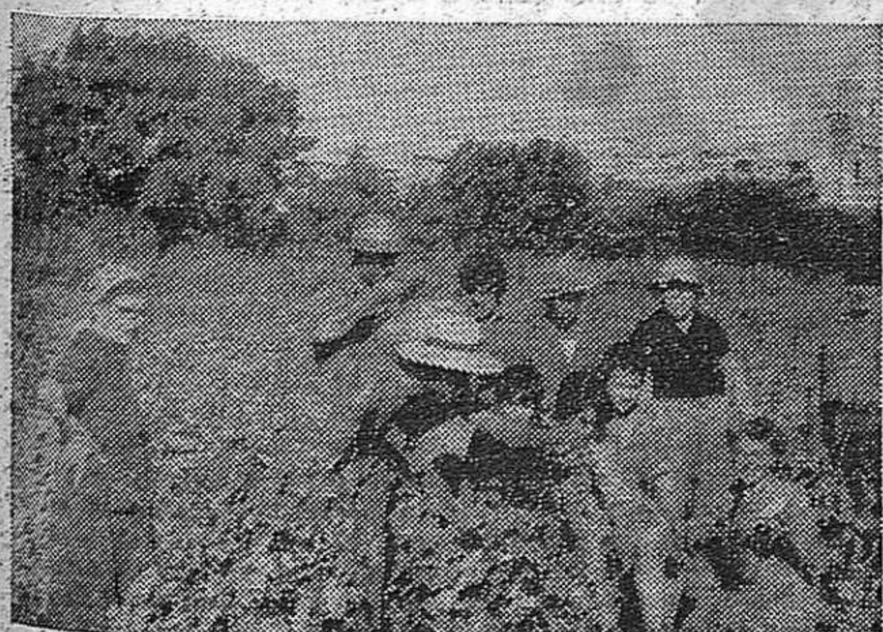
Una «colla» de españoles.

— Por su parte, mujeres representativas de diversas organizaciones chilenas, Partido Socialista, Partido Democrático Nacional, Partido Comunista, Central Única de Trabajadores, Unión de Mujeres, Movimiento de la Paz y otras, han hecho público un documento en que dicen: «Para las valientes mujeres españolas que de una forma decidida están incorporadas de hecho en las huelgas, vamos toda nuestra admiración y nuestro aliento».