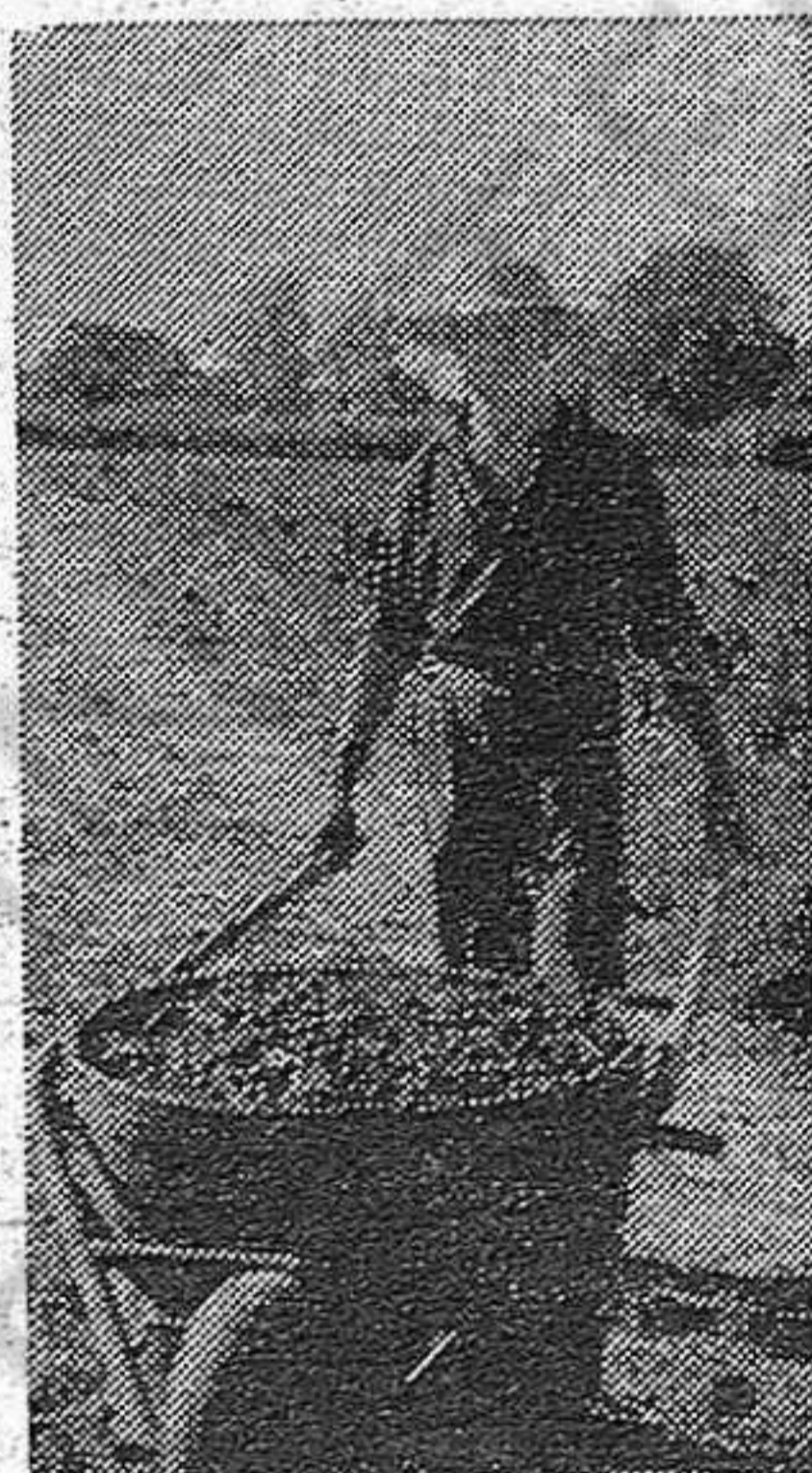
« Los hombres acarrear computas de 100 kg. »

— Sí. R la tierra será para el que la trabaja y no para los gandules — afirma una voz grave con acento resuelto.