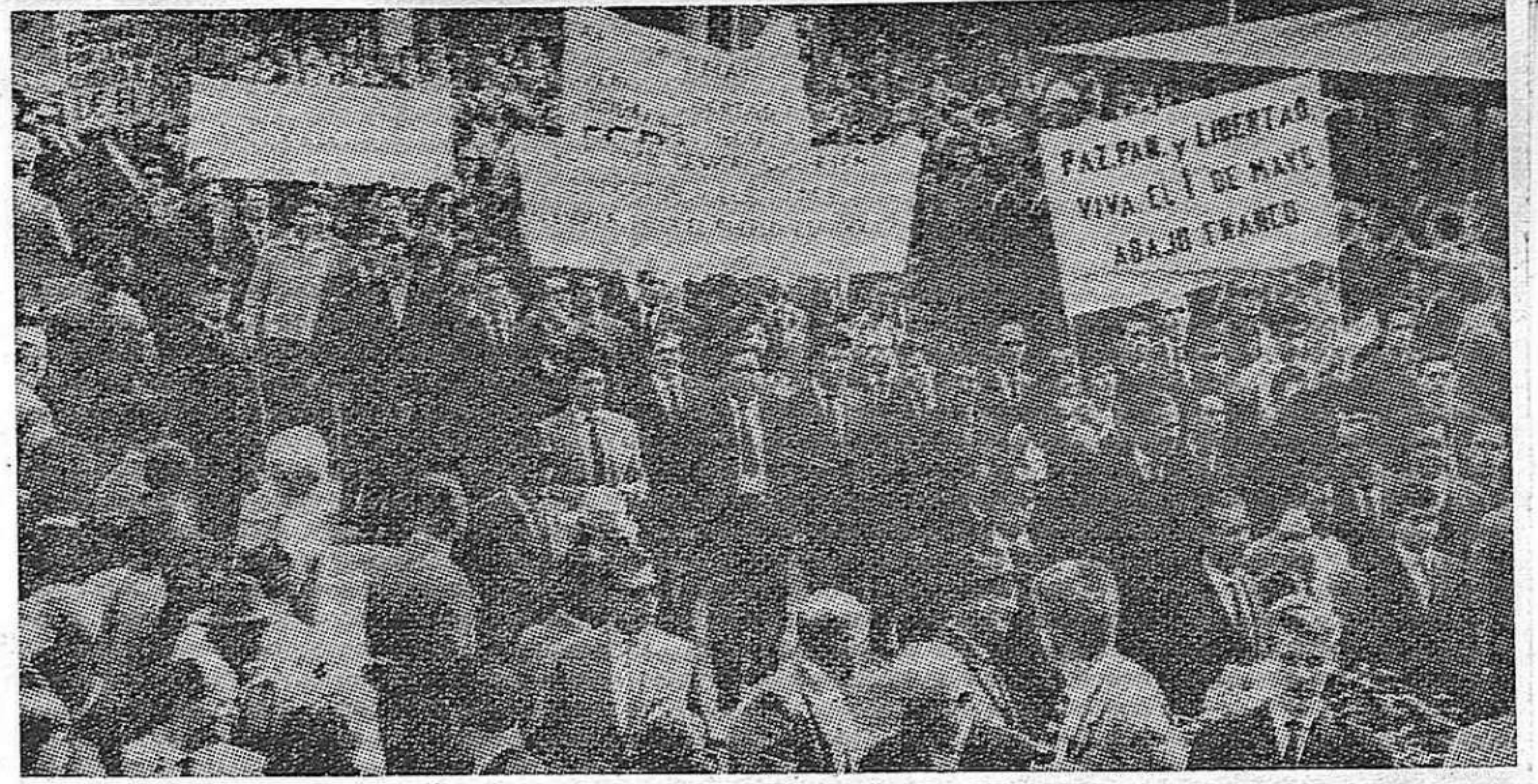
El 1º de Mayo en Stuttgart: importante manifestación de solidaridad hispano-alemana.

Par si acaso, nos permitimos someter esta sugerencia a la reflexión de su preclaro intelecto.