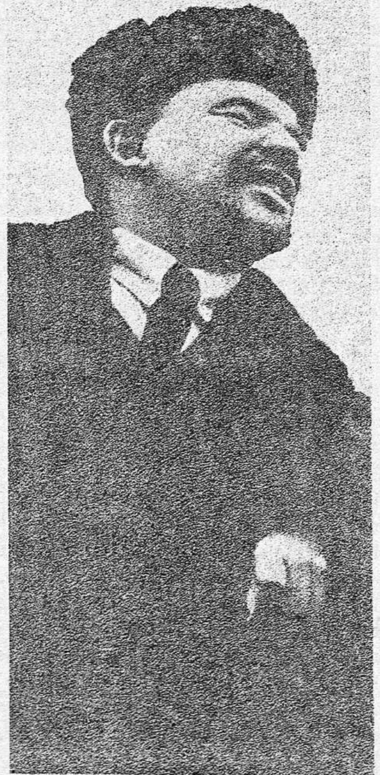
LENIN maestro en la lucha contra el revisionismo

En todo caso el pueblo, más pronto o más tarde repudiará a todos los partidos que no sean destacamentos de combate contra la oligarquía y el imperialismo, que no asuman la defensa de sus intereses y -- que no estén dispuestos a unirse en un Frente Democrático Popular capaz de implantar un día, con la victoria de la revolución, el poder popular, el poder conjunto de las distintas clases populares.