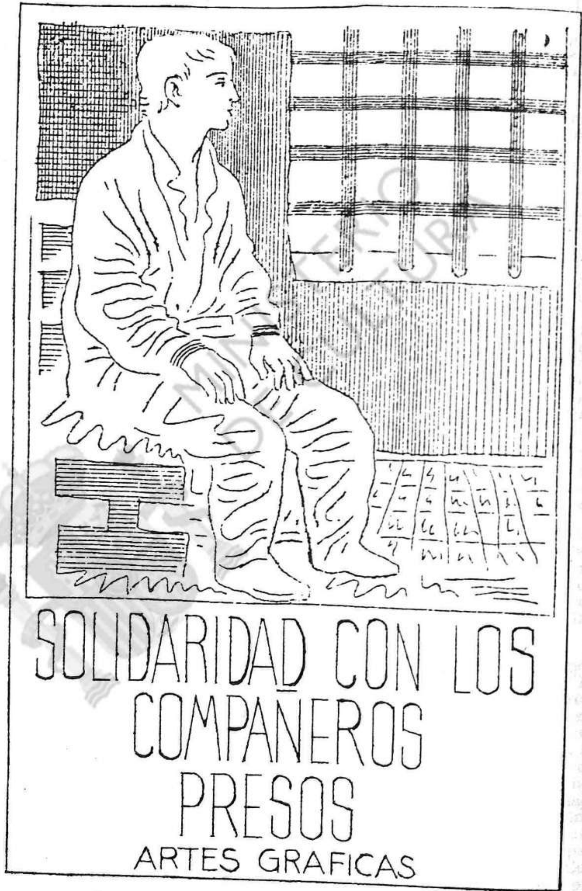
Tarja de solidaritat editada a ciclostil durant el periode d'exceptió