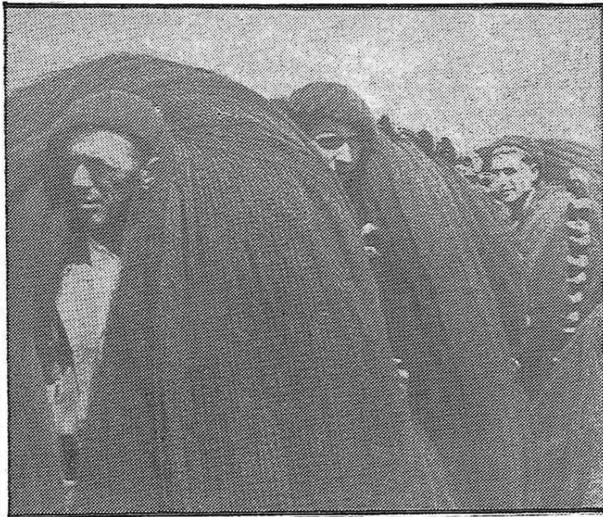
Los pescadores de Euzkadi recogen con esmero sus redes para prepararlas de nuevo para la faena del día siguiente. Jamás perdieron la esperanza de que los puertos vascos volverán a ser aquellos rincones afanosos de bullicio y alegría, y no los centros de explotación en que los ha convertido el franquismo. Por eso luchan al lado de todo el pueblo, por la libertad y la República.

La Dirección del Partido Comunista de Euzkadi pone en conocimiento de los militantes de nuestro Partido y de todos los antifranquistas, que habiéndose retrasado la celebración de la Conferencia de Bayona, la