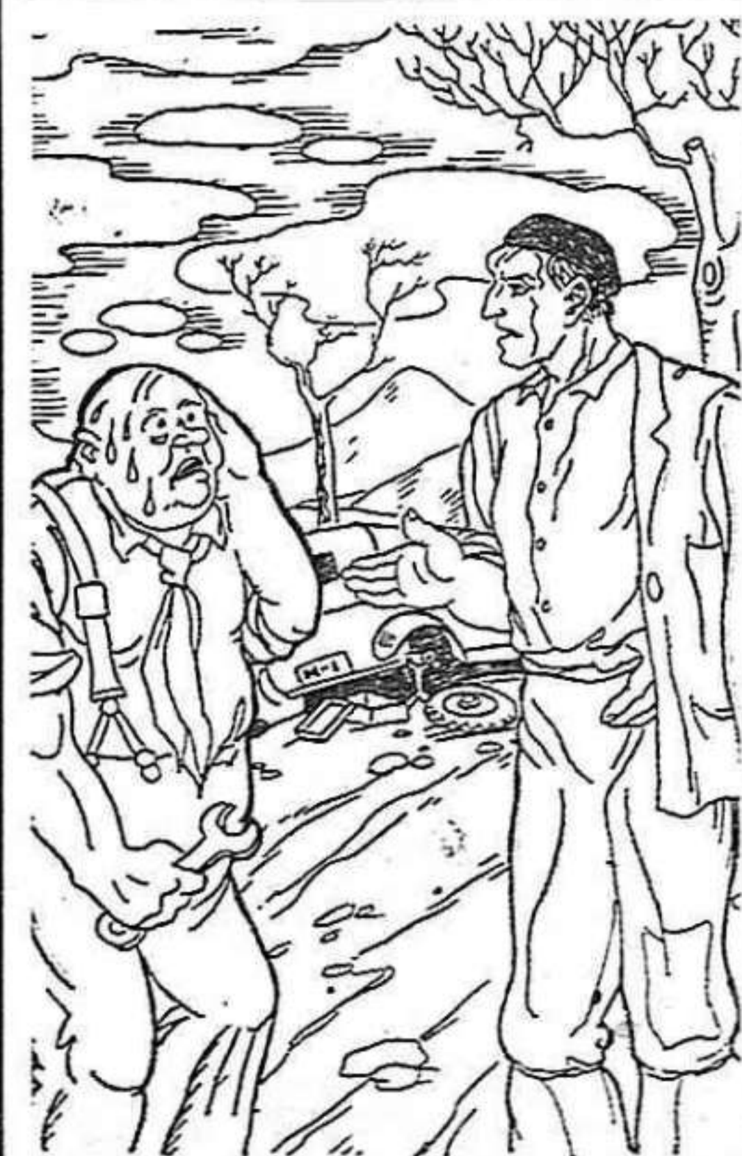
EL CONDUCTOR DEL COCHE: Con tanta piedra y tanto bache, habra muchas «pannes» en la región EL BASERRITARRA: «Panes» dises con esta régimen? Ni «talos» siquiera.