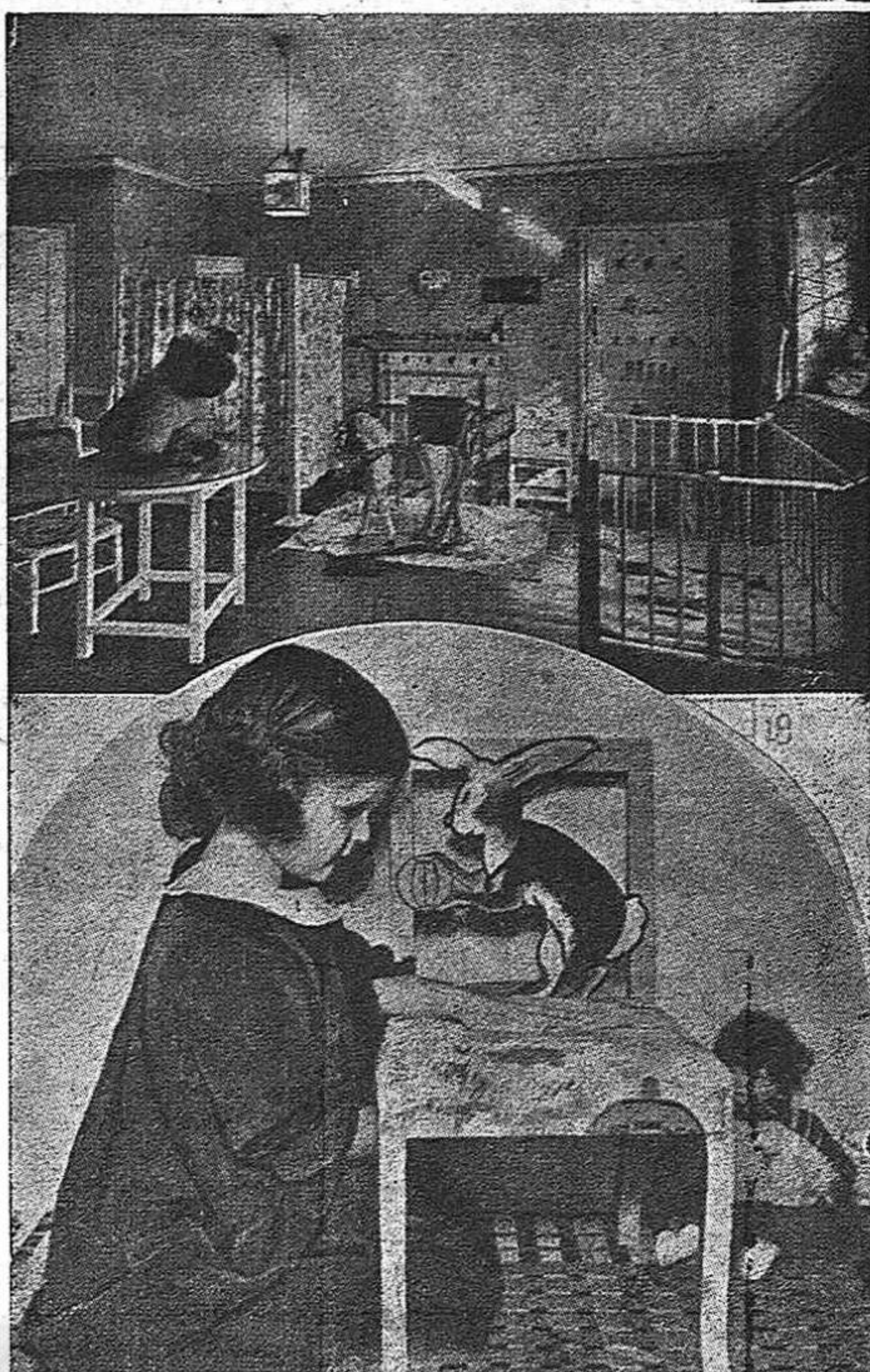
Madres uruguayas: Al ver esta niñita entretenida alegremente en sus juegos, disfrutando de todas las comodidades ¿no pensáis, que los niños de España carecen hasta de pan? Ayúdalos. Sólo en esa forma evitarás a tus hijos idéntico y trágico destino

sabe retirar sus verdaderos voluntarios, mientras Franco introduce nuevos mercenarios.