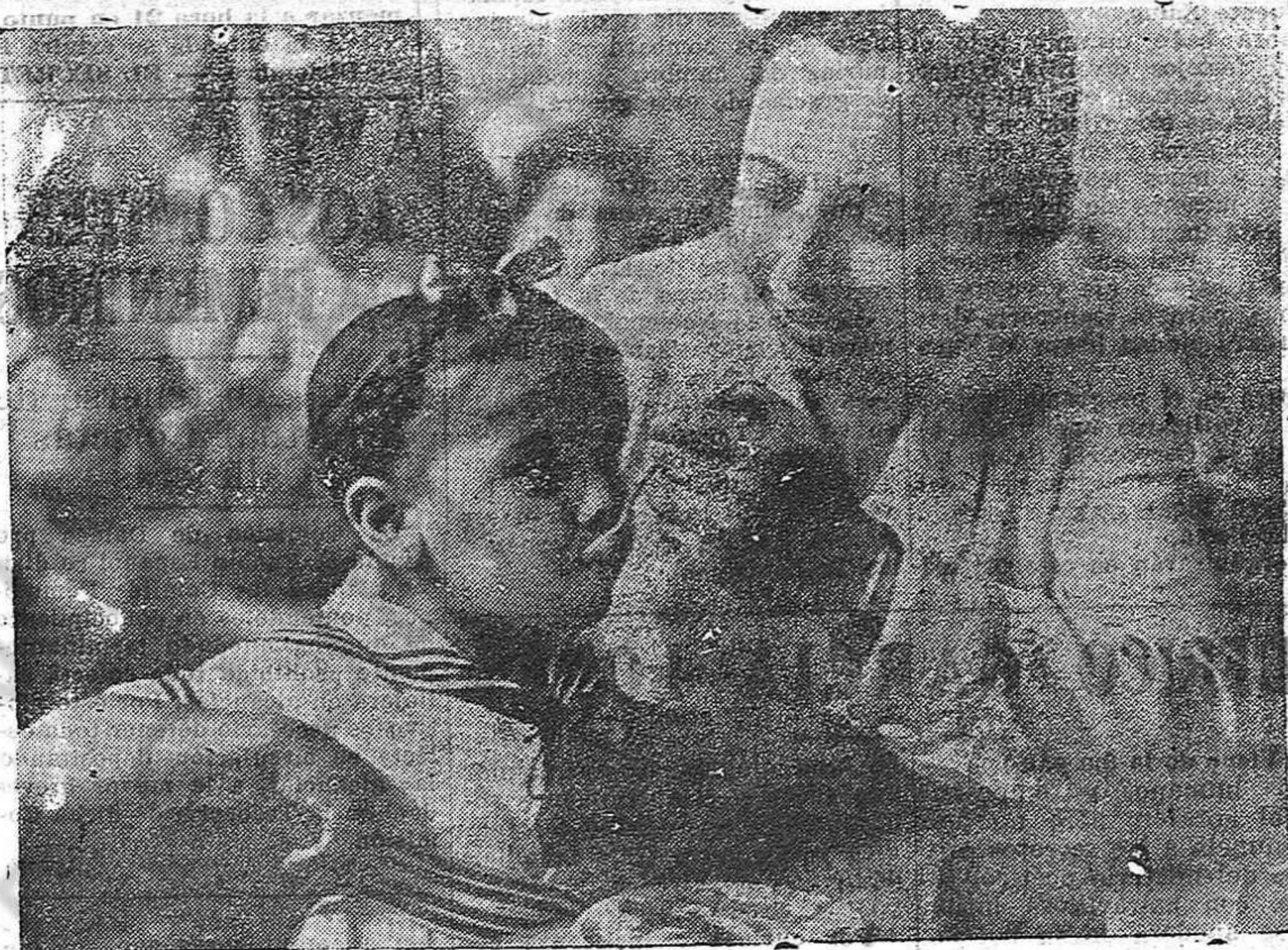
La República tiene resuelto en forma conveniente el problema de la niñez. Ayudemos hombres y mujeres del Uruguay, a la construcción y mantenimiento de estas ciudades.