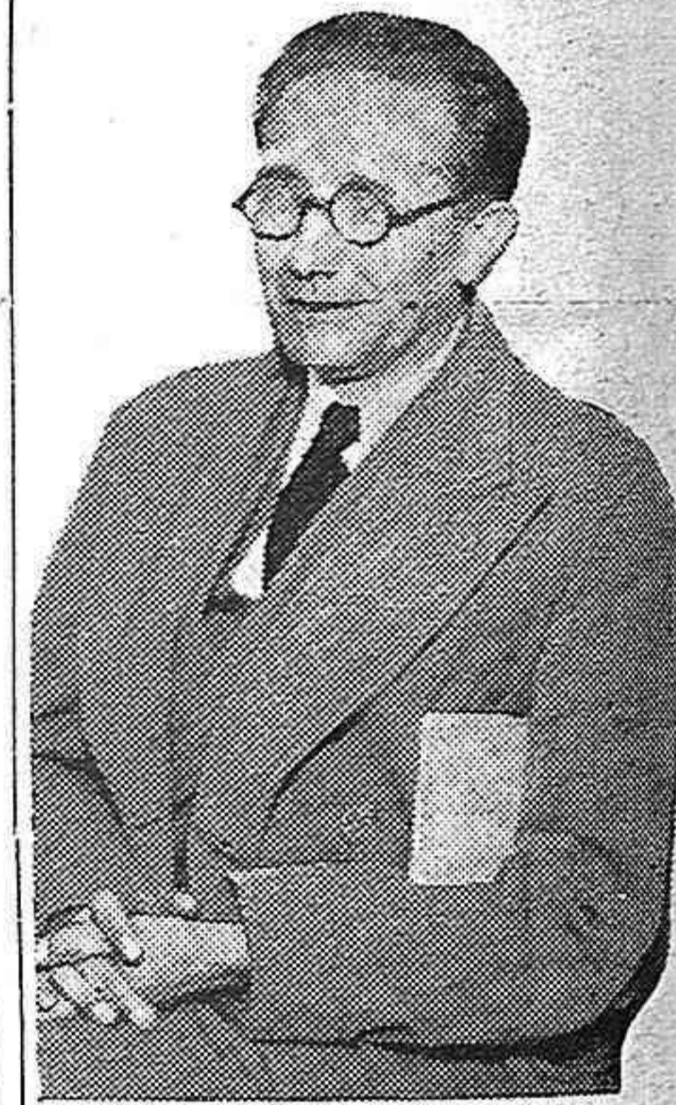
El gran artista Castelar, paladín de la unidad de los españoles, que recientemente condenó en un acto en Nueva York la conducta de Indalecio Prieto por considerarla perjudicial al interés de los españoles republicanos