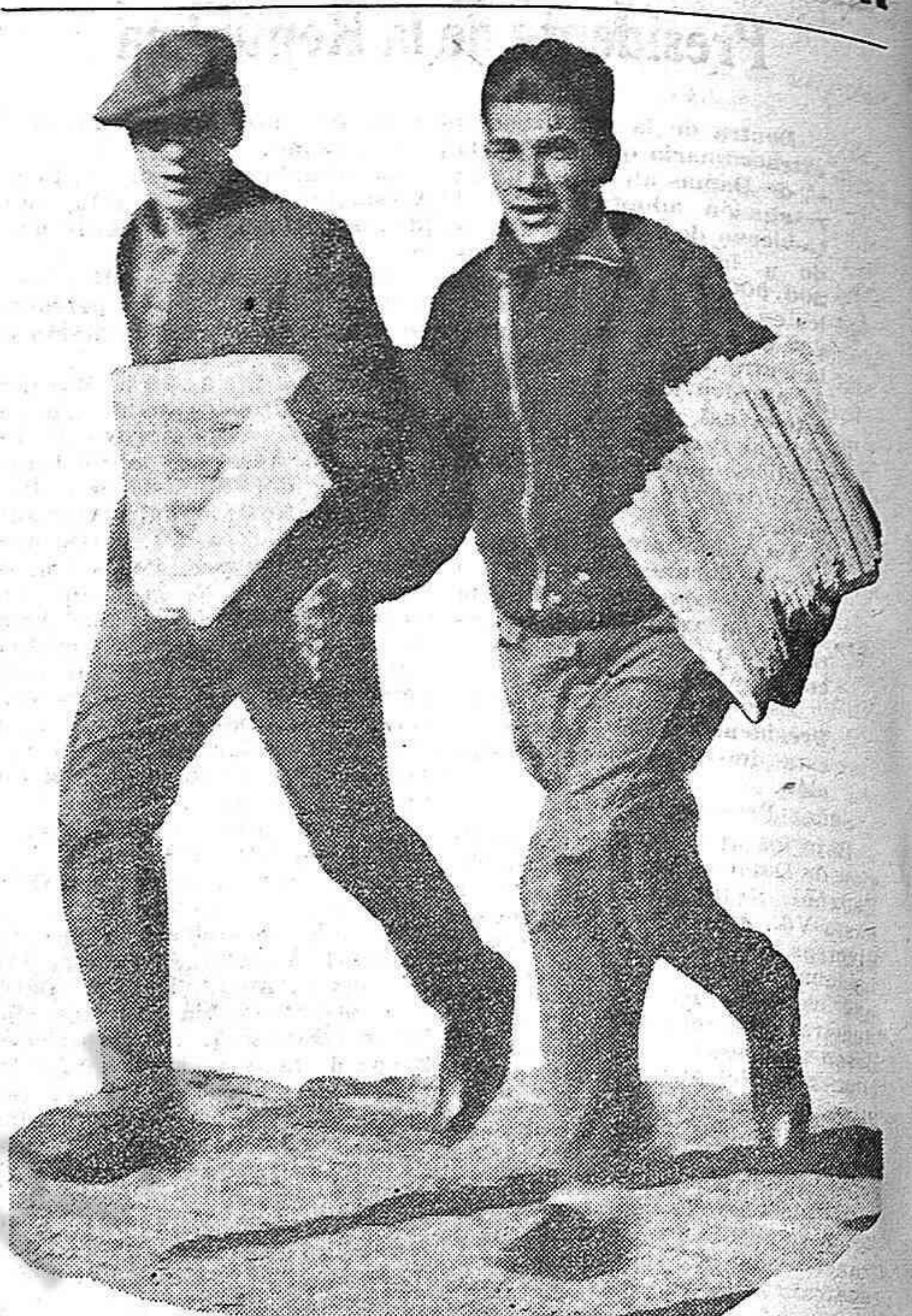
¡Canillitas! Tienen una escuela: la de la vida y una moral, la de su hermandad con los pobres del mundo. ESPAÑA DEMOCRÁTICA saluda a estos muchachos valerosos que comprenden la responsabilidad de la hora y accionan en ayuda de los refugiados de la Madre Patria.