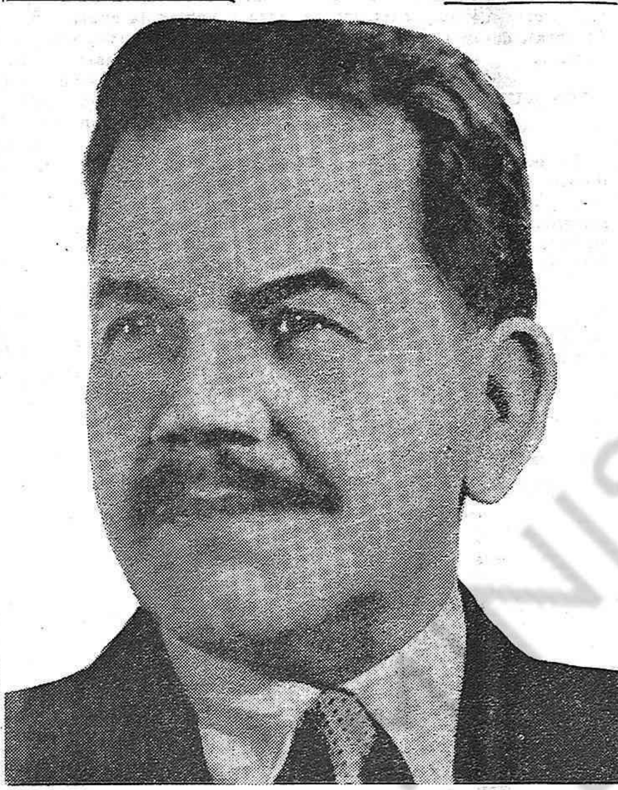
El Sr. Aguirre Cerda, Presidente de la República de Chile que, bajo la inspiración de la política del Frente Popular conduce a su pueblo por rutas de bienestar y de progreso. Gran amigo del pueblo español que ha dado reiteradas pruebas de su interés por la salvación de los refugiados, permitiendo la libre entrada de los mismos al país. La colonia española y el pueblo uruguayo le rinden homenaje de simpatía y adhesión.

ñol y sumarse a la acción democrática del país, tanto en el hecho concreto de esta ruptura de relaciones, como en cuantos semejantes puedan presentarse. Es igualmente necesario que las instituciones y partidos democráticos, los sindicatos obreros, la prensa democrática y todo cuanto en nuestro país representa garantía y substancia de nuestras libertades y de nuestras instituciones democráticas, apoyen y defiendan al movimiento nacional de ayuda y a la colonia española republicana, ya que, en fin de cuentas, son éstos los baluartes de vanguardia que en nuestro país luchan contra el falangismo, por la salvación de los refugiados españoles y por ayudar a liberarse al pueblo español de la esclavitud, de la miseria y de la tiranía a que lo han conducido los que se sublevaron contra el régimen republicano legítimamente instituido por la voluntad soberana de todo un pueblo. Al sumar nuestra voz a la de todas las organizaciones y a la prensa que se han alzado contra el hecho insólito que comentamos, queremos advertir que es indispensable que la repulsa vaya unida a la prevención y a la vigilancia constante, que los propósitos no queden en eso, en propósitos. Españoles y uruguayos están igualmente amenazados, unos y otros han de considerarse afectados por el mismo peligro y, a la vez comprendiendo que la mejor forma de neutralizar ese peligro es reforzando el movimiento nacional de ayuda a los refugiados españoles y a su pueblo.