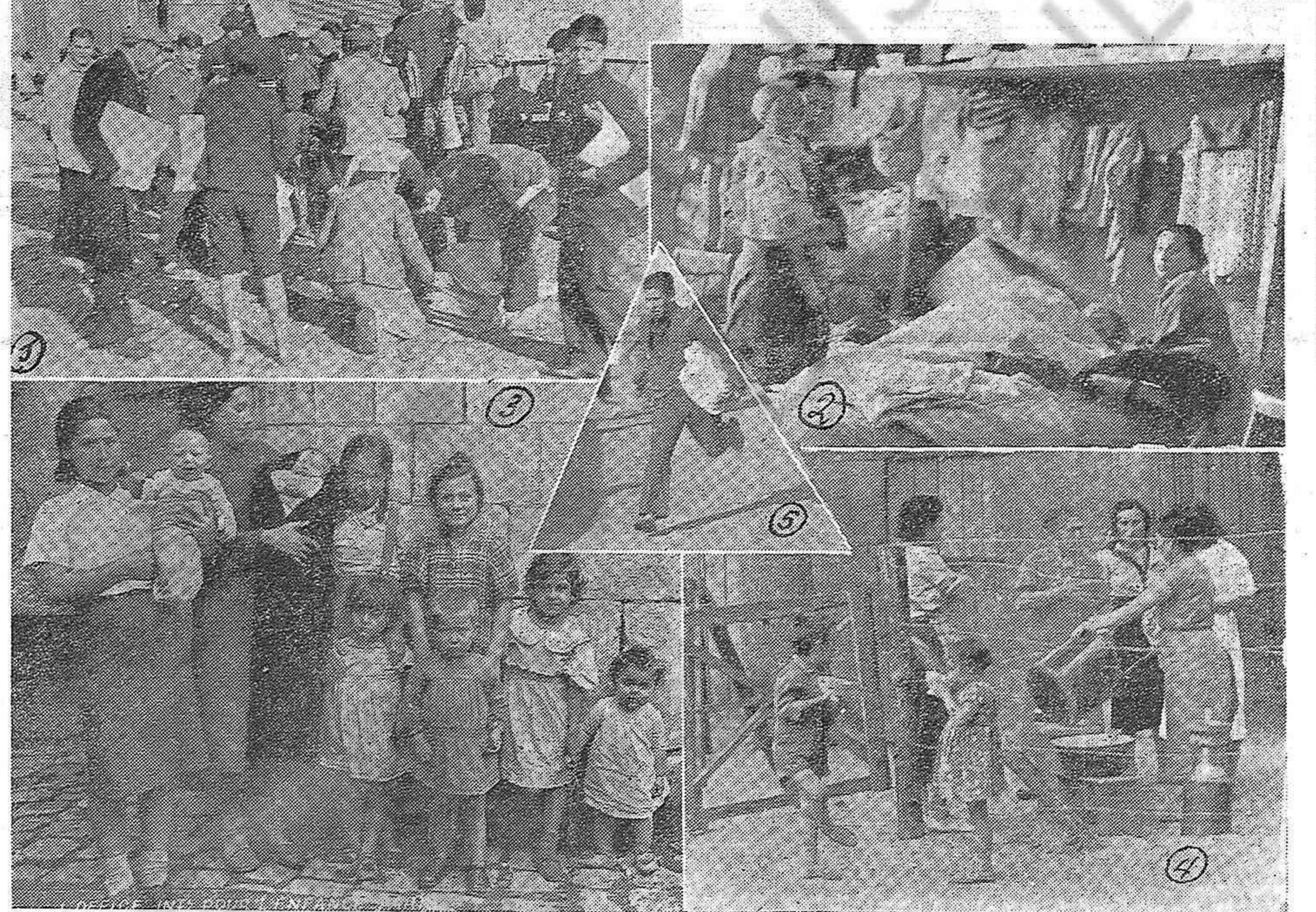
1) CANILLITAS URUGUAYOS, que mantienen viva la solidaridad con los defensores de la República Española; esta foto los toma momentos antes de lanzarse a todos los vientos a vocar los periódicos. 2) ENFERMOS, AL SUELO DE LAS BARRACAS. ¡A dónde llegan los seres humanos que han luchado por una patria para todos sus hijos y no para sus gruesos obispos, corrompidos condes y vagos señoritos! 3) DESCALZOS, O COMO SI ESTUVIERAN CALZADOS CON TERNONES O CON HOJARASCA, sus pies se confunden con la tierra y las piedras y claman por nuevos envíos de calzado de los amigos uruguayos. 4) REFUGIADOS ESPAÑOLES EN LANDES (FRANCIA); cuando la dicha les permitía servirse la comida en esta cocina de alambradas de pua. 5) CANILLITA AMIGO en el momento de lanzarse a cortar los vientos vocando los periódicos. Encuadrado en la estrella de tres puntas, símbolo de la solidaridad internacional.