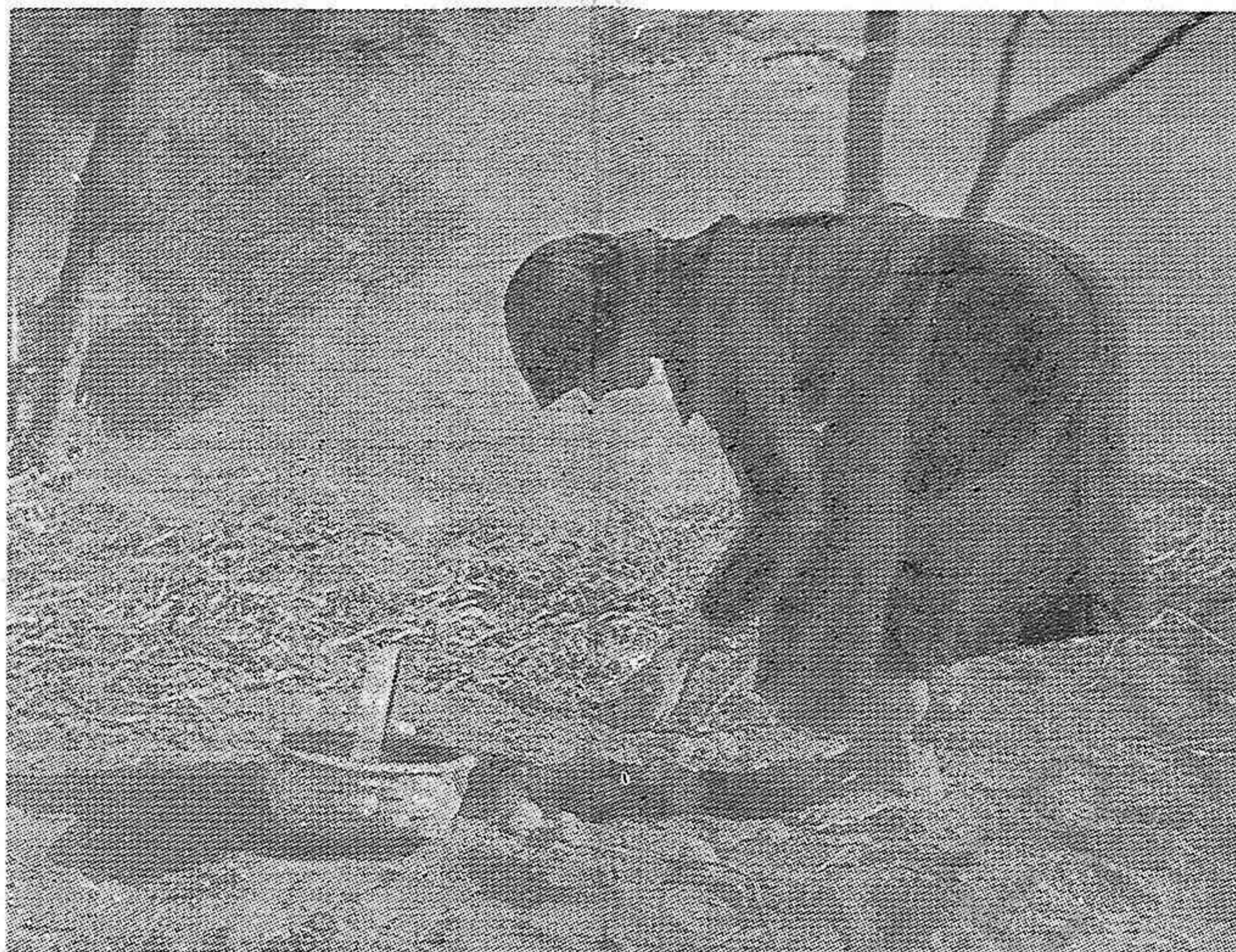
Esta campesina es un reflejo de la terrible situación que padecen los campesinos españoles.