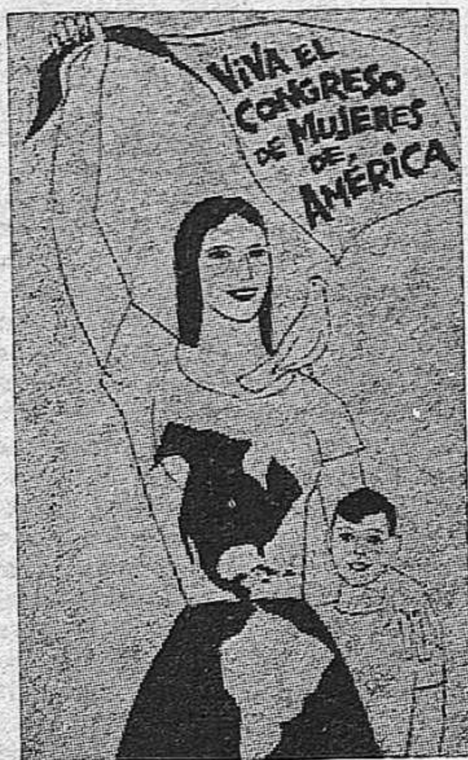
Cartel para el Congreso de Mujeres de toda América celebrado en La Habana.

Muchas son las mujeres españolas que dejaron su juventud tras los muros de las cárceles de Franco; muchas son también las que día a día esperan a las puertas de las cárceles que les sean devueltos sus seres queridos.