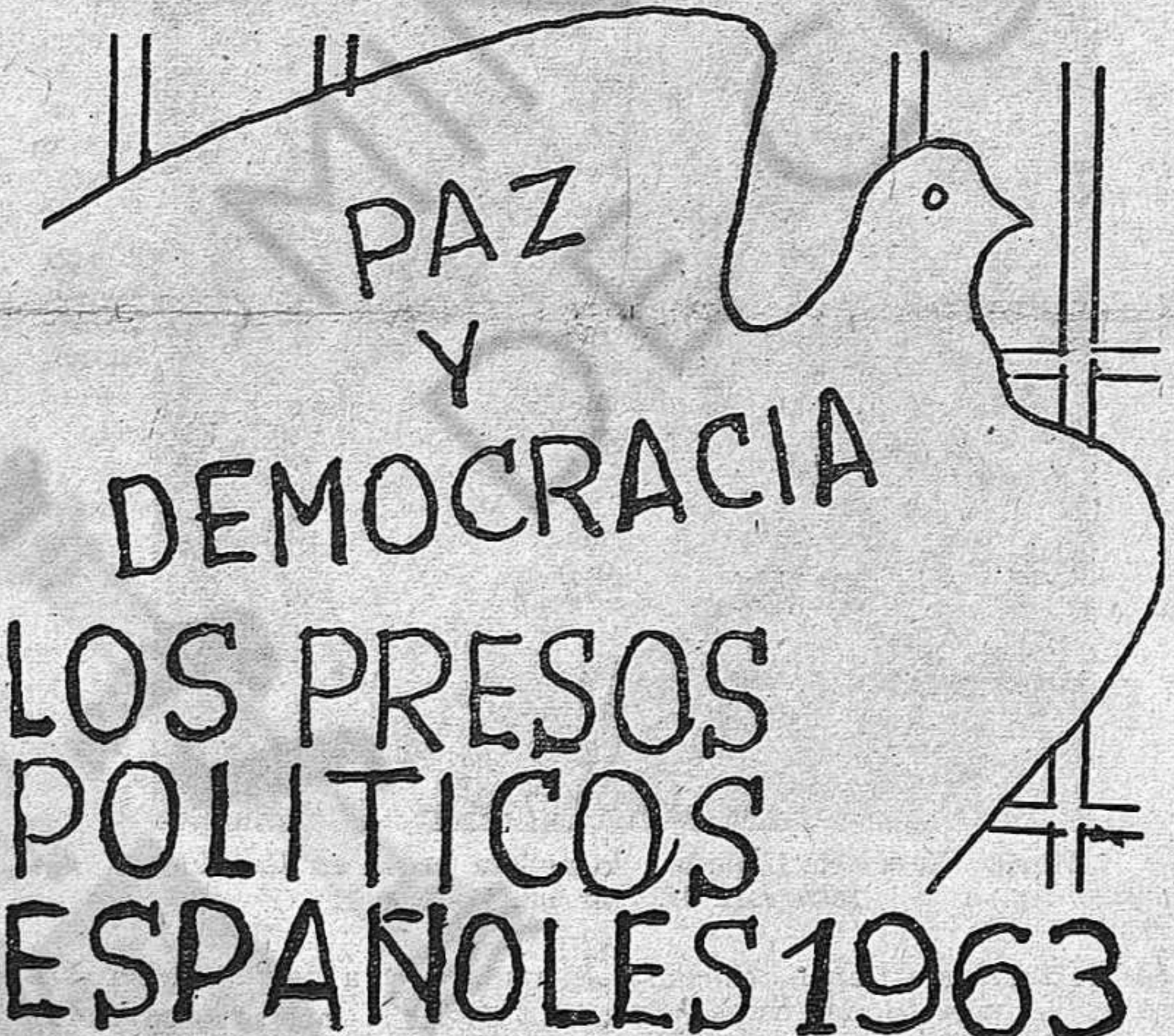
Dibujo enviado por los presos políticos españoles de Burgos.