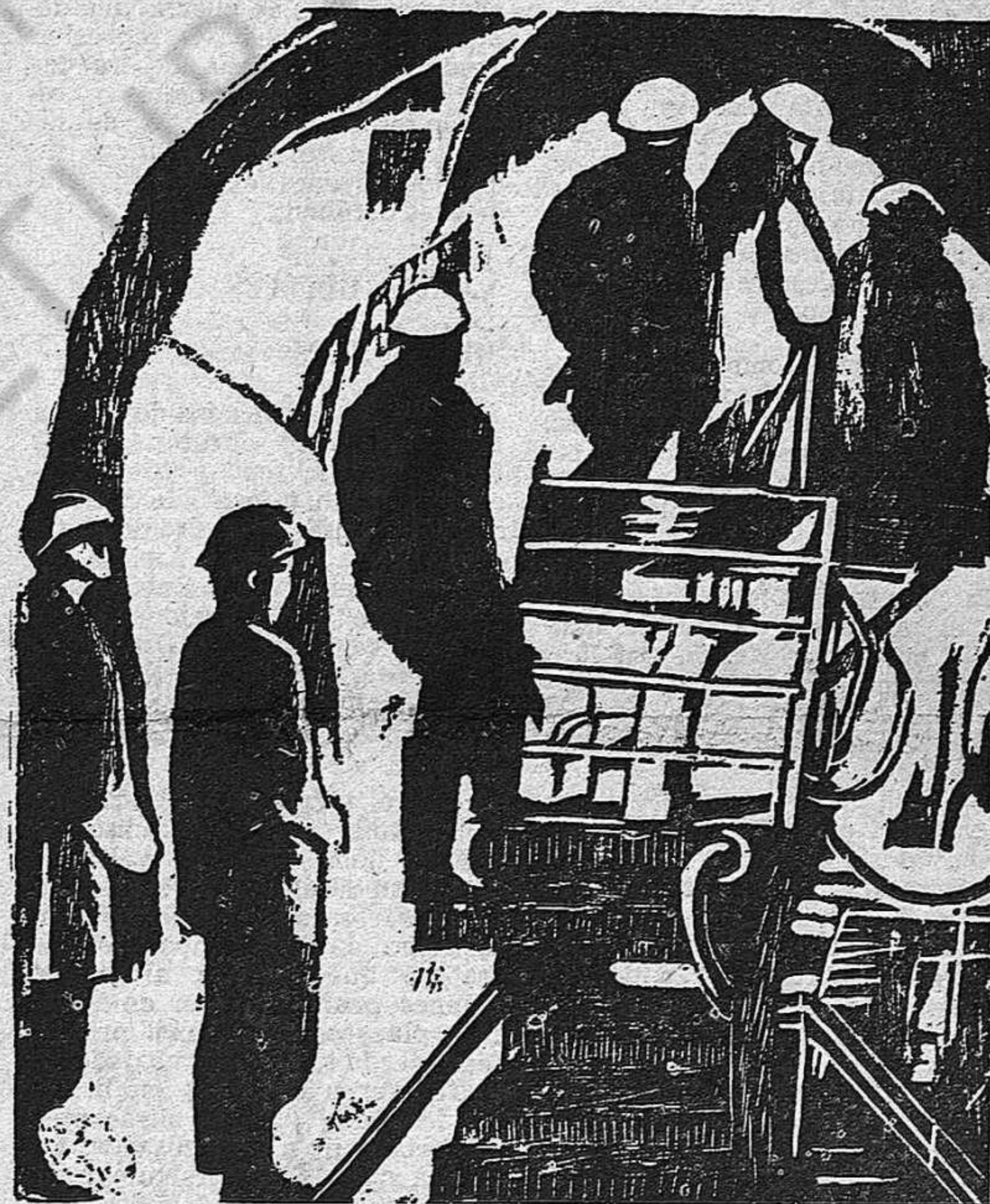
Mineros: Grabado de María Francisca Dapena.