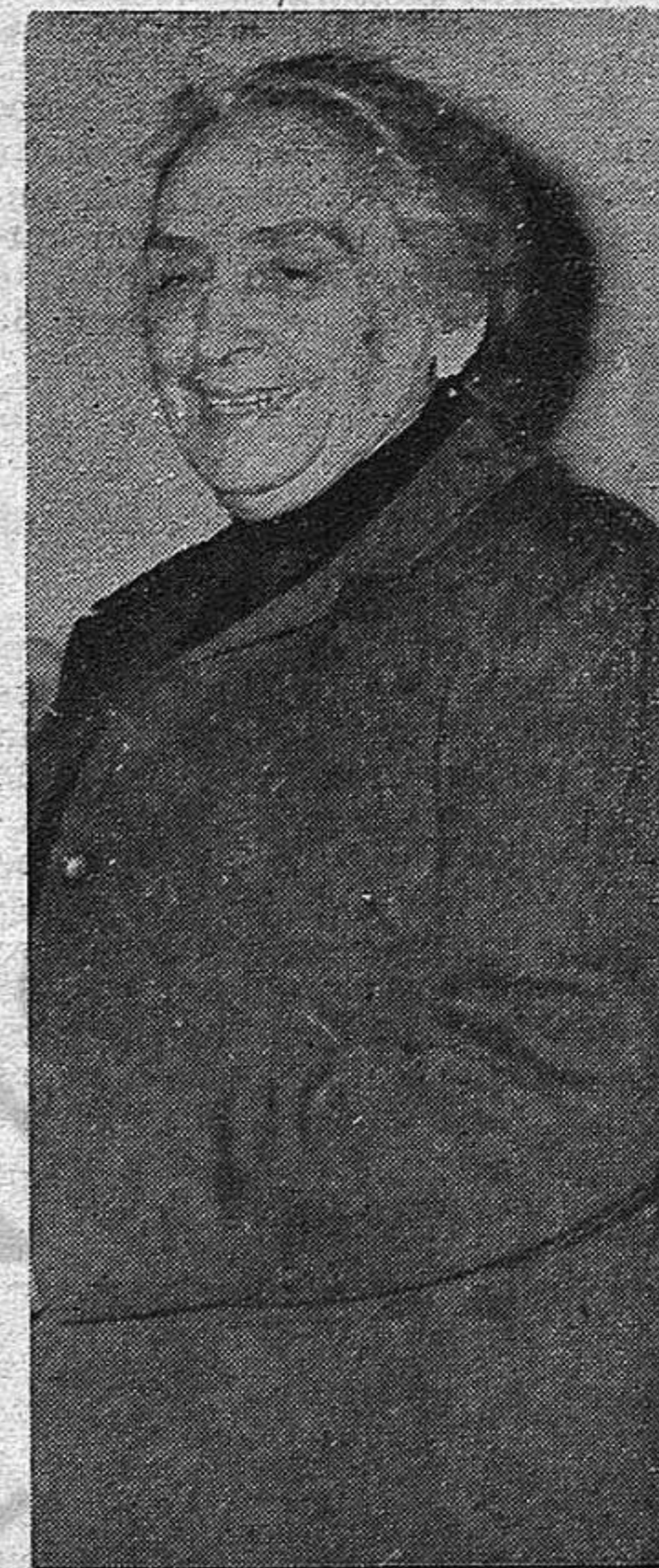
Dolores Ibárruri, presidente del P.C. de España.

"En nombre del Comité Central del Partido Socialista Unificado de Alemania —dijo— entrego a