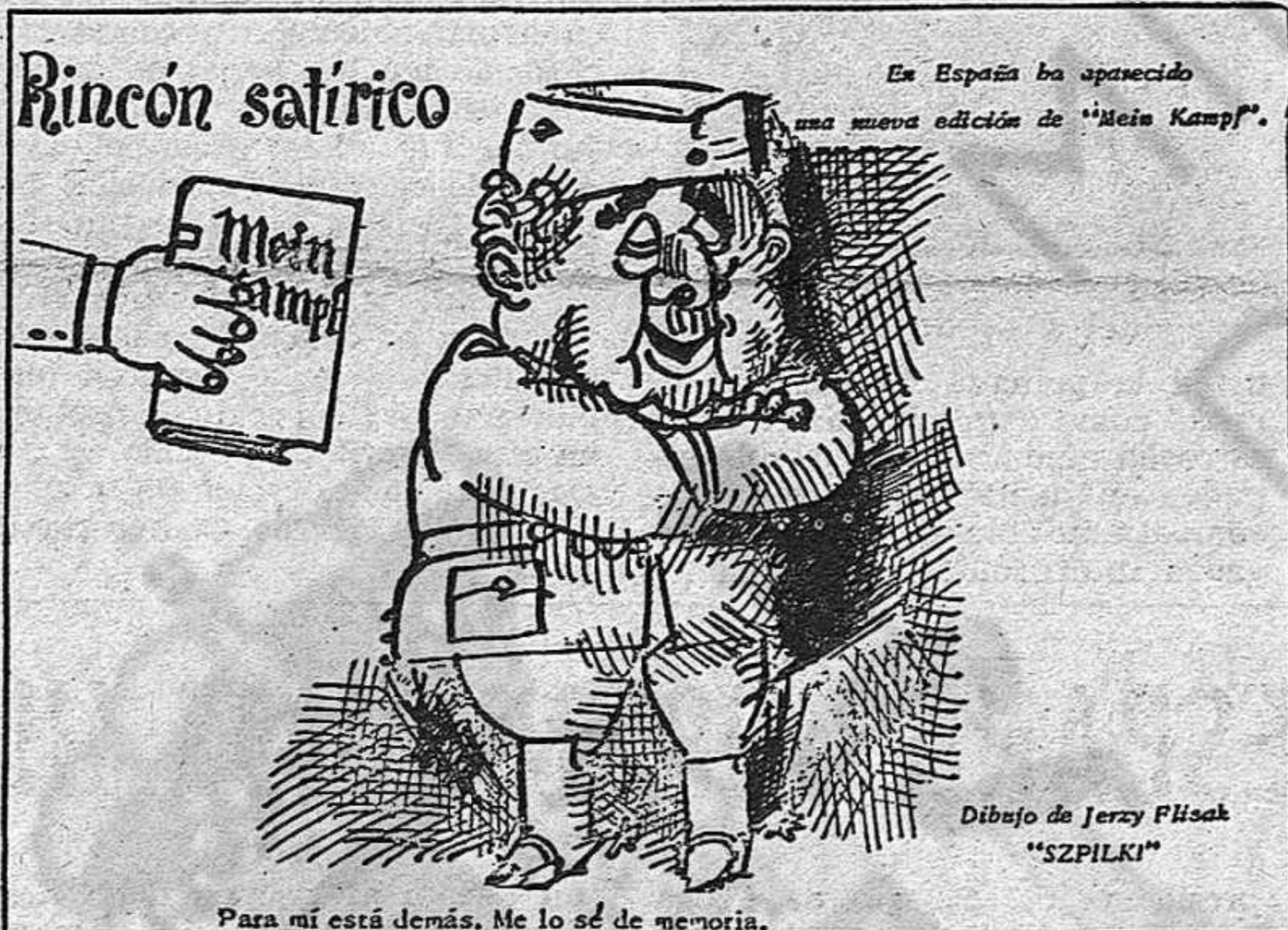
En España ha aparecido una nueva edición de "Mein Kampf". Dibujo de Jerzy Flisak "SZPILKI". Para mí está demás. Me lo sé de memoria.