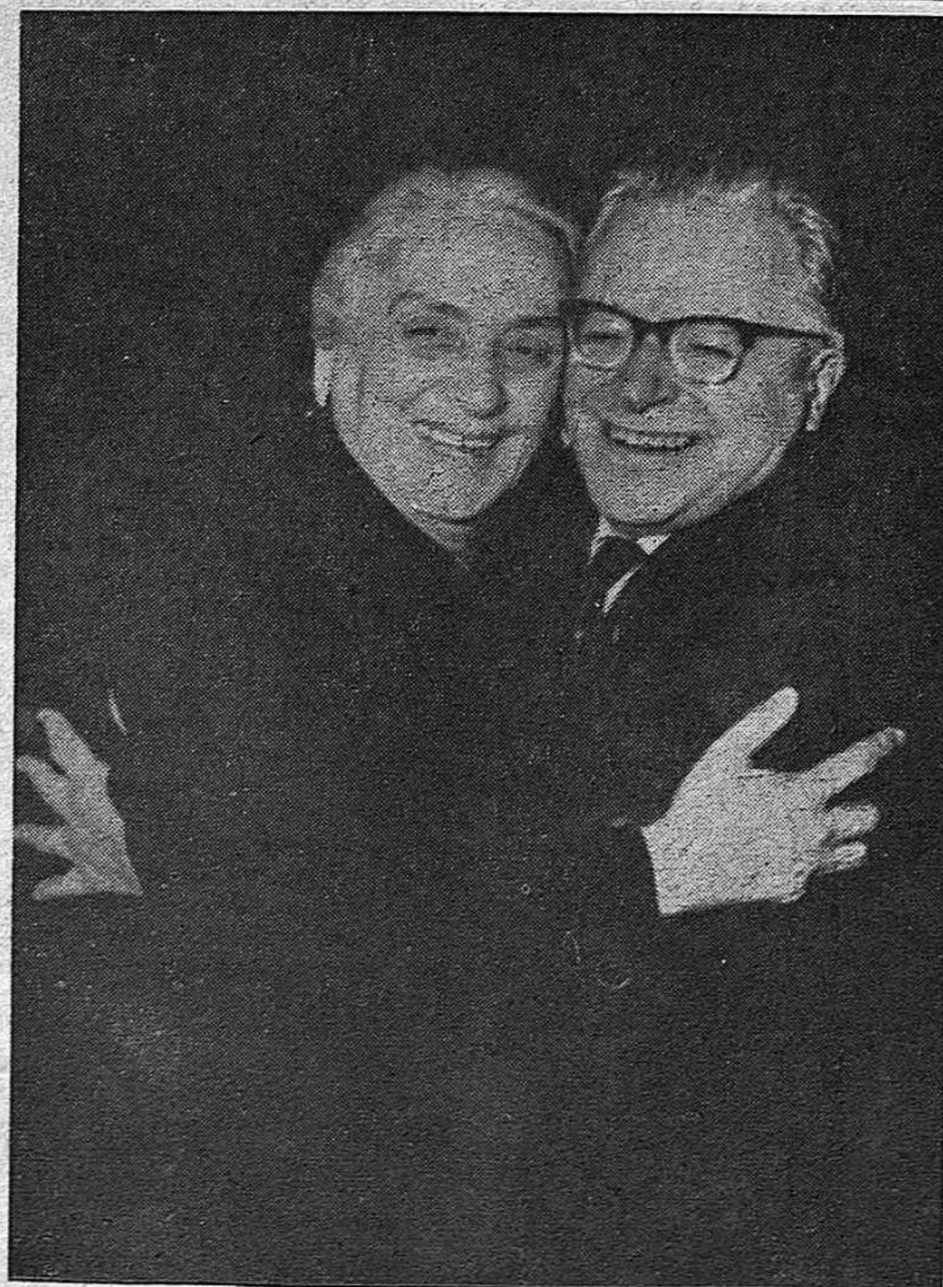
Dos grandes dirigentes: Dolores Ibarruri y Palmiro Togliatti se abrazan en Roma, durante la celebración del Congreso del Partido Comunista Italiano, al cual asistió la presidente del Partido Comunista de España.

Ante las constantes denuncias, dentro y fuera de España, de las torturas que aplican los de la brigada político social a los comunistas y otros antifranquistas que son detenidos, los torturadores están cuidando de no producir huellas en las partes más visibles de los detenidos para dar la impresión, incluso ante familiares de éstos, que no han apaleado. Este refinamiento no podrá encubrir en ninguna forma el hecho real de que continúan torturando y a Lerma lo han sometido, como decimos, a brutales palizas.