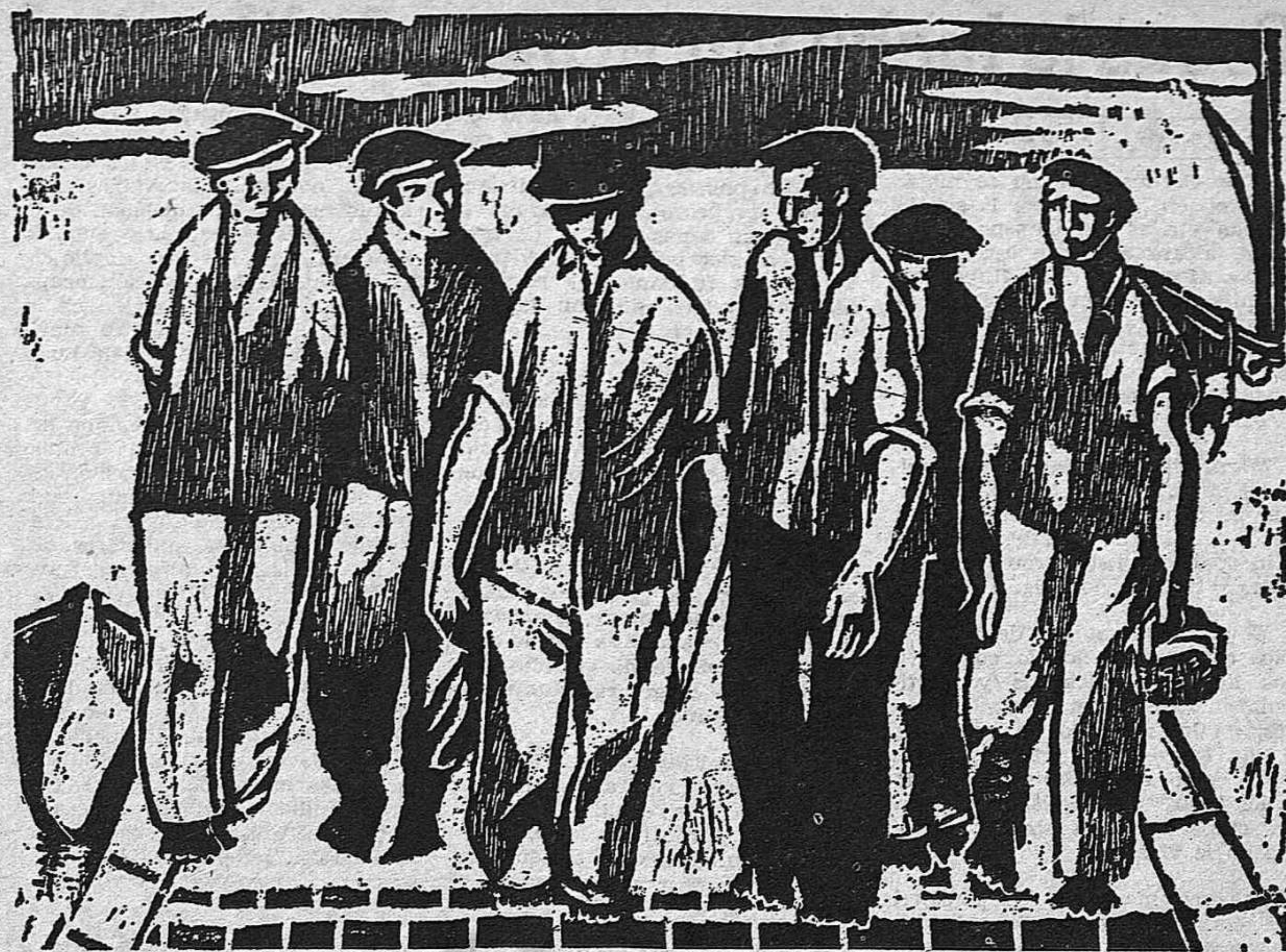
Pescadores: grabado de María Francisca Dapena.

Lisboa, 25-III-63, ADN.— Un tribunal del régimen fascista de Salazar ha condenado a 2 patriotas portugueses a cinco años y medio y a tres años de prisión,