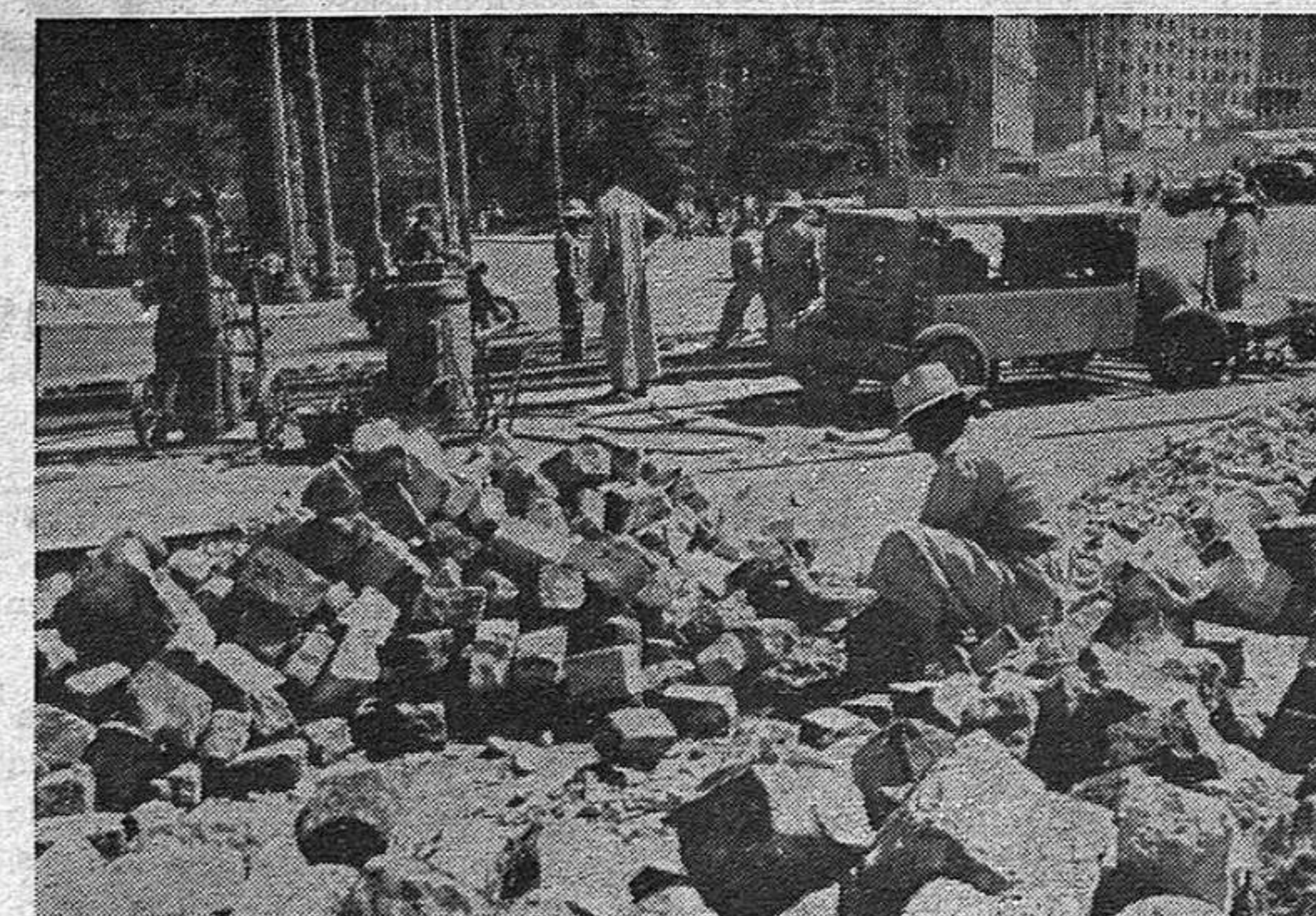
Trabajadores en el arreglo de los adoquines de una calle de Madrid.

Madrid.—Con fecha del 28 de noviembre pasado, se ha hecho