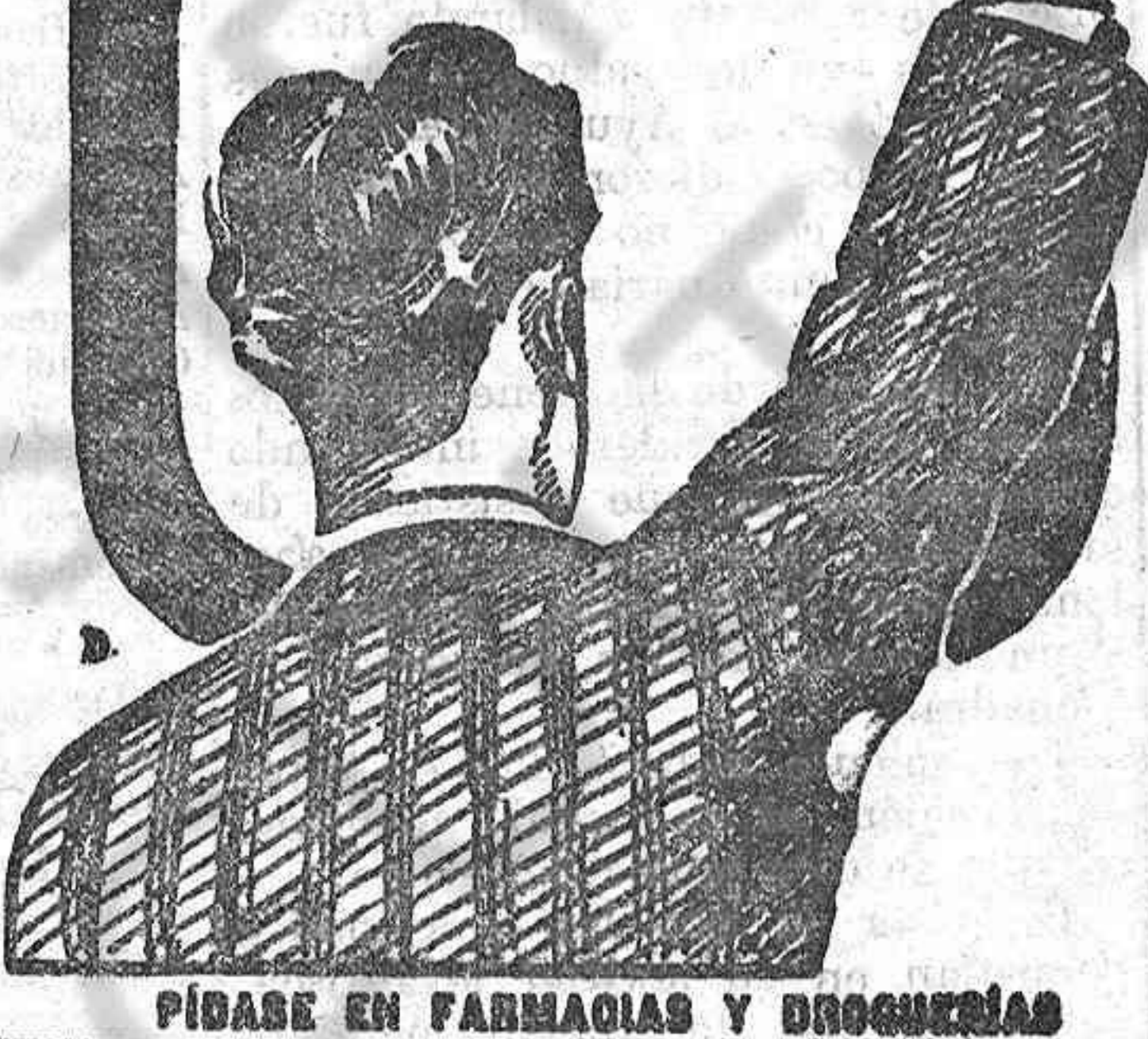
PIBÁSE EN FARMACIAS Y DROGUERÍAS

DA FUERZA, VIGOR Y JUVENTUD y los Médicos le llaman el REMEDIO DE LOS DÉBILES