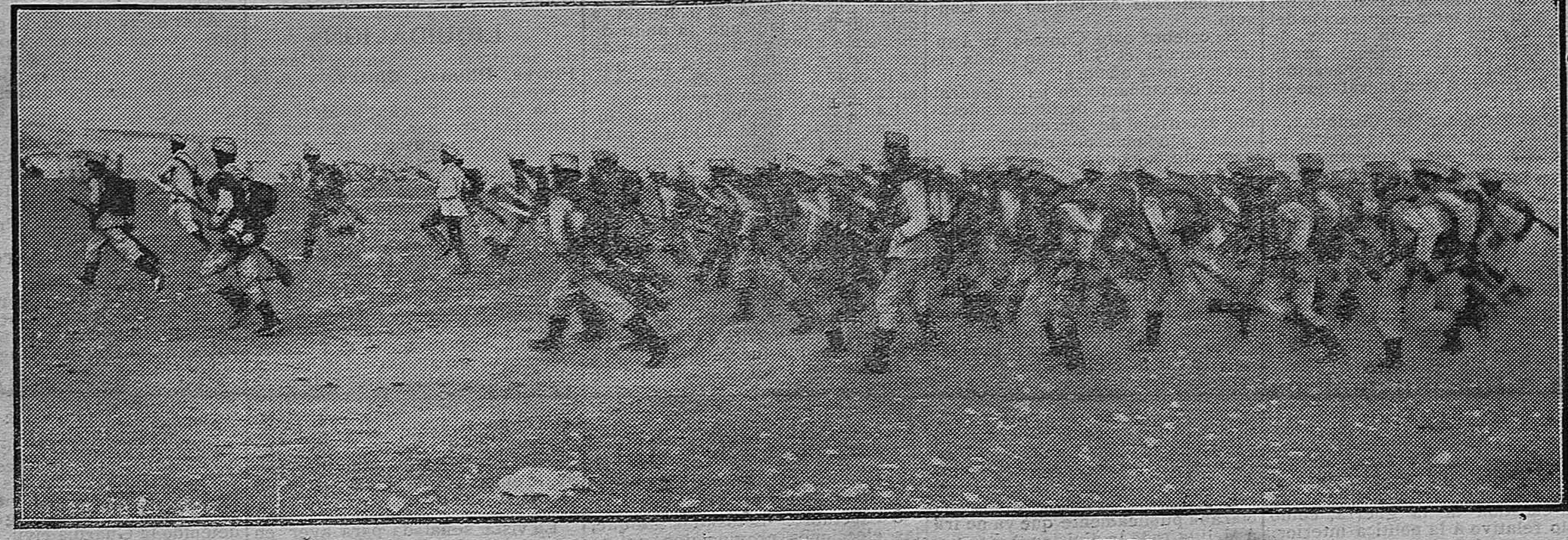
BATALLÓN DE INFANTERÍA ENTRANDO EN FUEGO

PEREDA Oculista, Muro de la Penitencia, 18 ent. 6 Consultas: diaria de 11 a 1 y de 3 a 4 Dr. Iriarte A. ANTA MOBILIARIOS COMPLETOS FRENTE AL TEATRO MUEBLES ALMACEN de Francisco Massó San Bartolomé, 14.