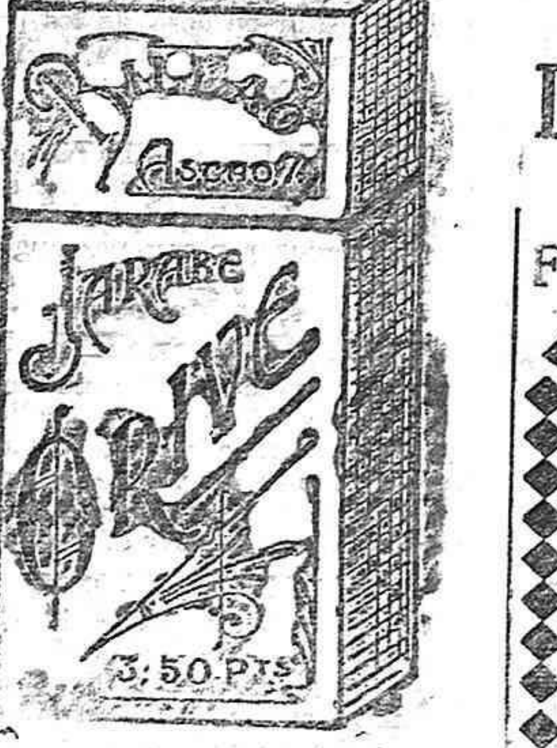
Los infalibles resultados del Jabón Orive no se hacen esperar en la curación de la tos, catarros, bronquitis, etc.