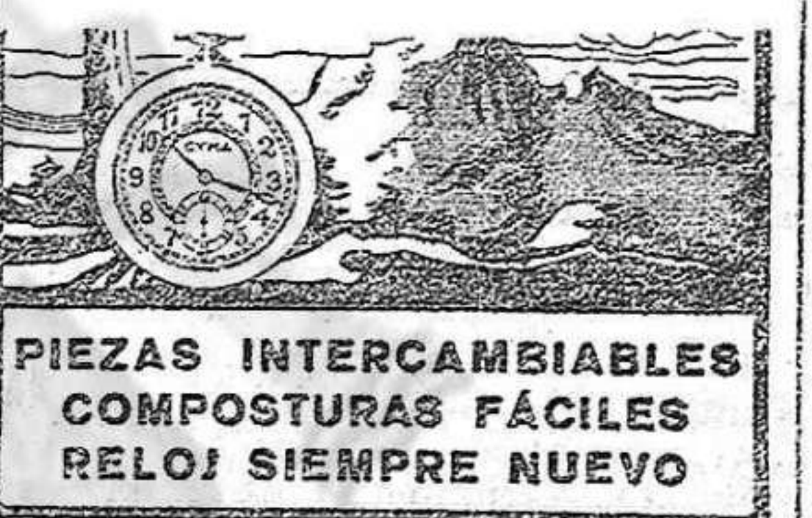
PIEZAS INTERCAMBIABLES COMPOSTURAS FÁCILES RELOJ SIEMPRE NUEVO