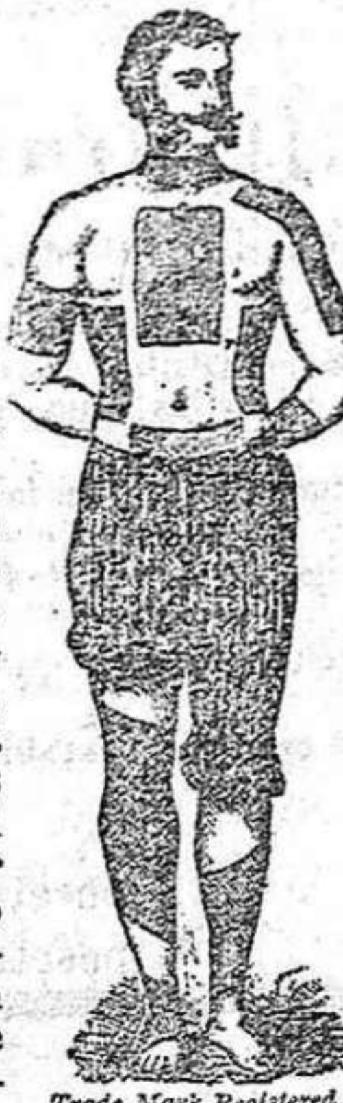
Trade Mark Registered

Los comerciantes, banqueros, sacerdotes, estudiantes, dependientes mecánicos y empleados de ambos sexos, cuyas ocupaciones les obligan á estar constantemente sentados y están expuestos á contraer dolores por falta de un ejercicio propio para sus miembros ó cuerpos, deben recurrir á los Emplastos perforados del Doctor Winter en el momento que sientan cualquiera sensación desagradable que afecte sus cuerpos.