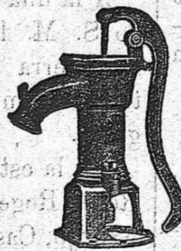
BOMBA PARA RIEGOS