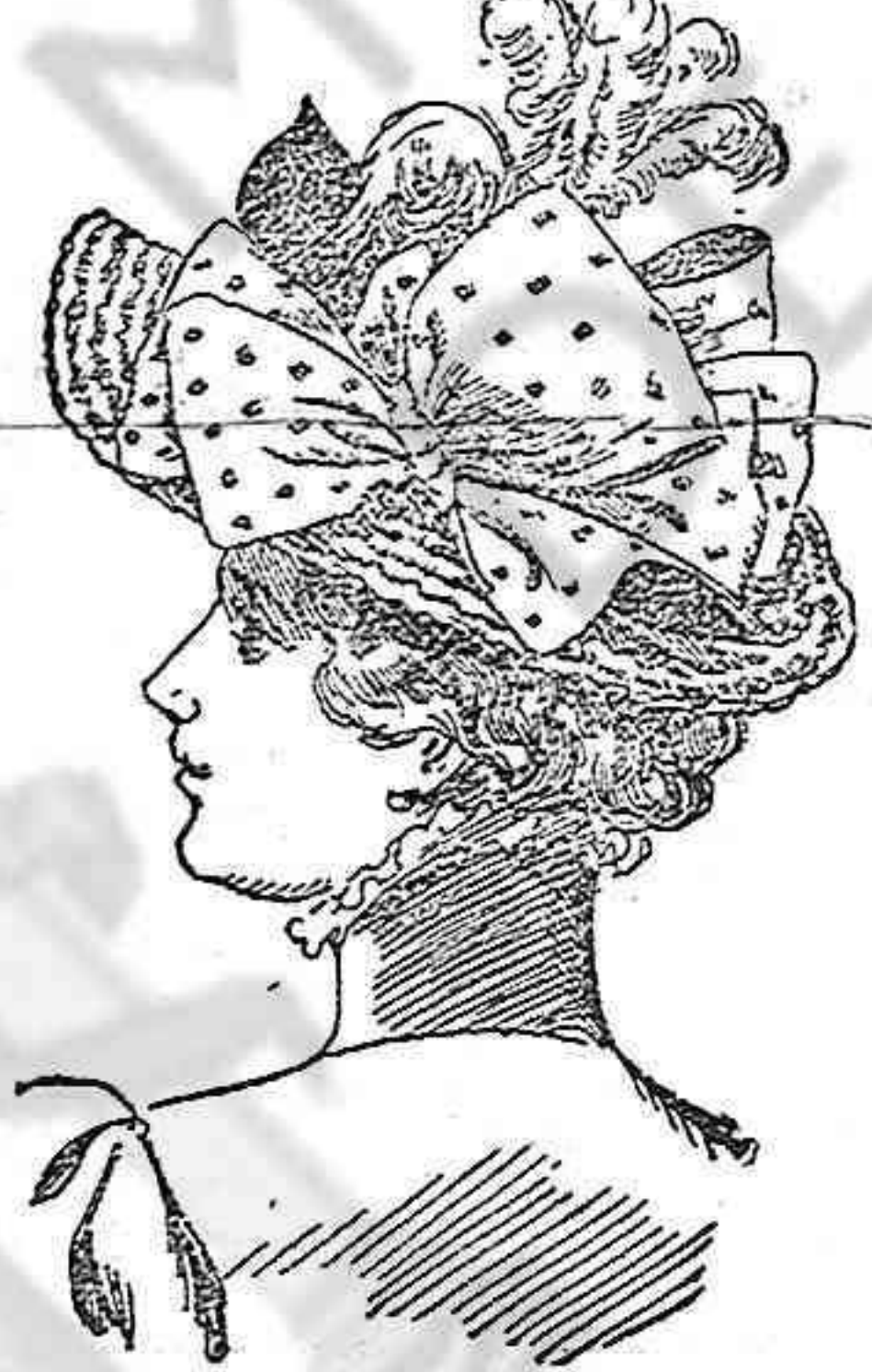
Sombrero de verano

La forma de paja negra va completamente cubierta de pequeños hilos de azabaches dispuestos de modo que llenen el espacio comprendido entre las trenzas de la paja. La parte que corresponde al frente está ligeramente vuelta hacia arriba y lleva como adorno un grupo de pequeñas flores en el centro.