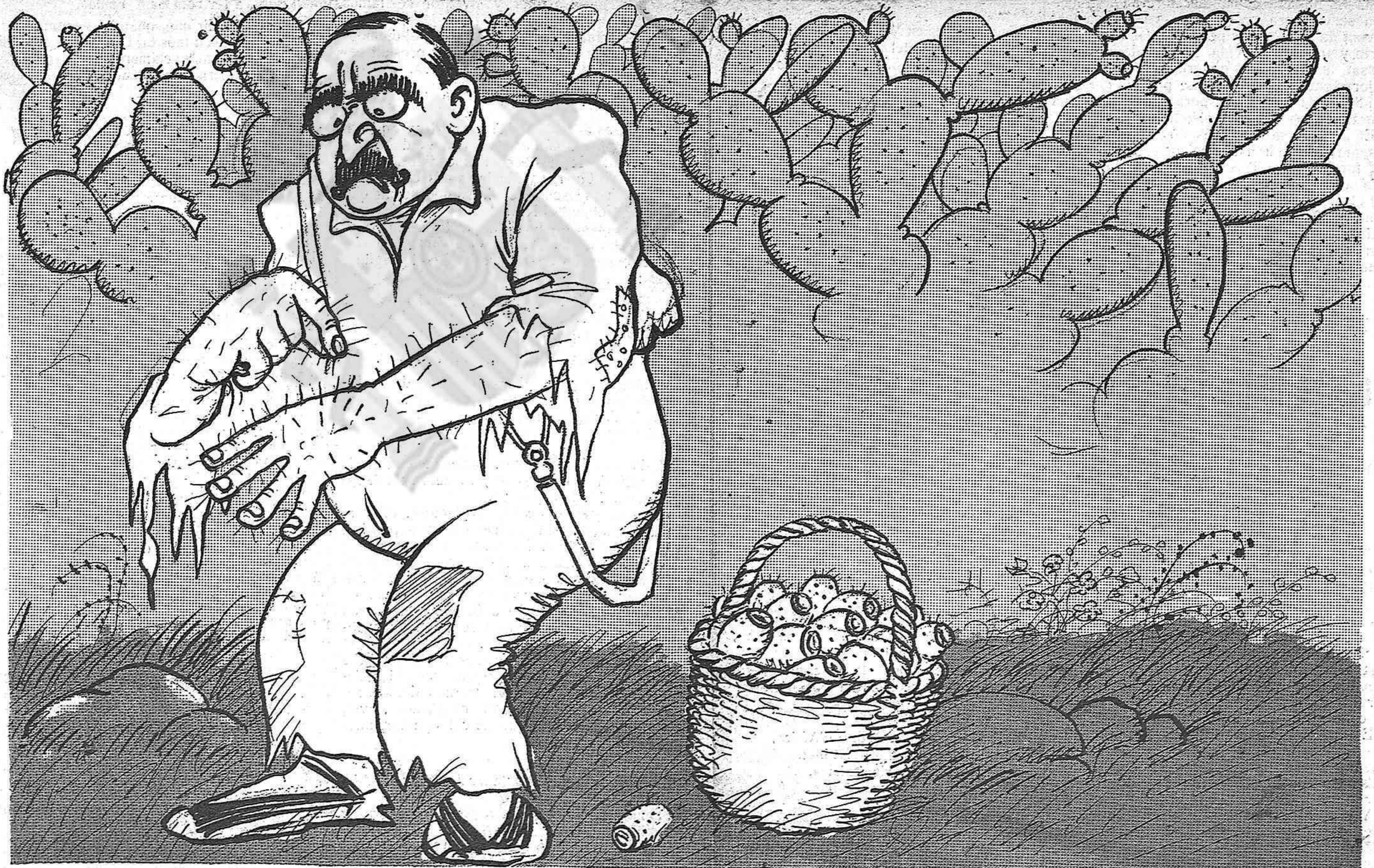
FRUITA DEL TEMPS

L'imperi municipal del lerrouixisme està a les acaballes. Aviat l'enterrarem els barcelonins. Ell mateix s'haurà colgat sota un munt de pútrid fang.