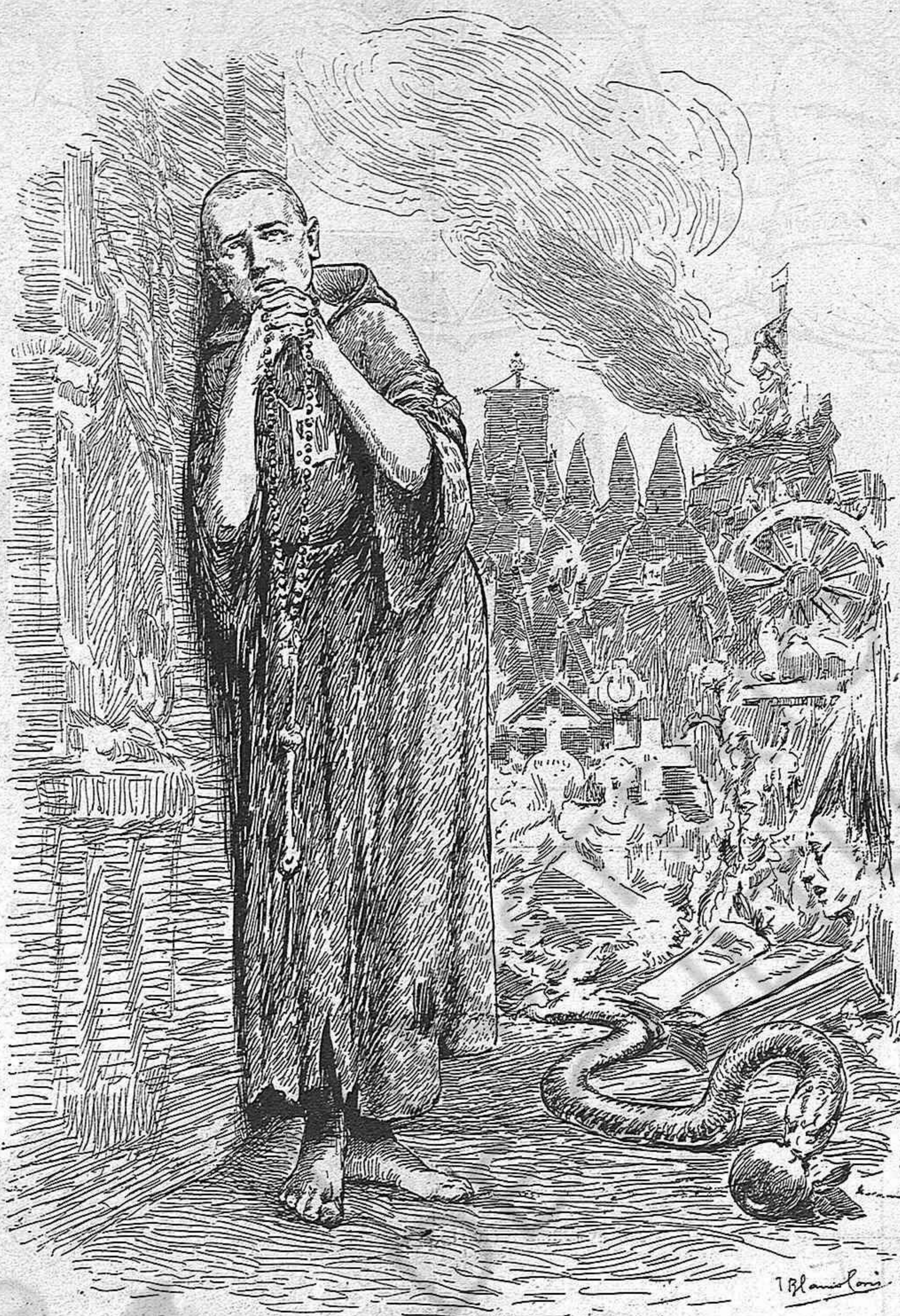
—Si, l'aniversari d'allò... Y el centenari d'altres tragedies, de les quals nosaltres n'erem els autors.

No sé per què, fa l'efecte de que'l govern espanyol ha arribat més enllà de lo que volia en la seva intervenció al Marroc... ¿Es que hi ha una voluntat diversa de la seva y a la qual no se sent ab forces pera desobeir?—Es trist, lectors meus, que l'infracció constitucional que ha suprimit a Espanya la llibertat d'impremta