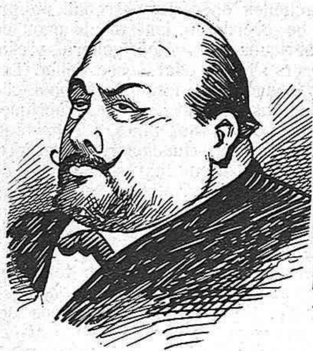
Duc de Solferino