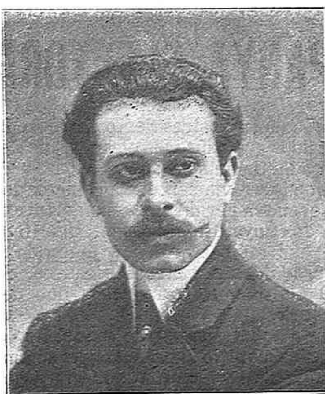
Adolf Pujol y Brull