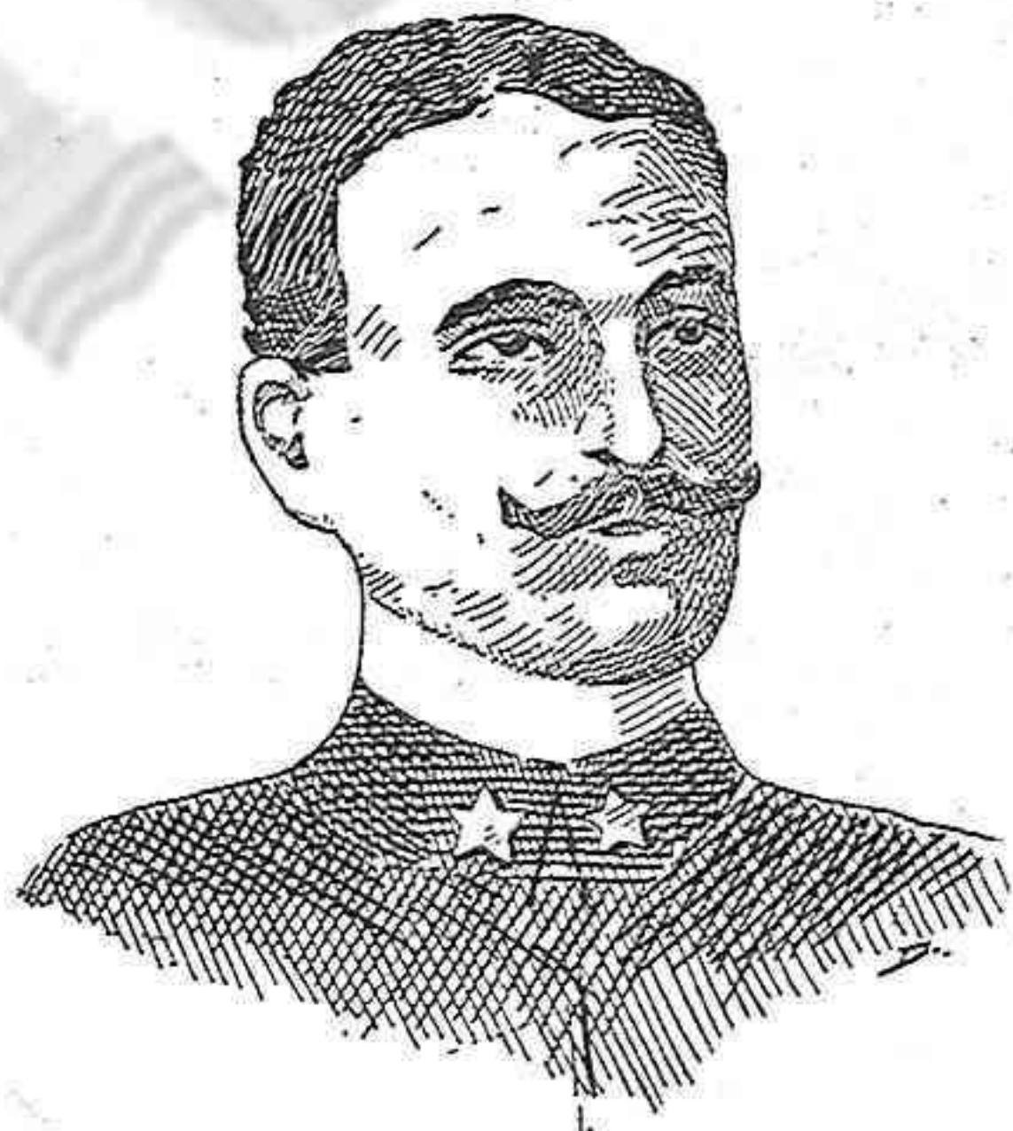
El baró Vicents Paternó