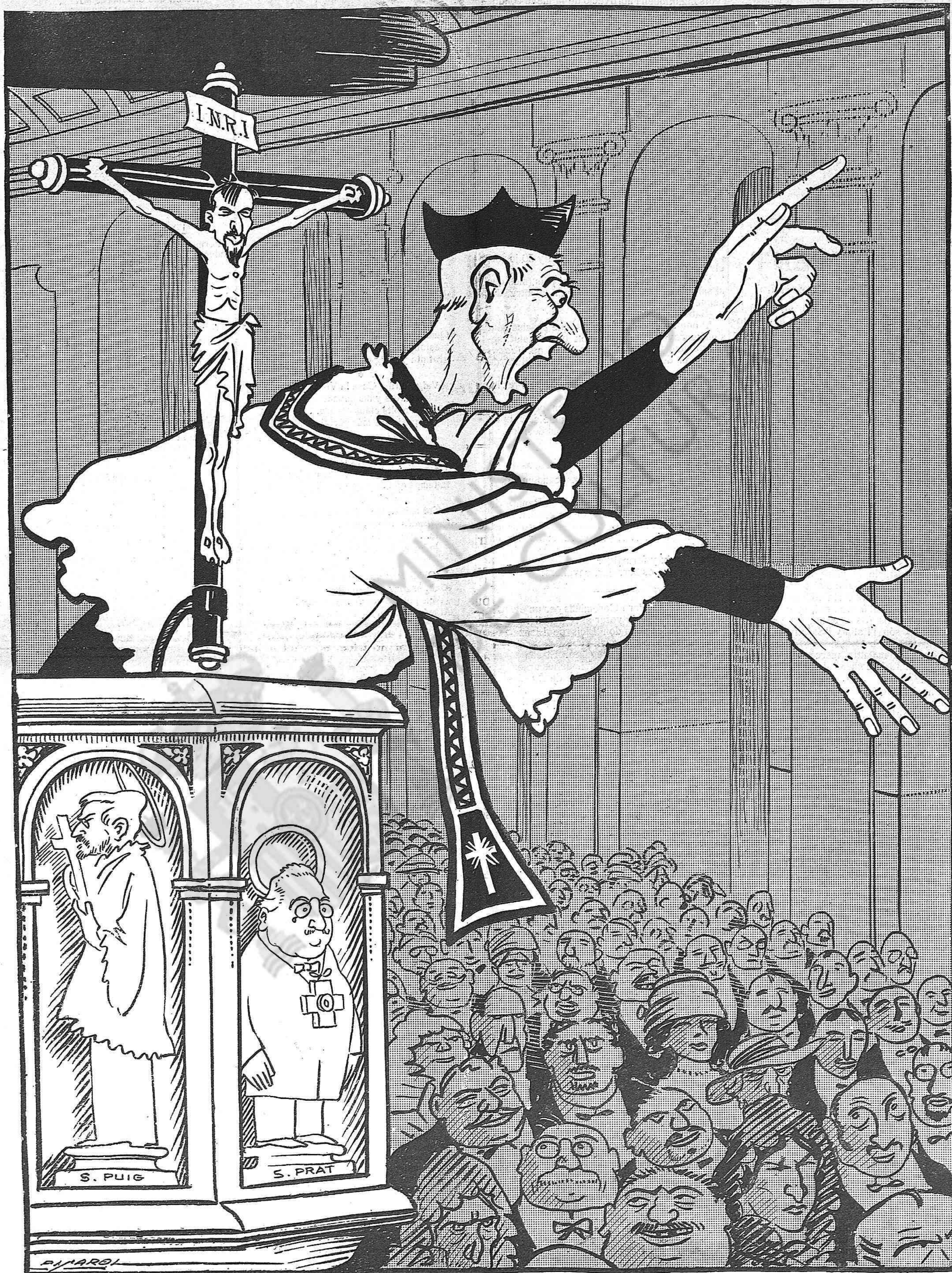
—¡Feligresos! Deixemnos de religió y de romansos. Aquets dies, no hi ha més religió que la política.