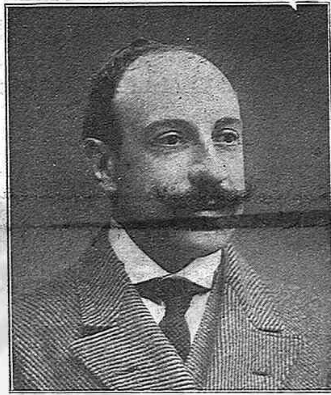
Santiago Gubern y Fàbregas