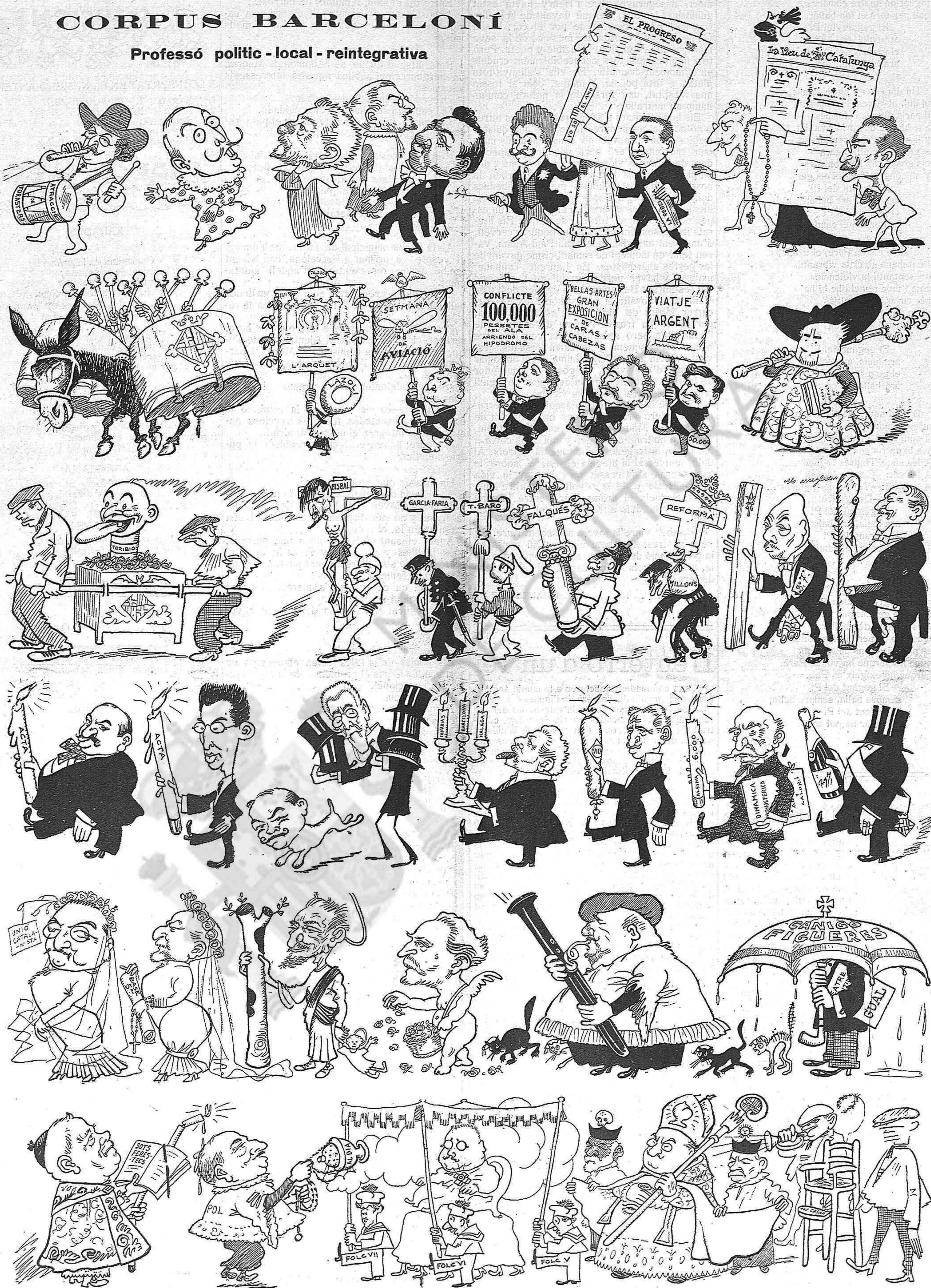
Assentat y sense empentes — ni olor de cera cremada — aquí veus, lector caríssim, — passar tota la llopada.

Professó polític - local - reintegrativa