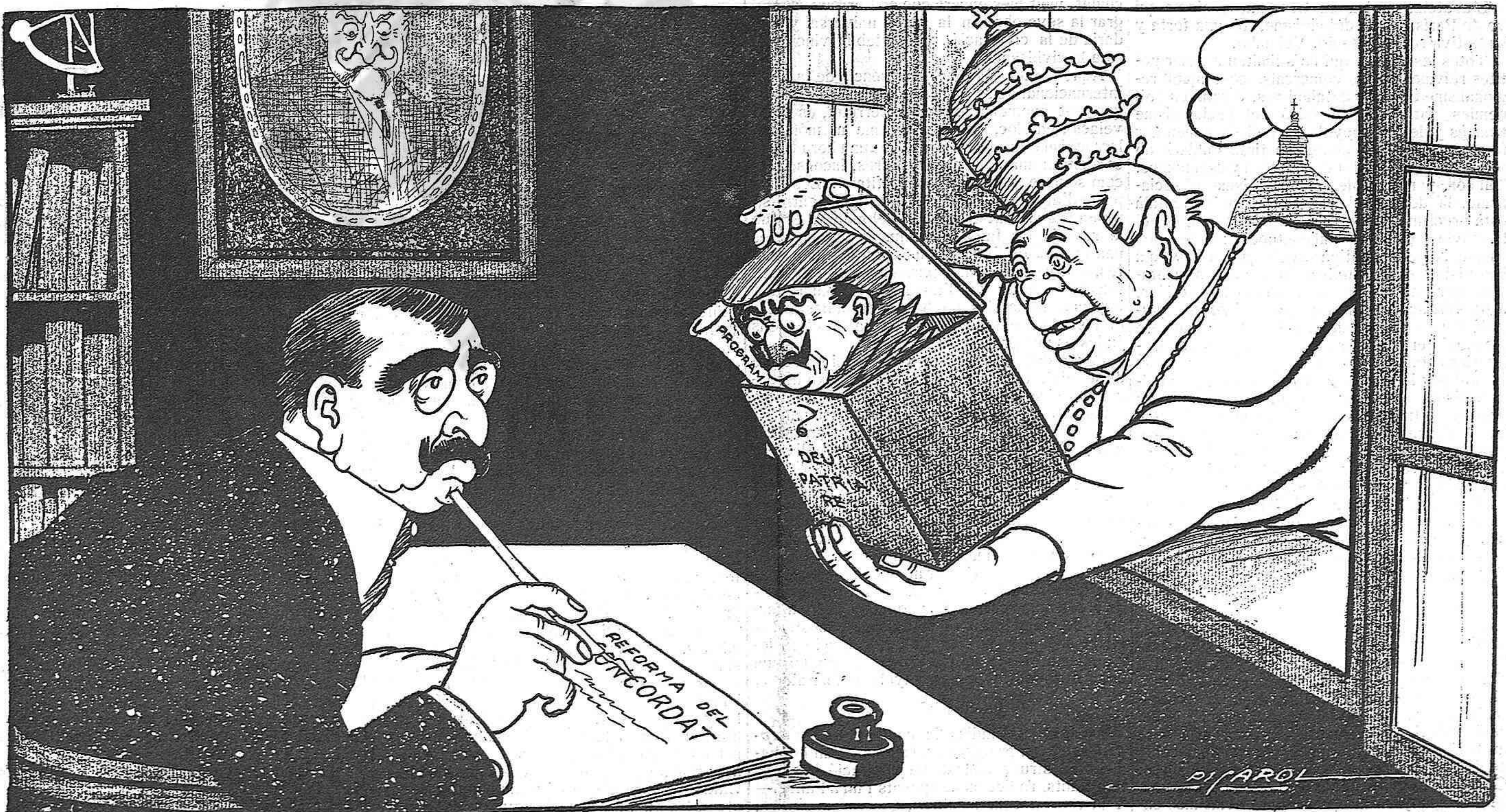
—Veshi ab cuidado ab aquet memorial, perquè, segons lo que hi posis, ¡mira què tinc a punt!