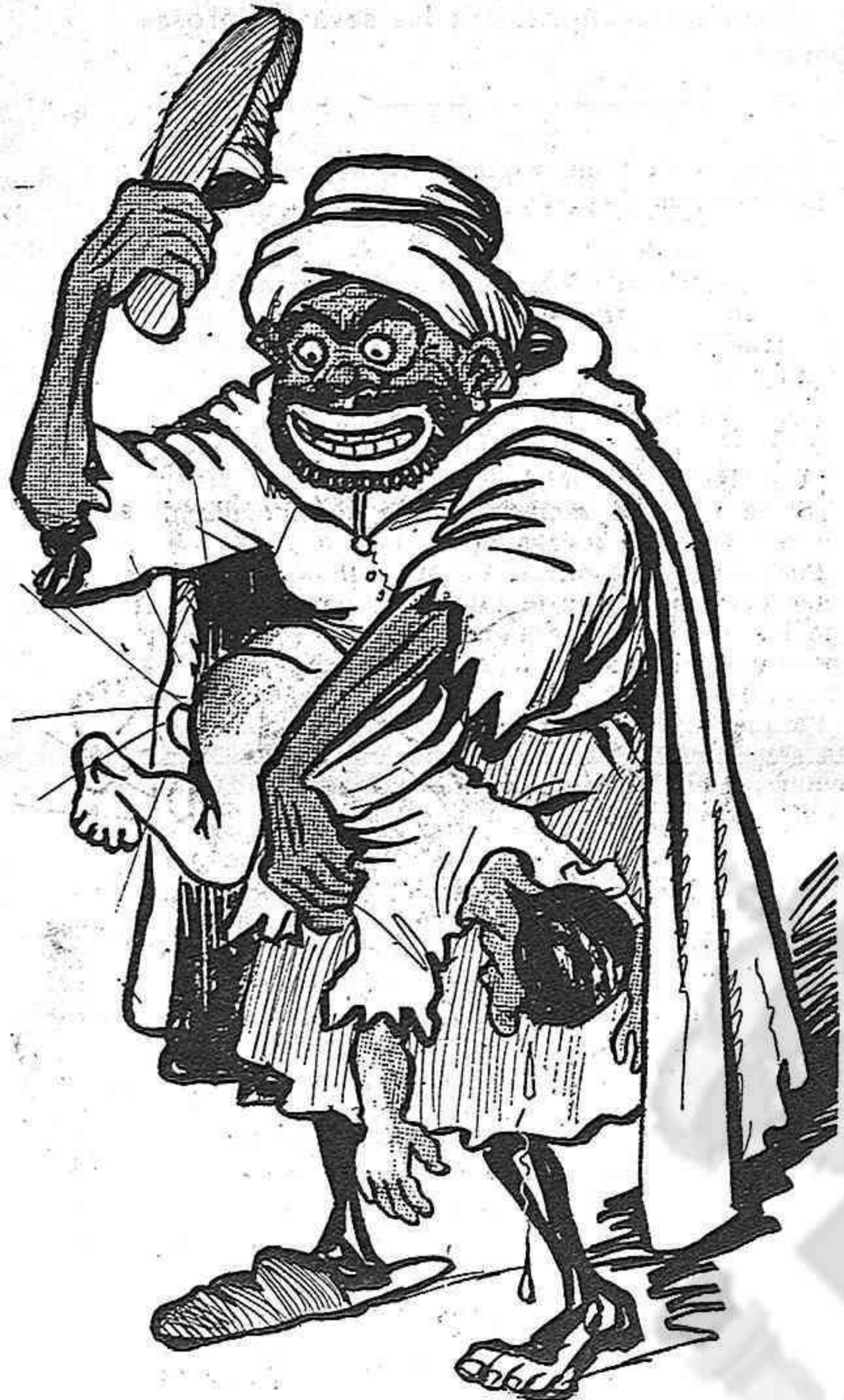
Inculcant la santetat per medi del sabatot.