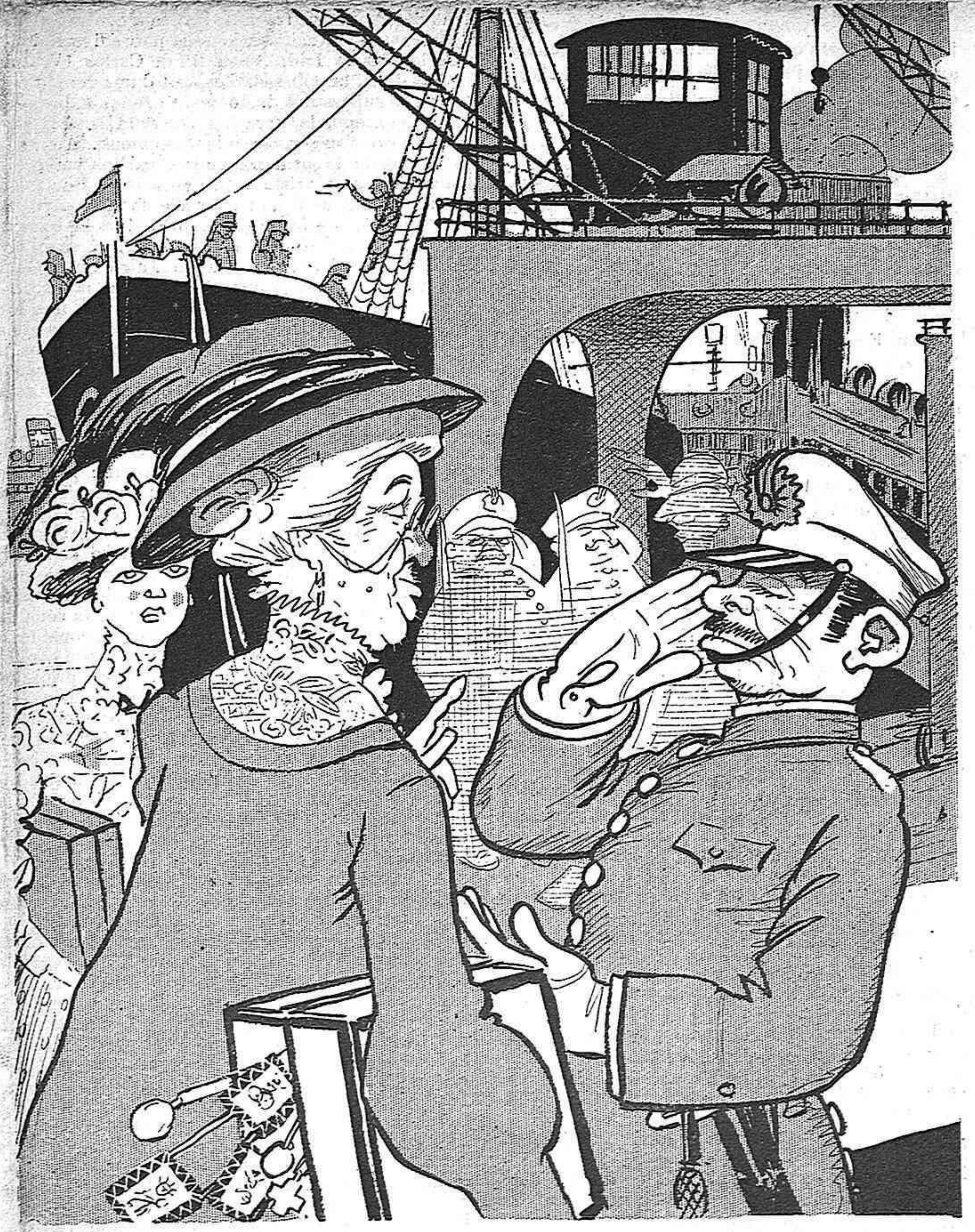
—Venía á repartir unas medalletas... —¡Pase V., señora!