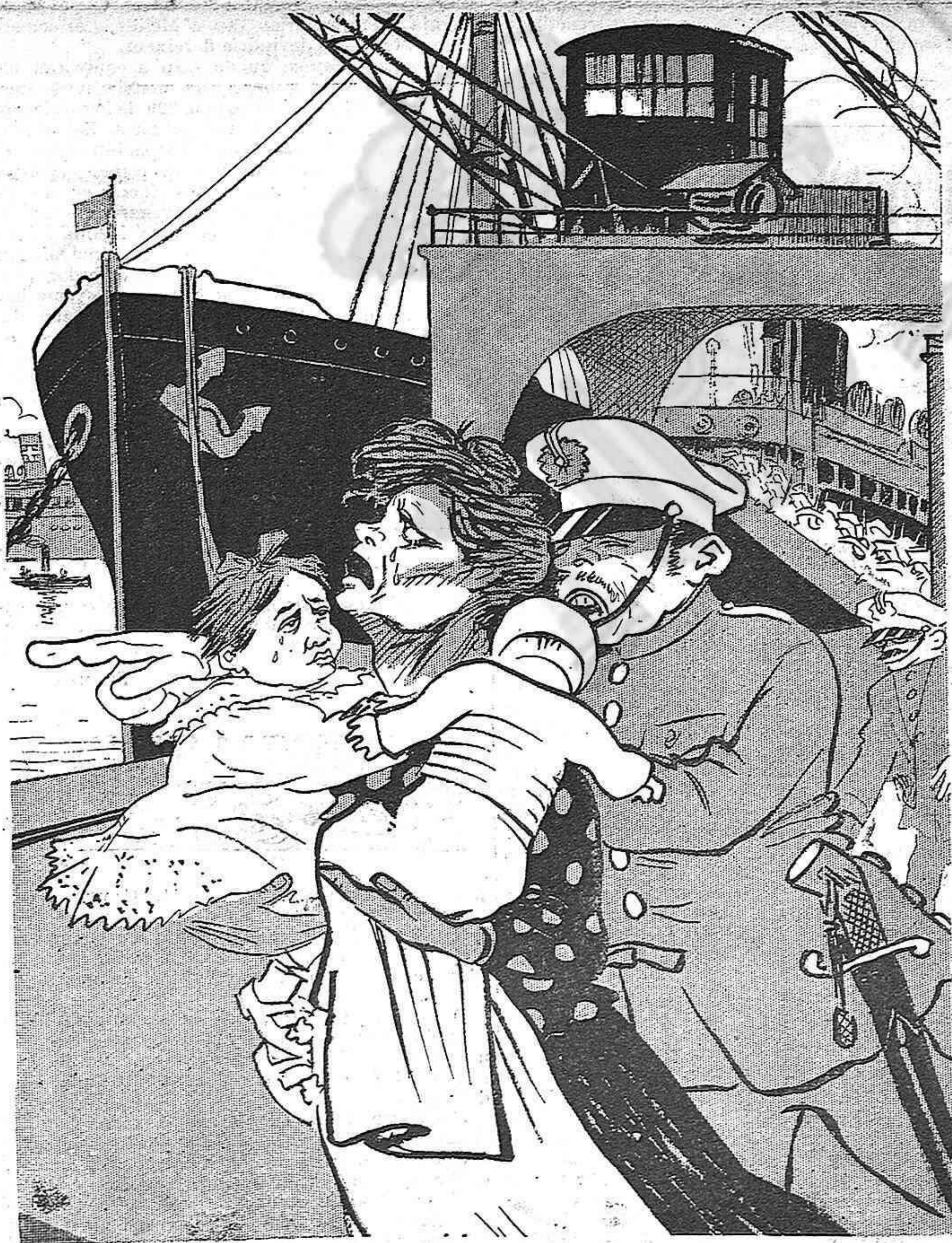
—Volía despedirme de... —¡Atrás!