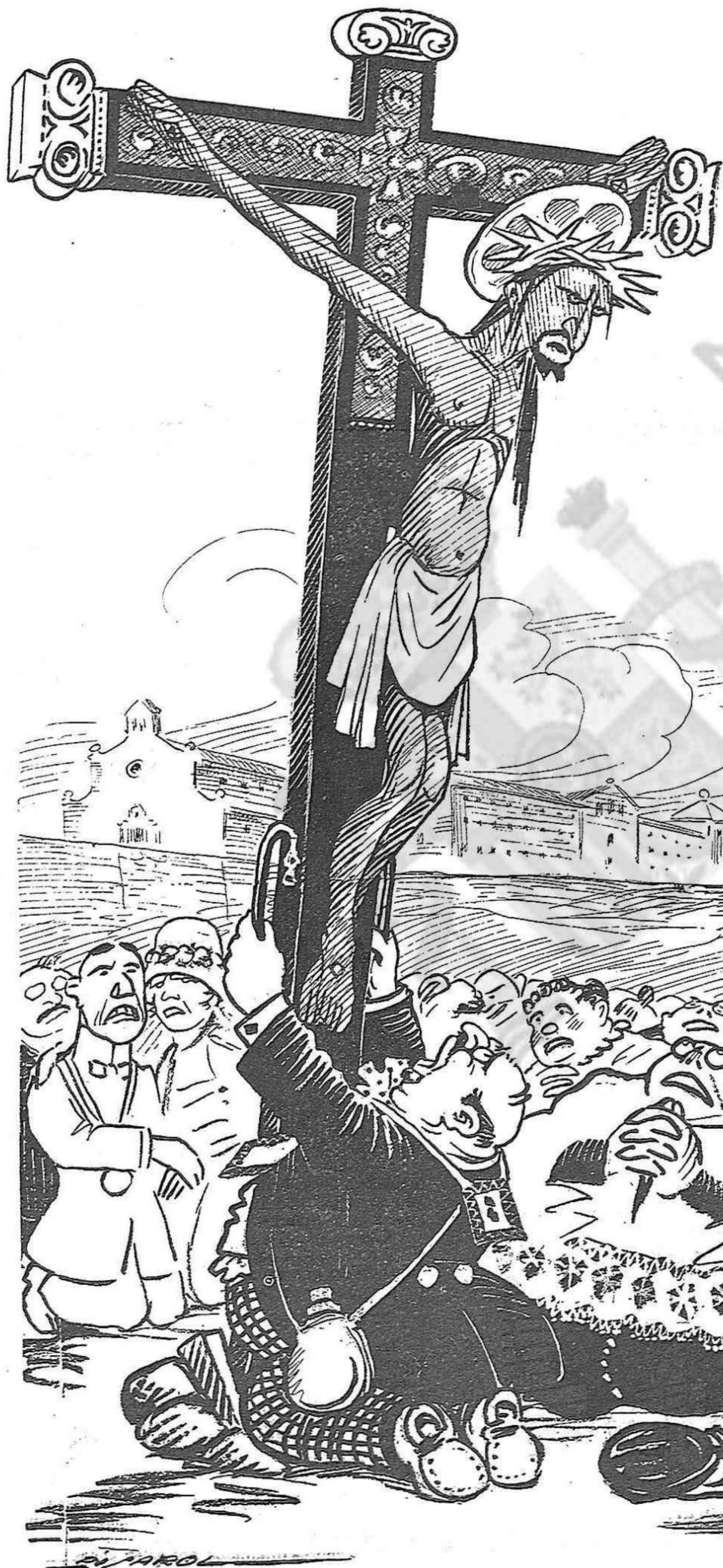
EL CRUCIFICAT:—Menos cansons, amichs, menos cansons!... Lo que hauríau de fer es callar... y treure'm de la creu.