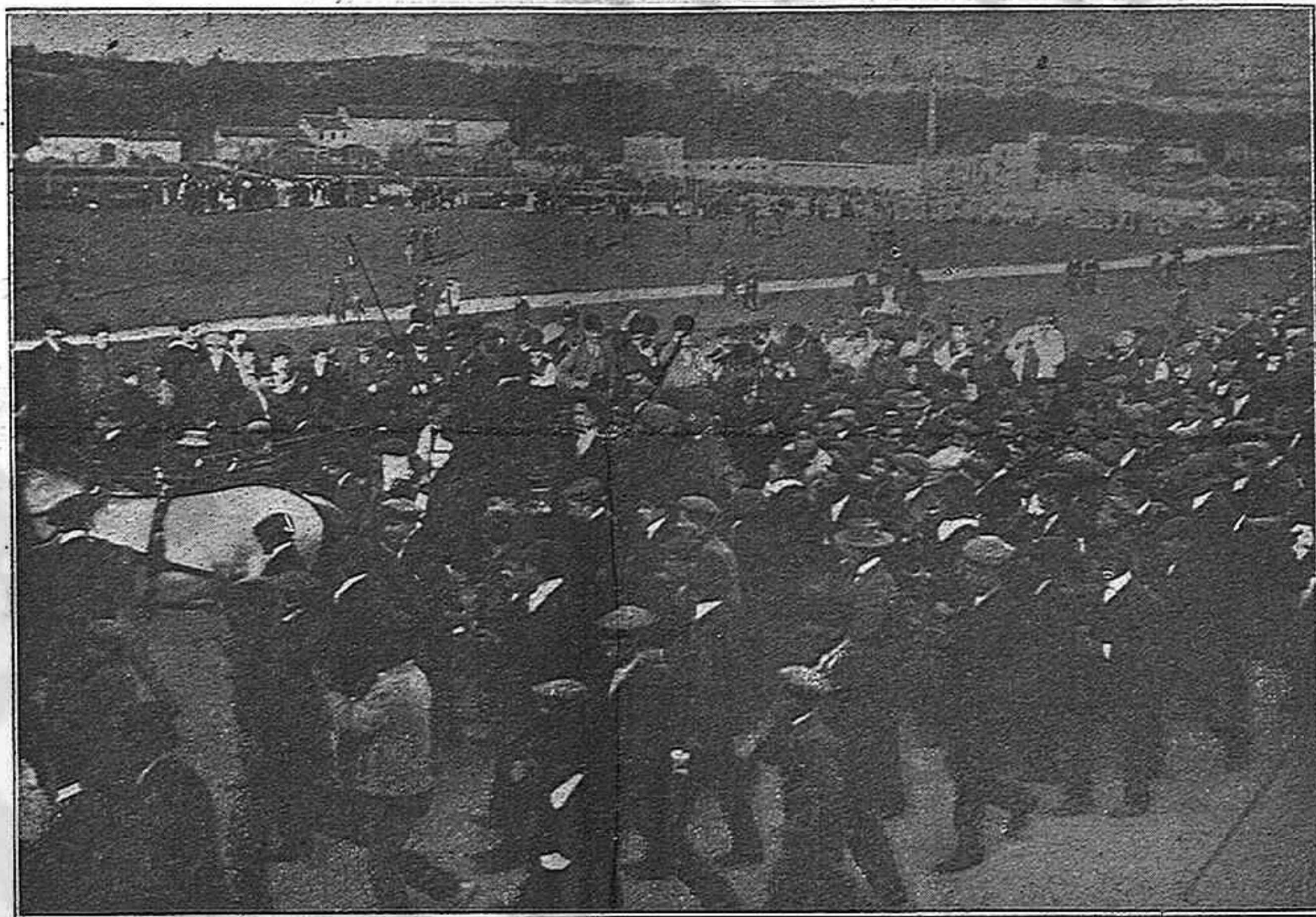
Brenar de protesta, celebrat á la font de la Teja, de Madrid, el passat diumenge.

participi dels nostres desafectes y dels nostres particulars punts de vista, y creyentnos obligats á no pertorbar la lluyta, callarém els nostres escrúpols y cumplírem el nostre deure de treballar pel triomf de la candidatura que acordin els antics partits federal, progressista, unió y nacionalista, convertits en un sol partit republicà de Catalunya.