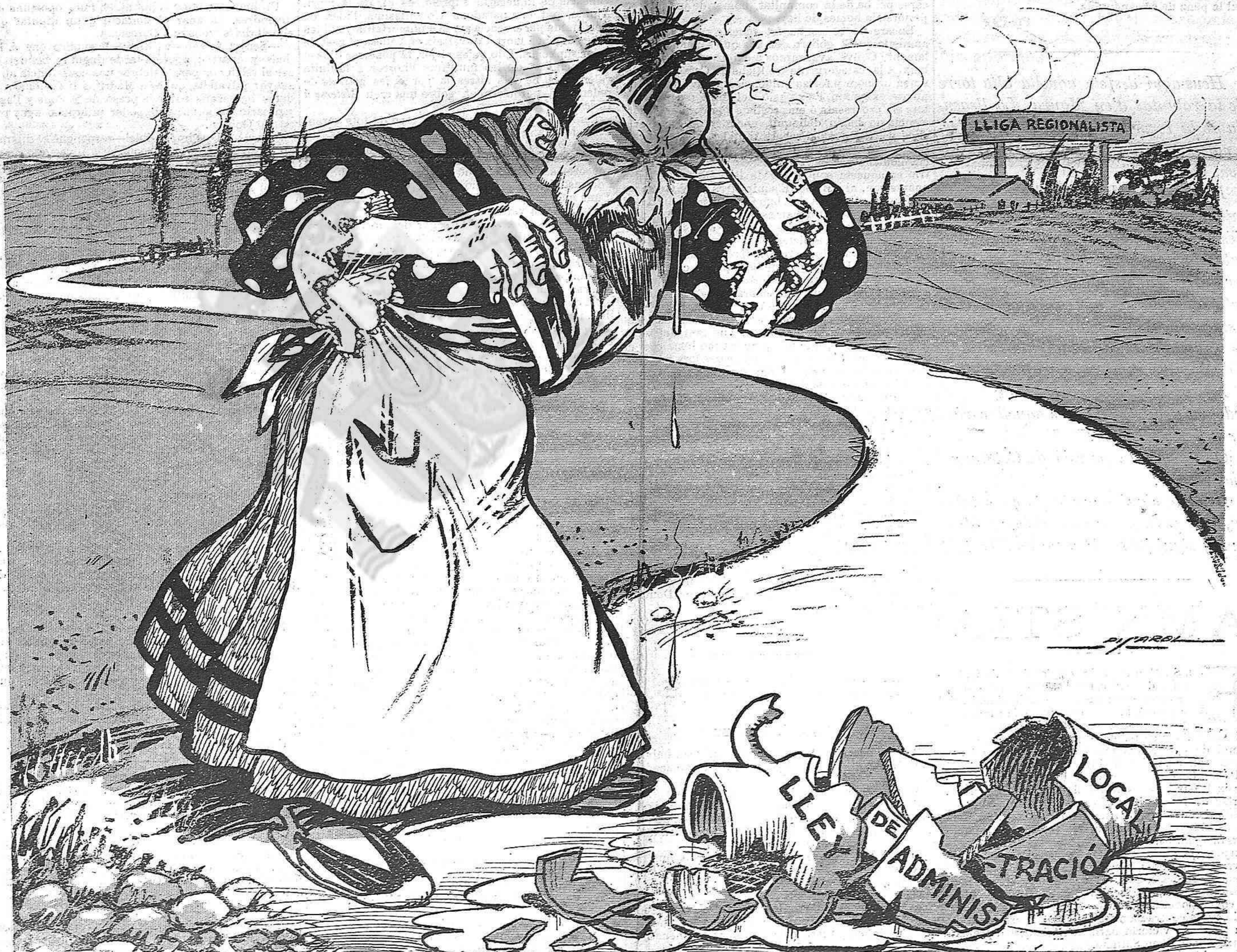
—¿Elecciones d' ajuntaments, y la ley de Régimen local no está aprobada?... ¡Se m' ha trencat el gerrol!...