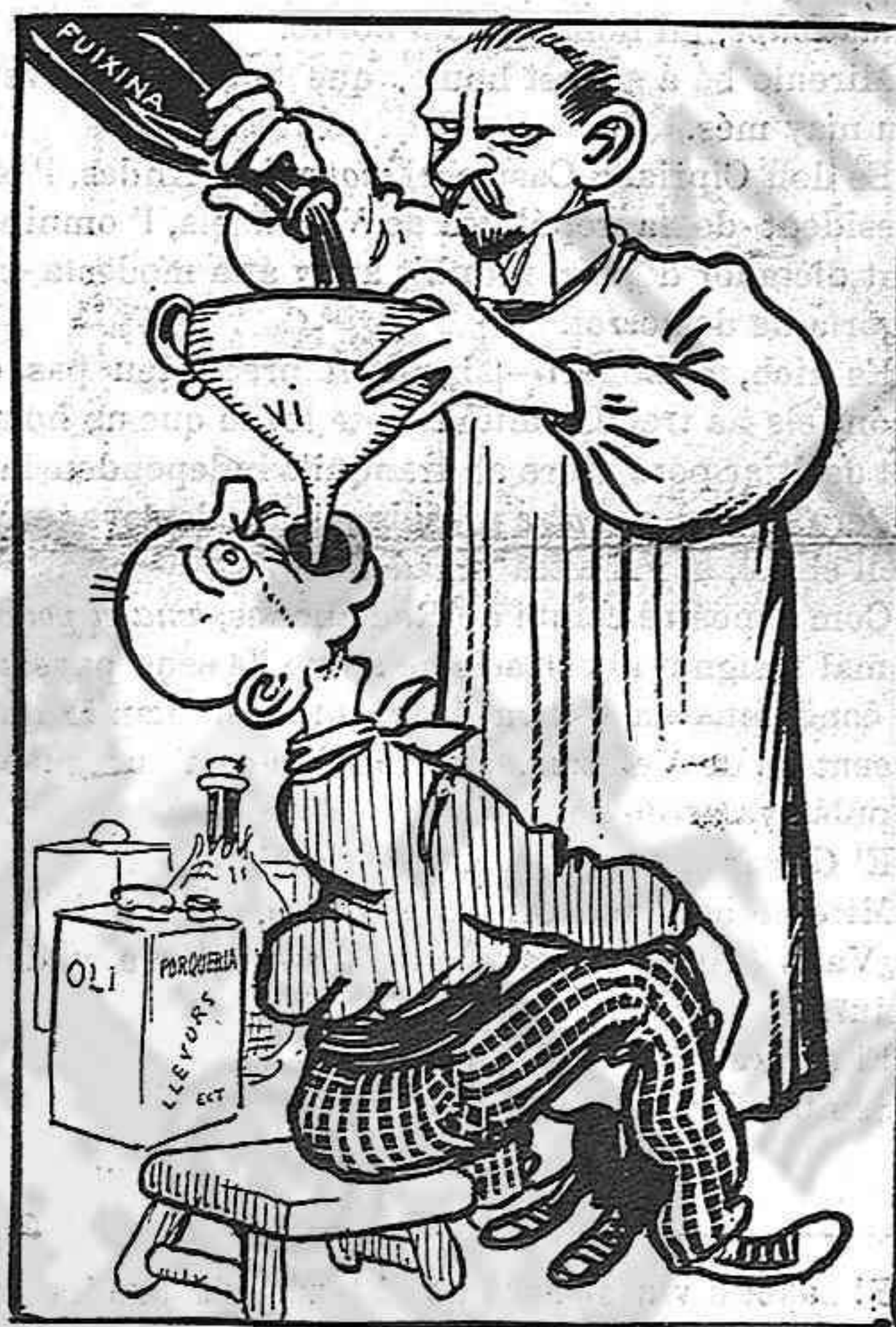
El dilluns li sofistican la beguda, els aliments, l'ayre que respira.