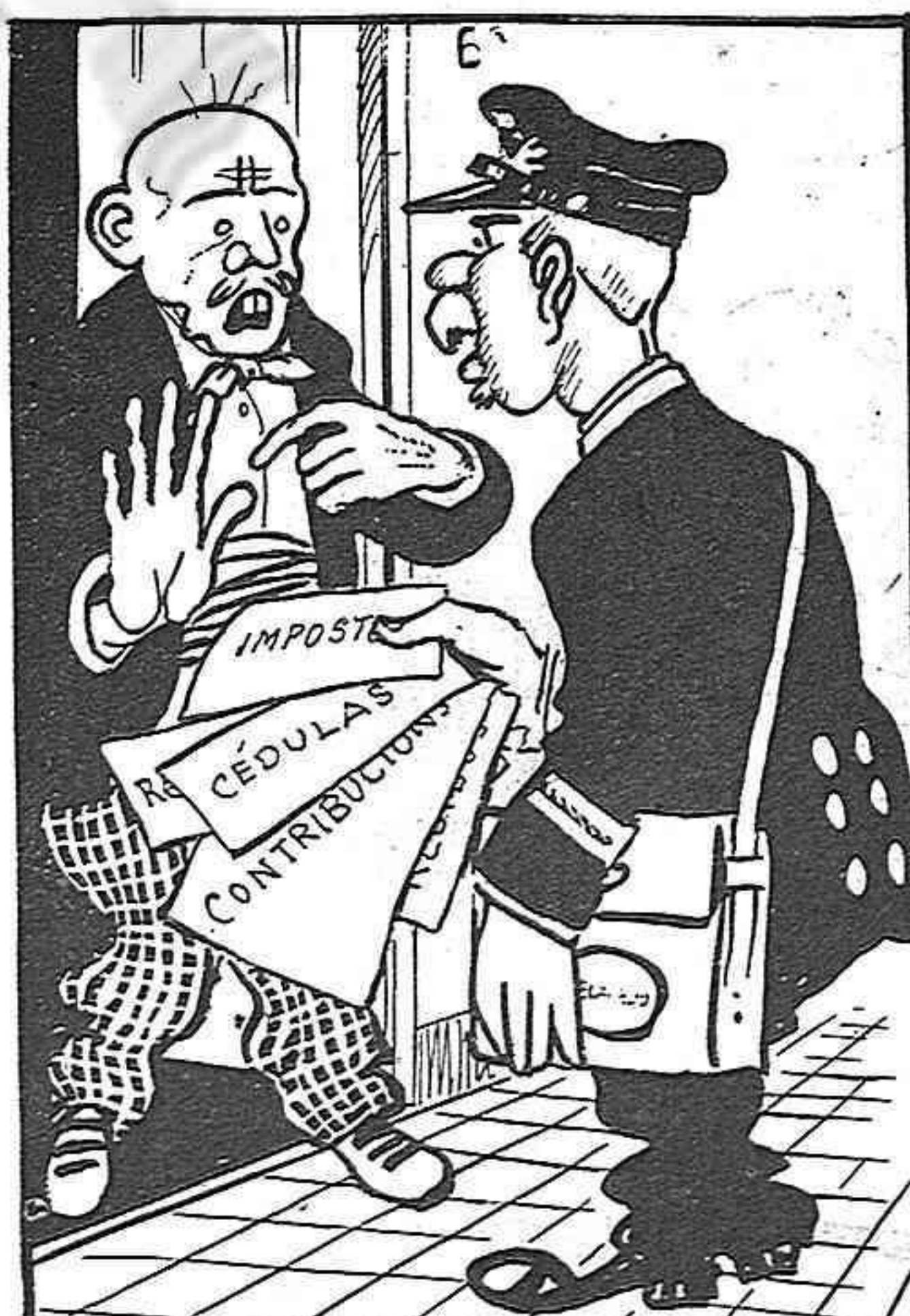
El divendres li compareix el de las contribucions.