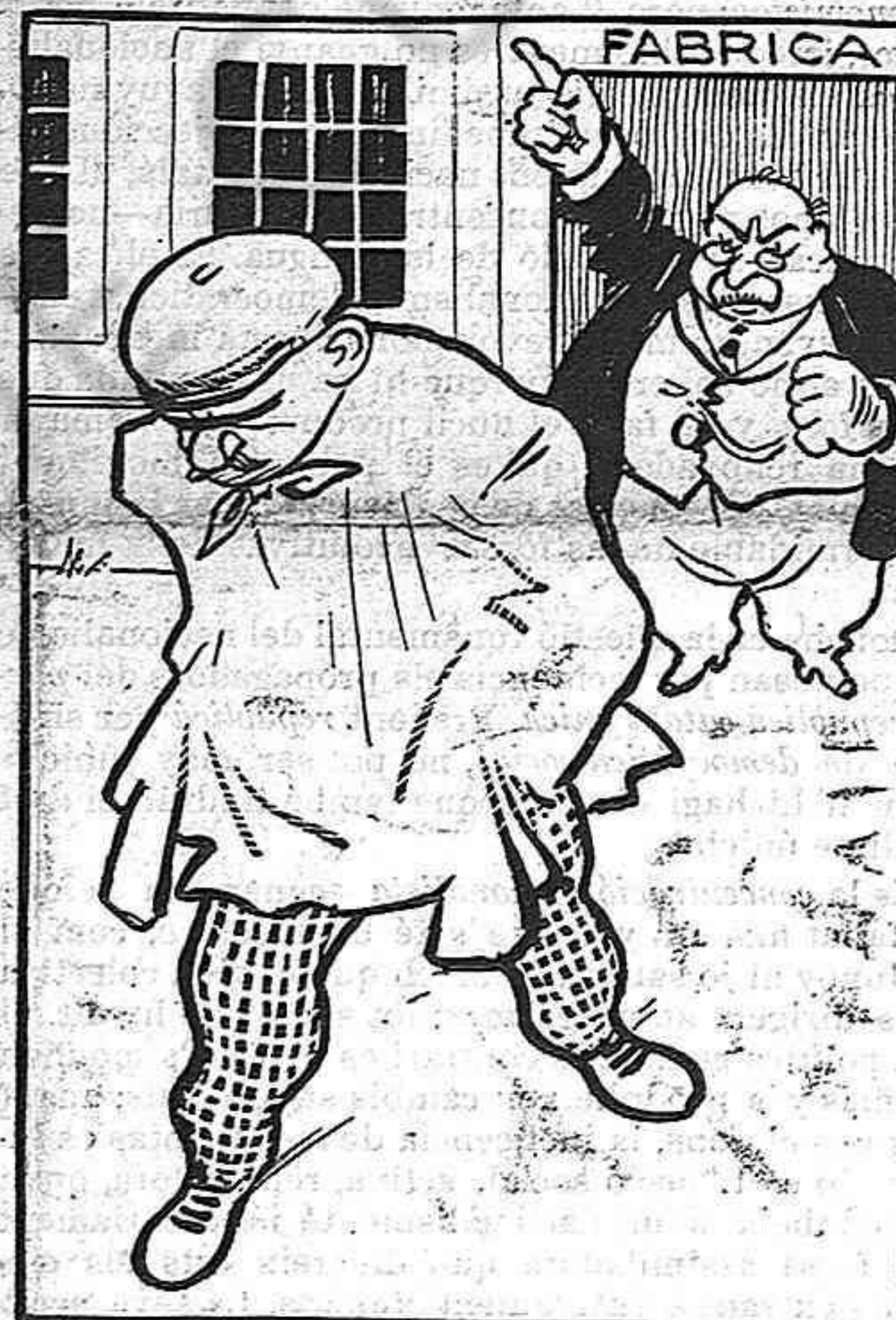
El dimars li diuen que s'ha acabat la feyna.