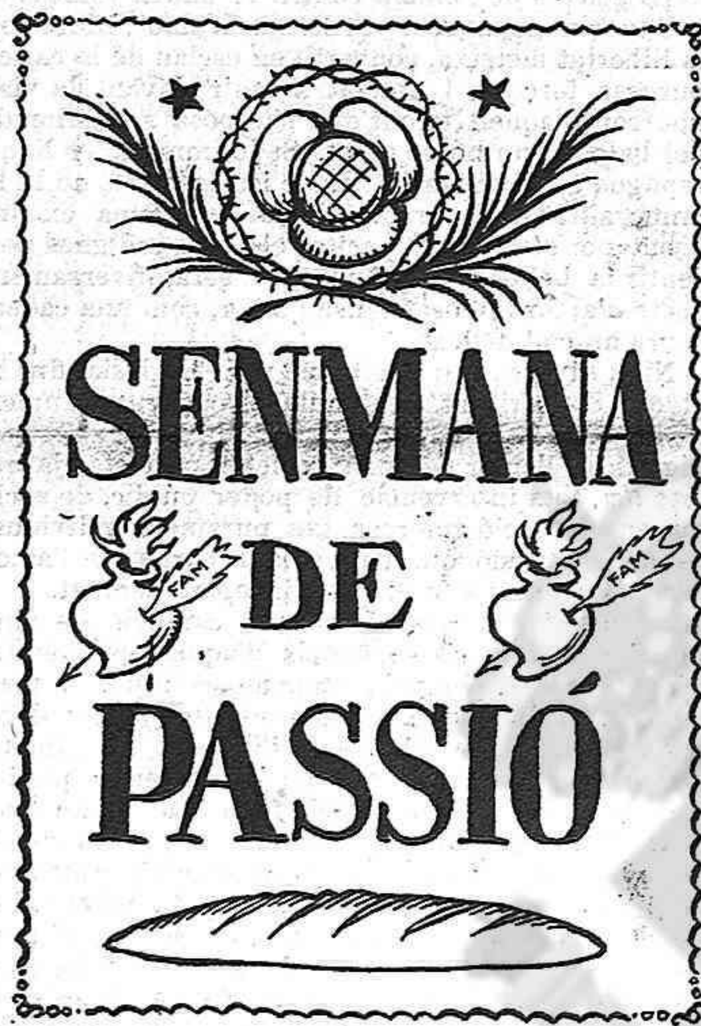
Per si may no l'heu passada, mireula aquí retratada.