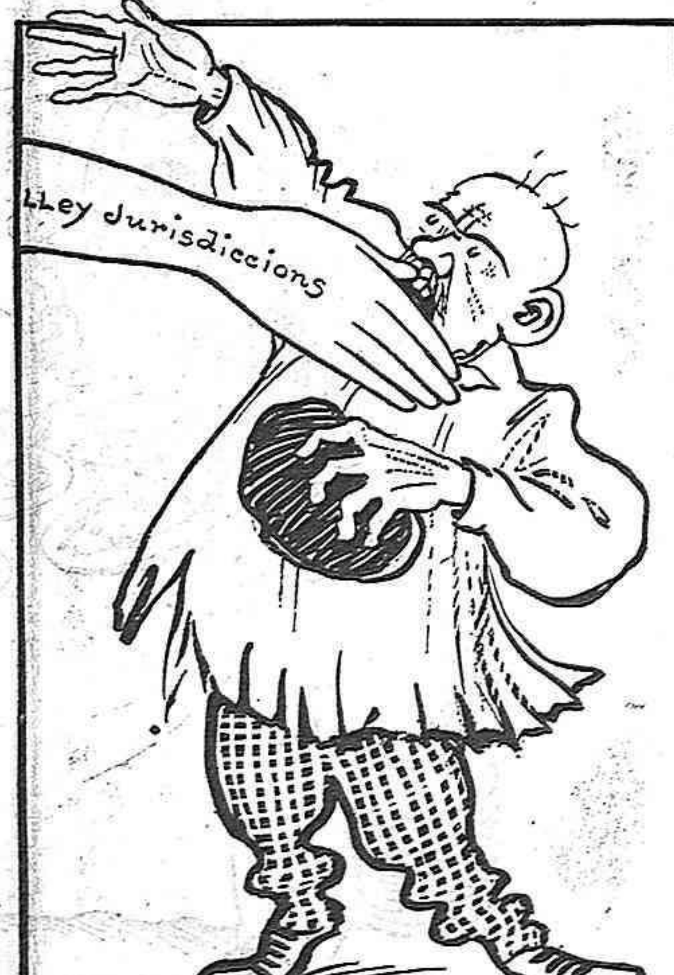
El dissapte li tapan la boca.