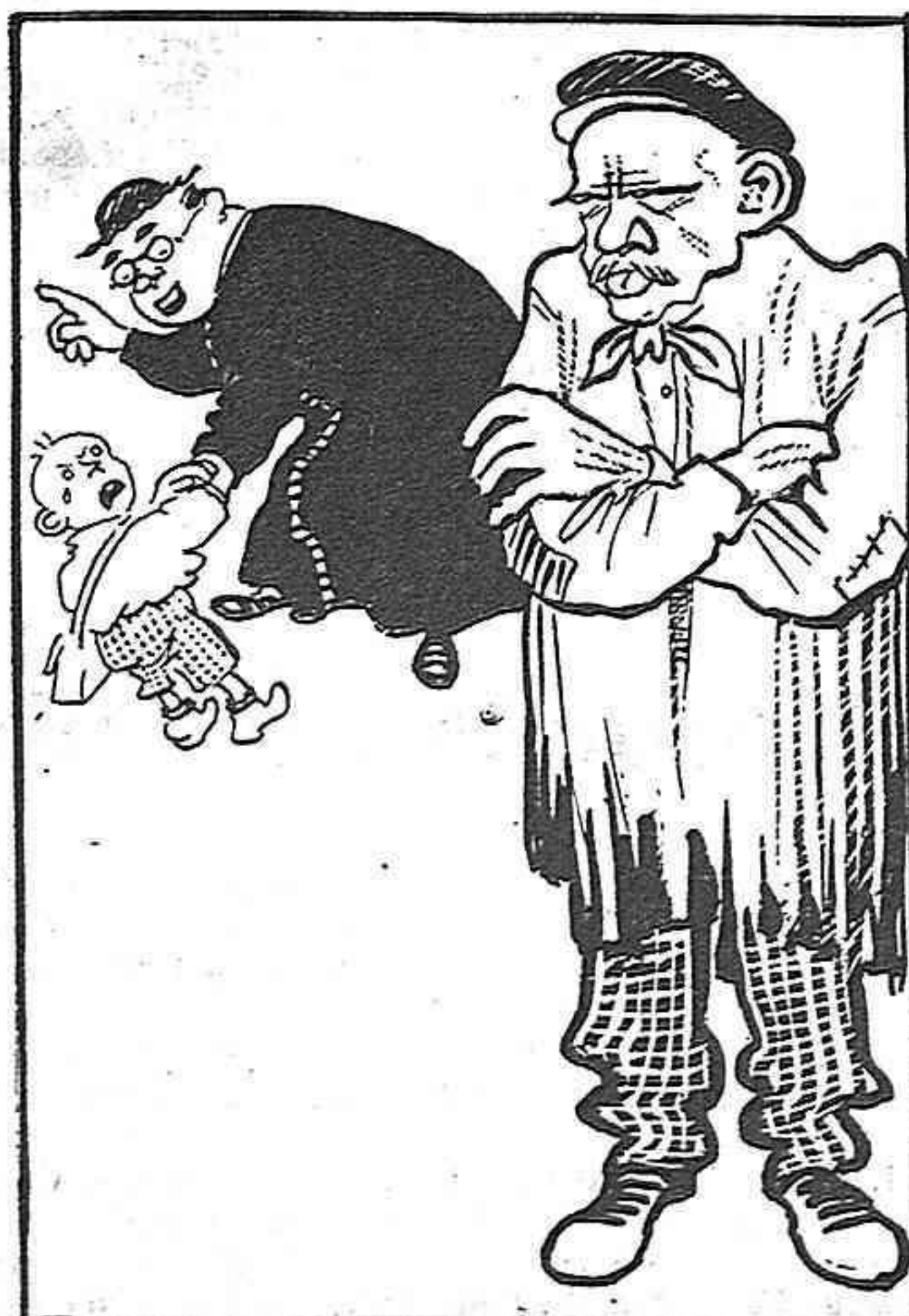
El dijous la teocracia s'apodera de la consciencia del seu fill.