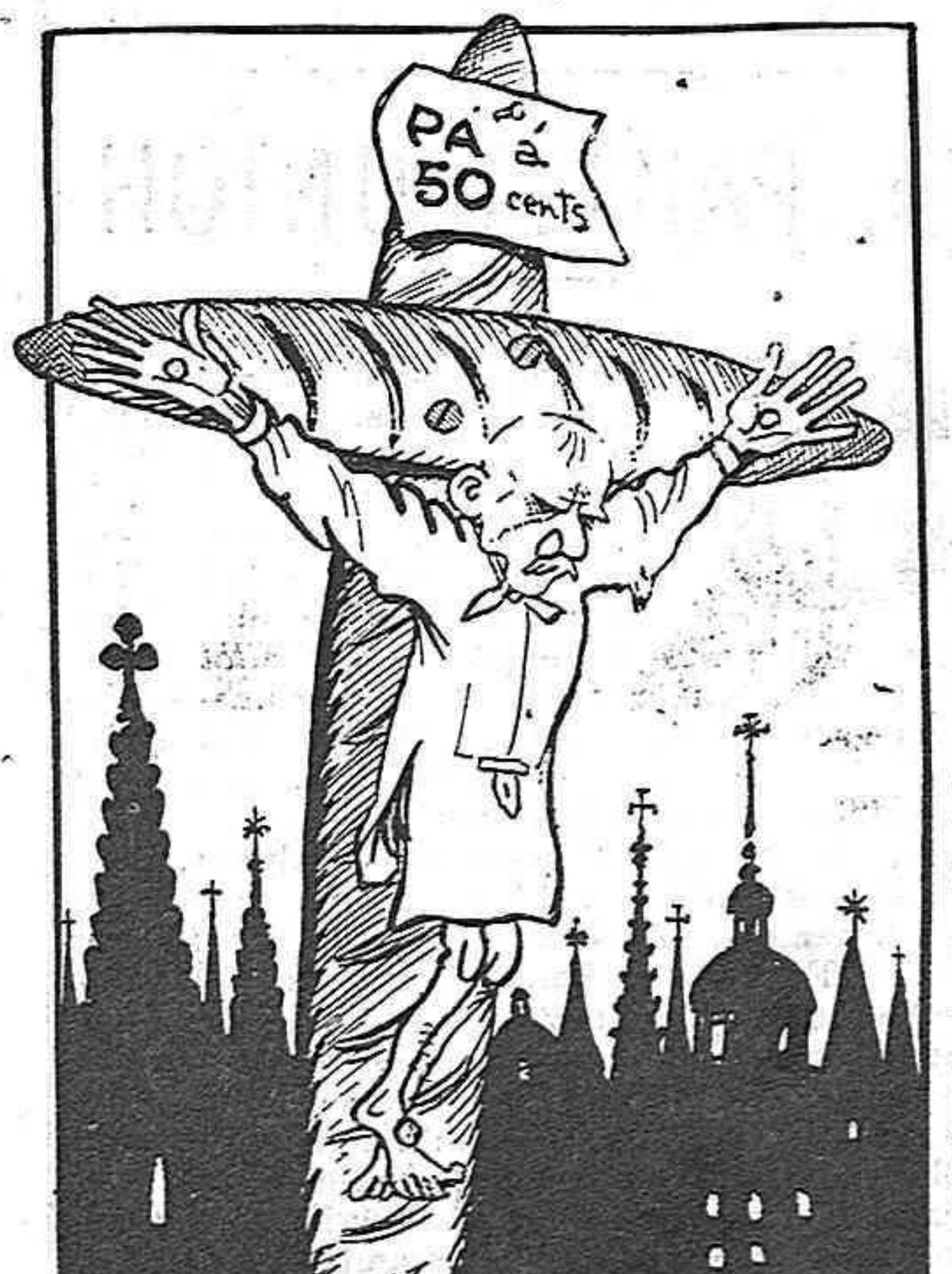
Y el diumenge exhala la darrera alenada, ignominiosament clavat en creu.