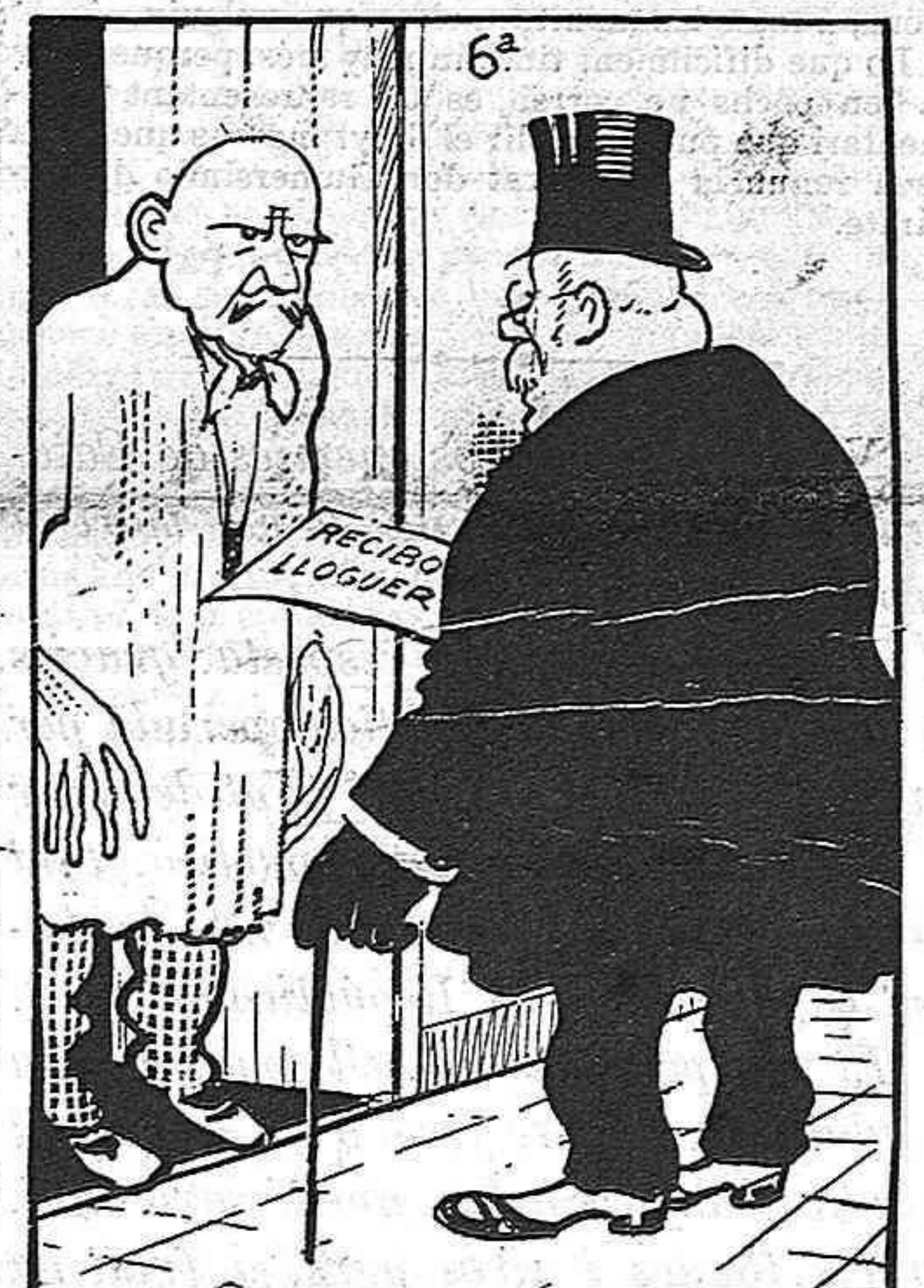
El dimecres van á cobrarli el lloguer.