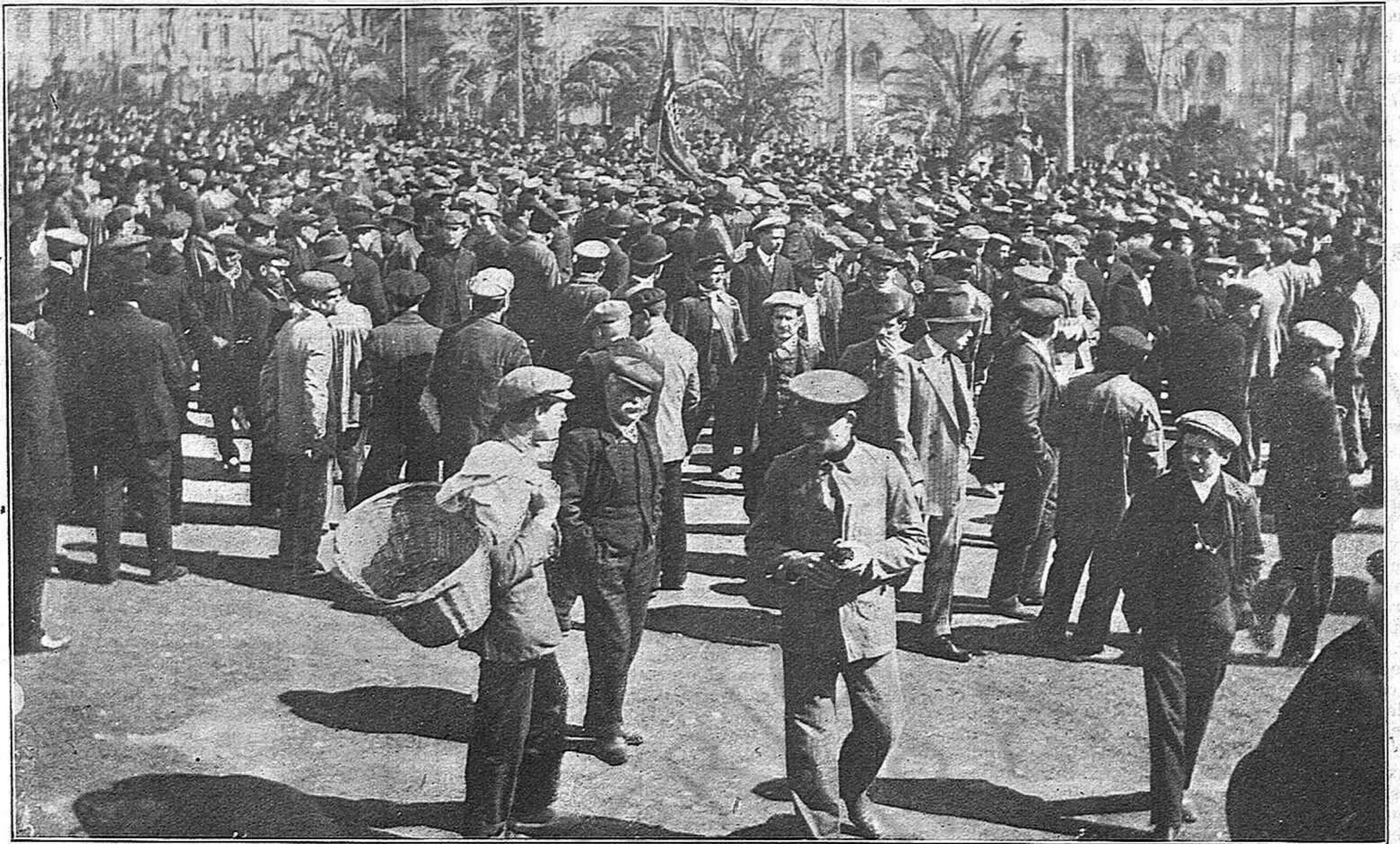
La manifestació, a la plassa de Catalunya, moments avans de posarse en marxa.

bres que rodavan pels carrers y tancantlos a munts dintre del Asilo Tovar.