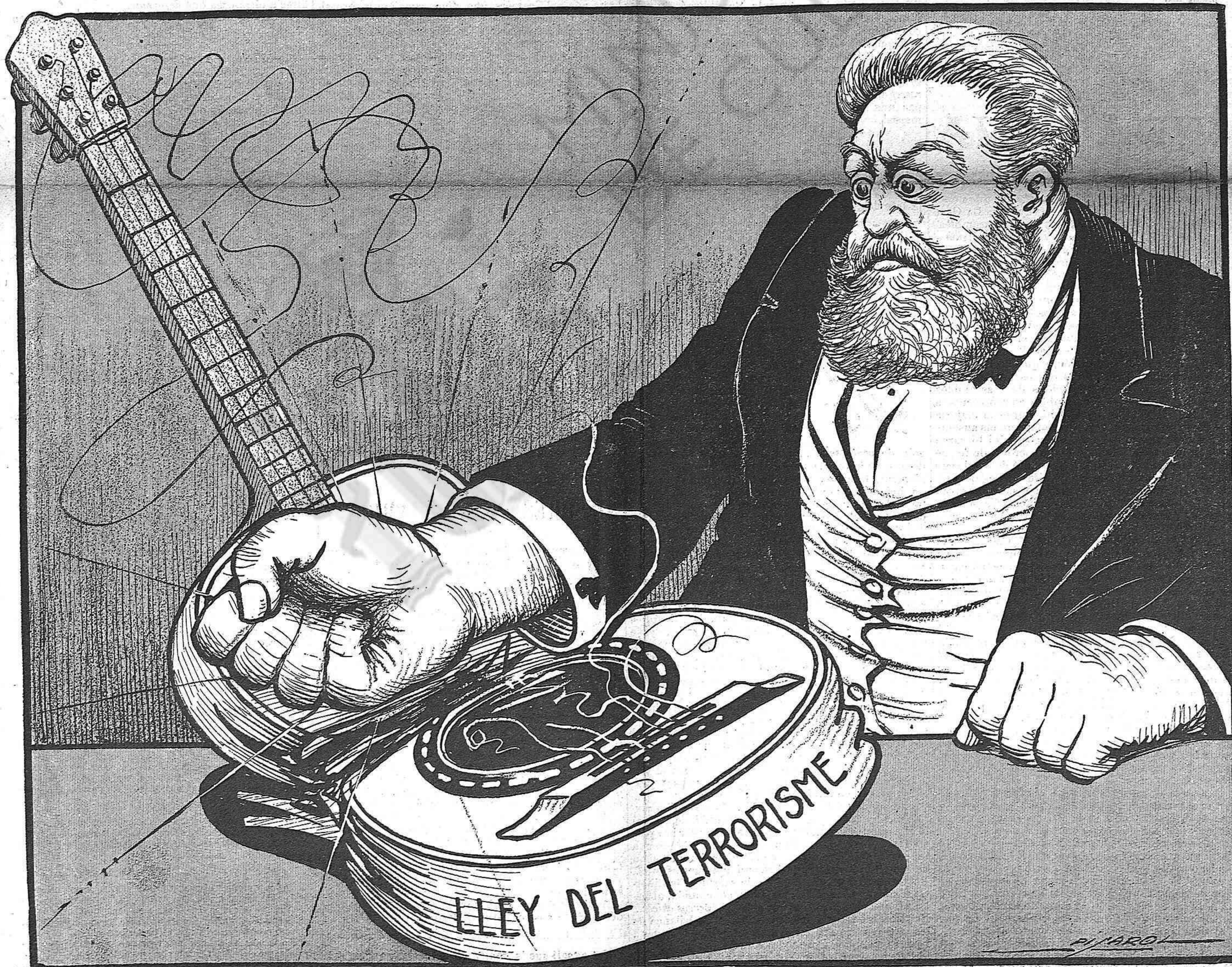
¡Els ha ben aixafat la guitarra!.....