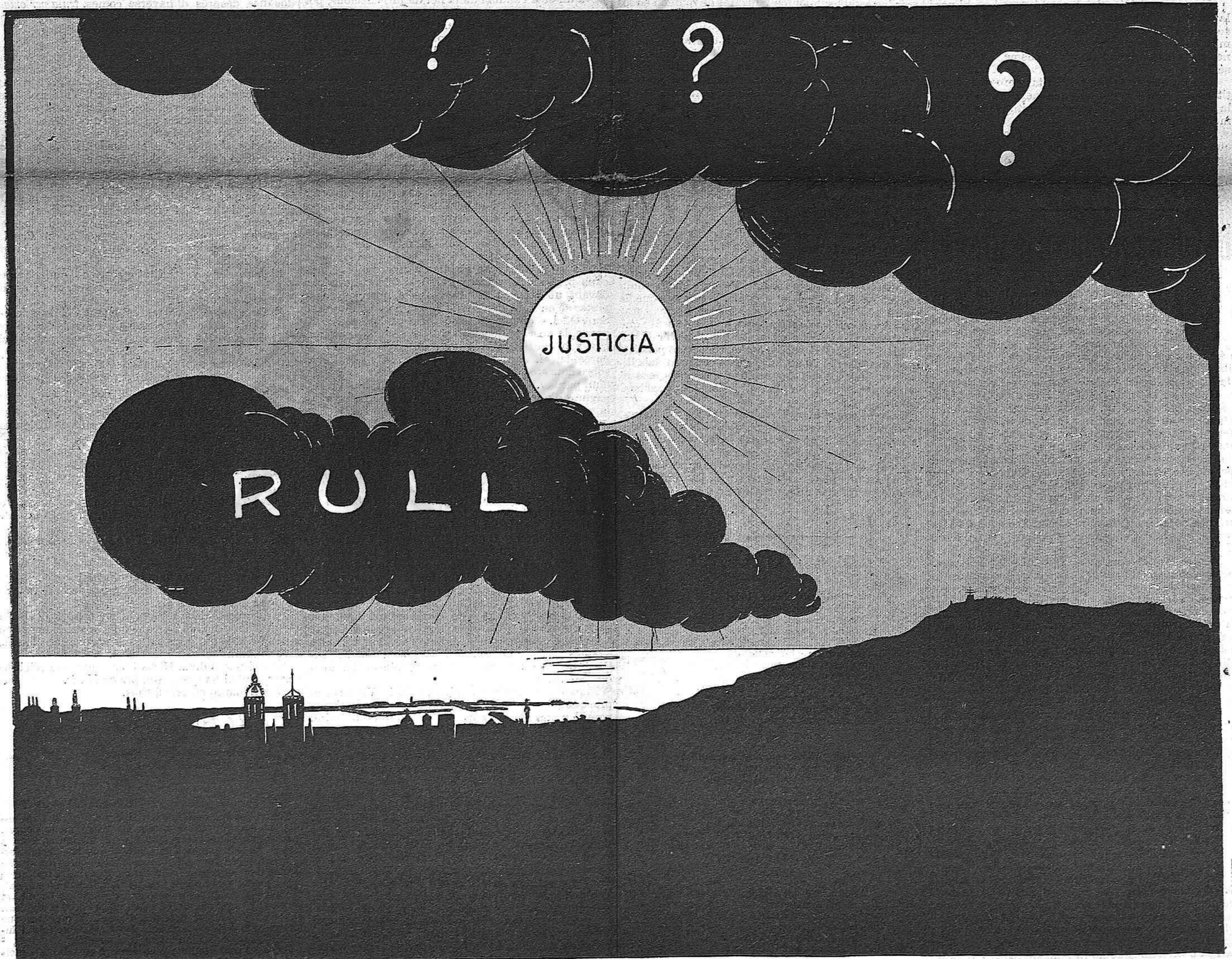
«El camí del Sol»