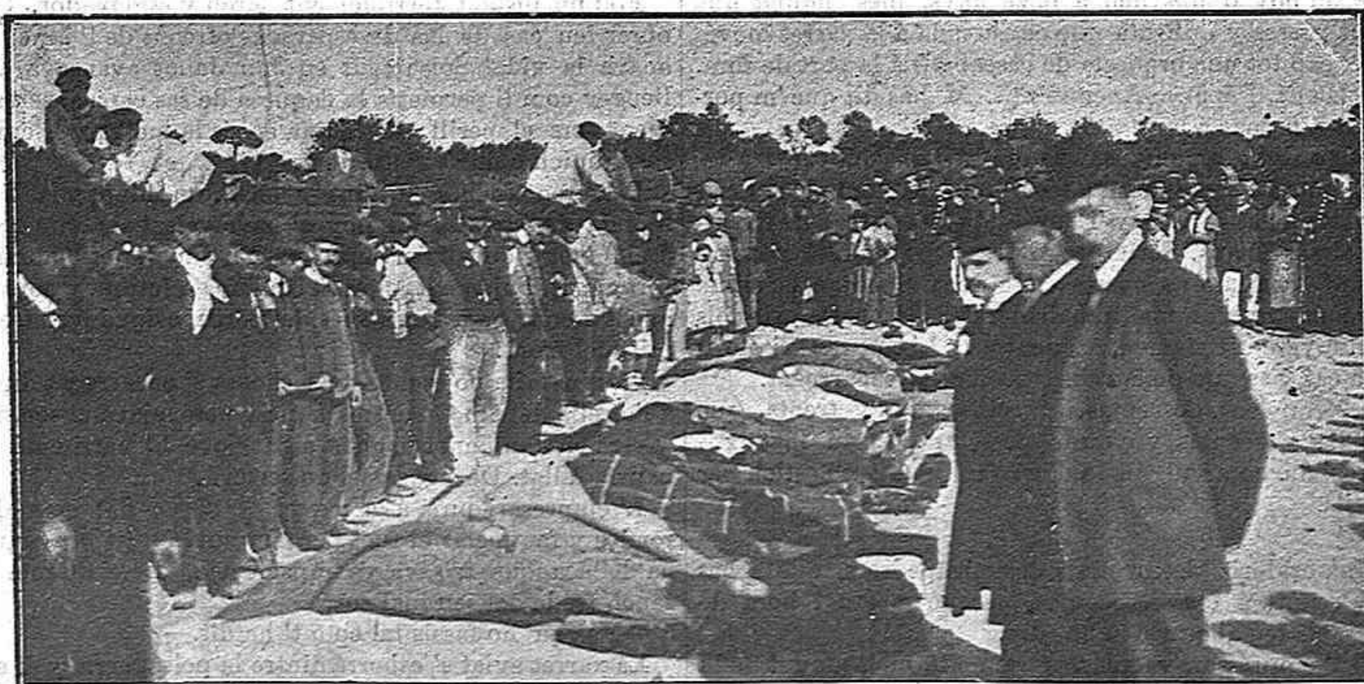
Els morts, amortallats ab draps y mantas destrossadas.