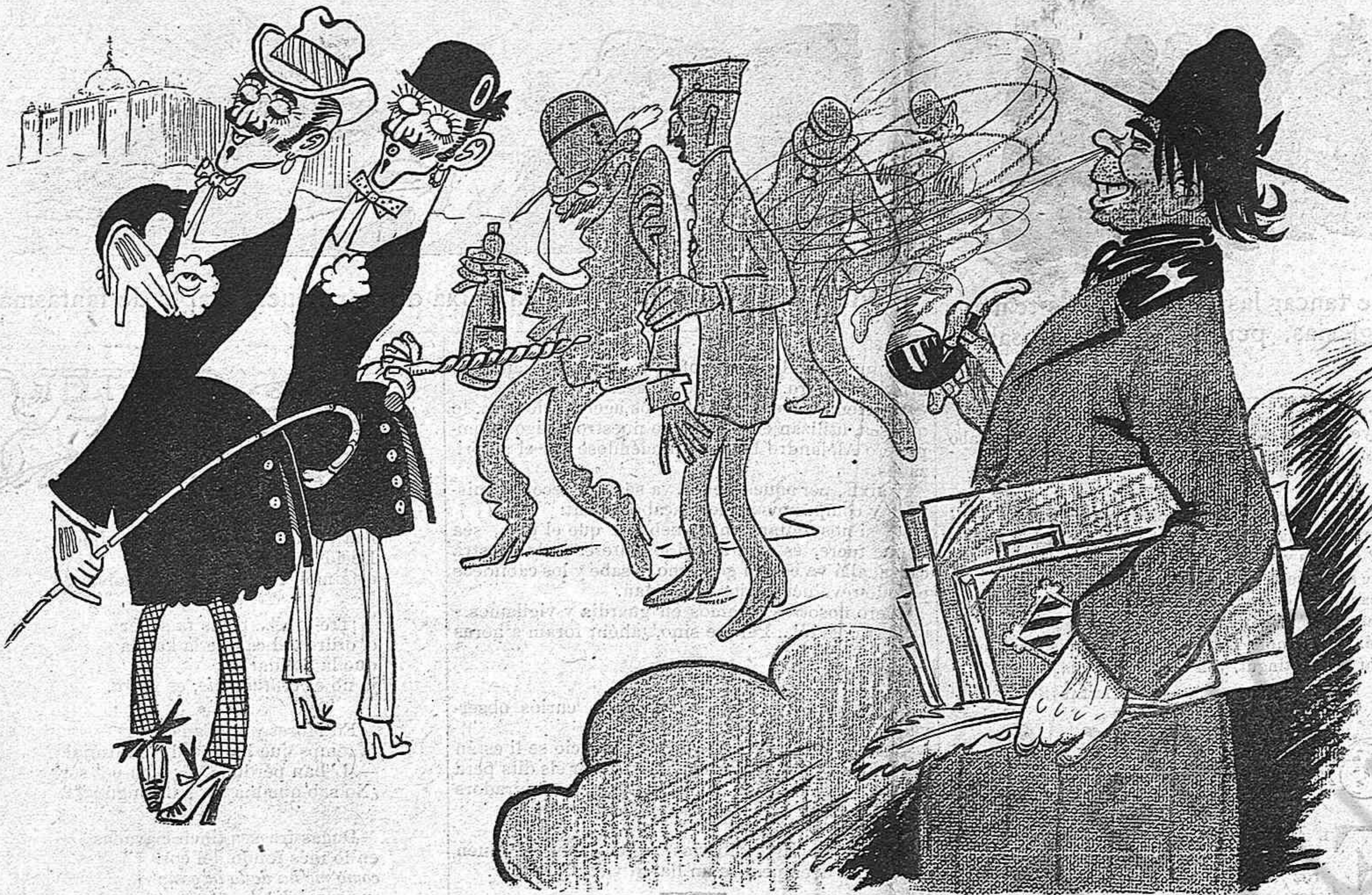
—Vaja, que per haver de ser intel·lectual á la moda madrilenya, val més deixar-se 'ls cabells llarchs y fumar ab pipa.