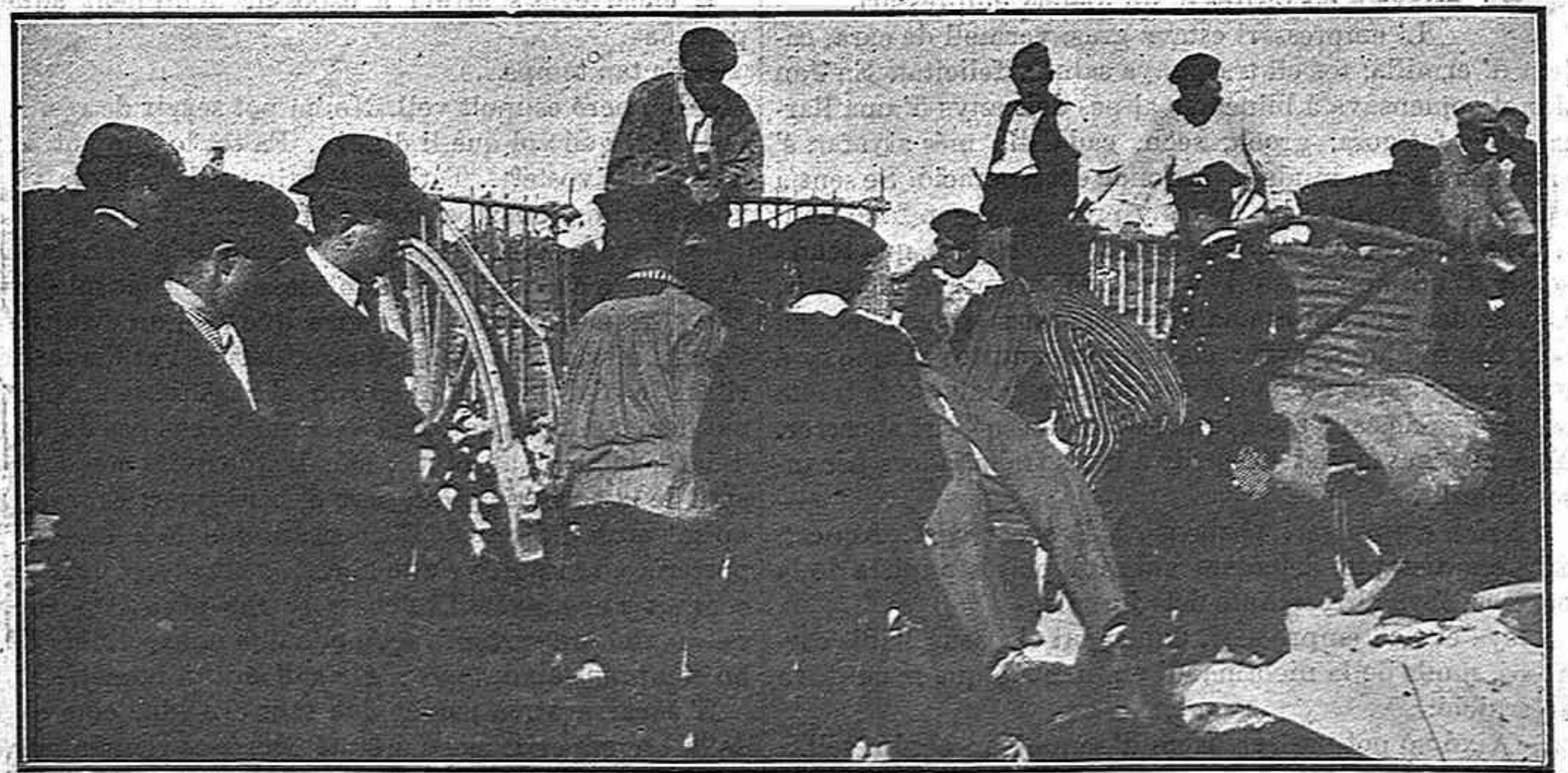
Complertas las formalitats judiciales, els morts son retirats del lloch de la catástrofe.