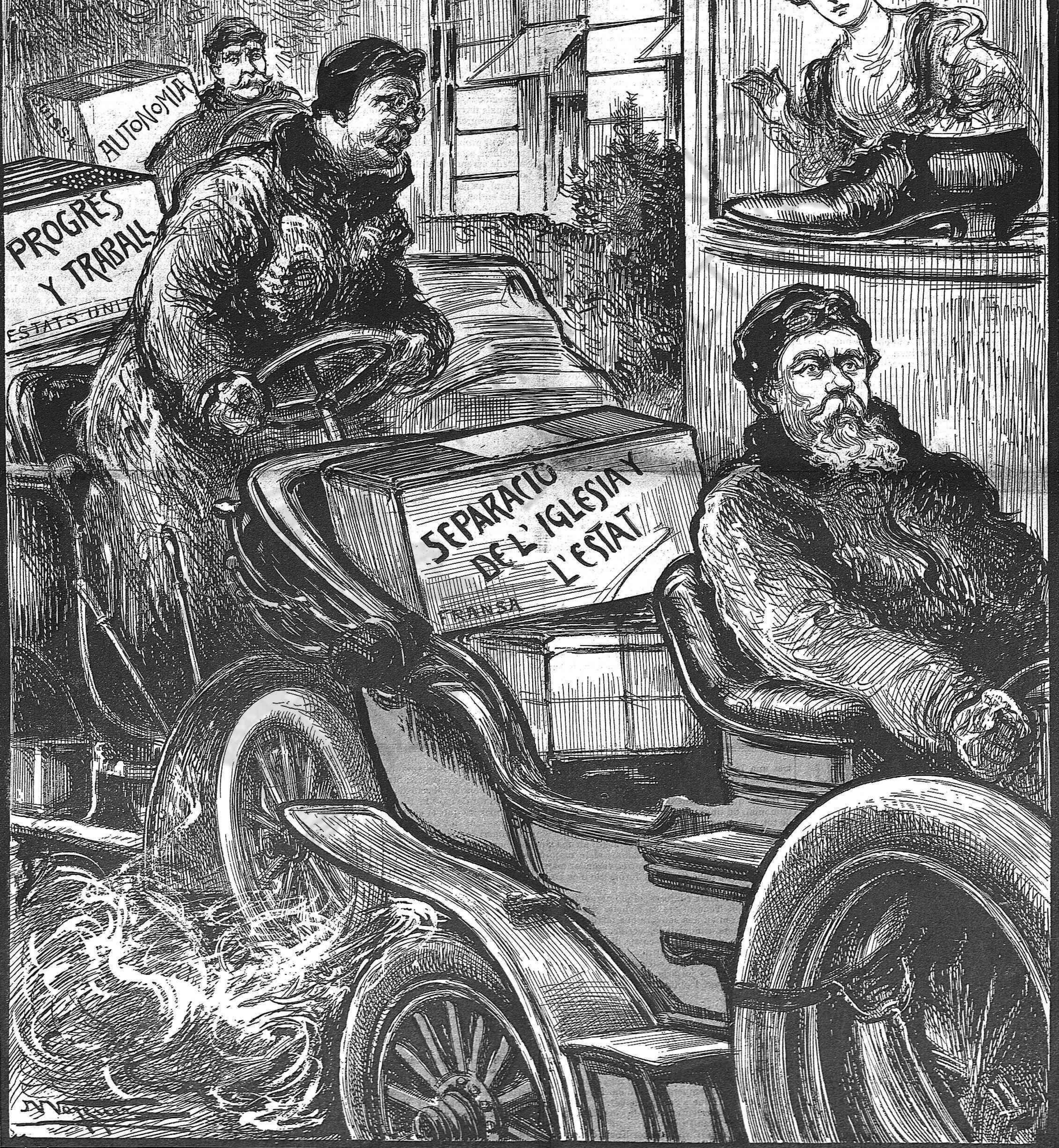
LA VINGUDA DELS TRES PRESIDENTS

¡Aquesta es la visita que voldríam que l' Espanya rebés!