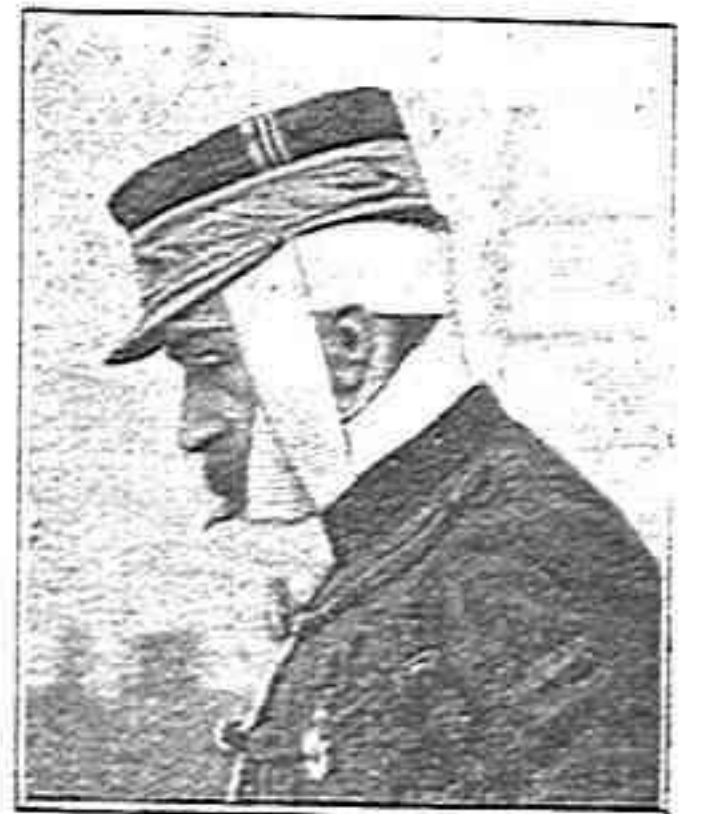
El Prefecte M. Poirson

El digne funcionari, á pesar de tot, no s'intimidá. Va anar ab un salt á ferse curar las feridas, y una volta arreglat el desperfecte, torná á la iglesia ab el cap envemat, y continuá tranquil·lament l'inventari.