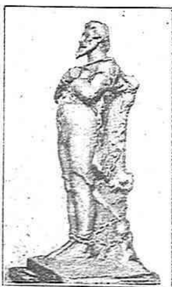
Estatua de Miquel Servet

Sérvet, el gran Miquel Servet, metge y filosof espanyol y una de las primeras ilustraciones de la época, rebrá ben prompte de Fransa, que en aquest cas assumeix la representació de tot el món civilisat, l'homenatge á que 's feu acreedor per son saber inmens y per la fermesa ab que sapigué sacrificarse en aras de sas conviccions.