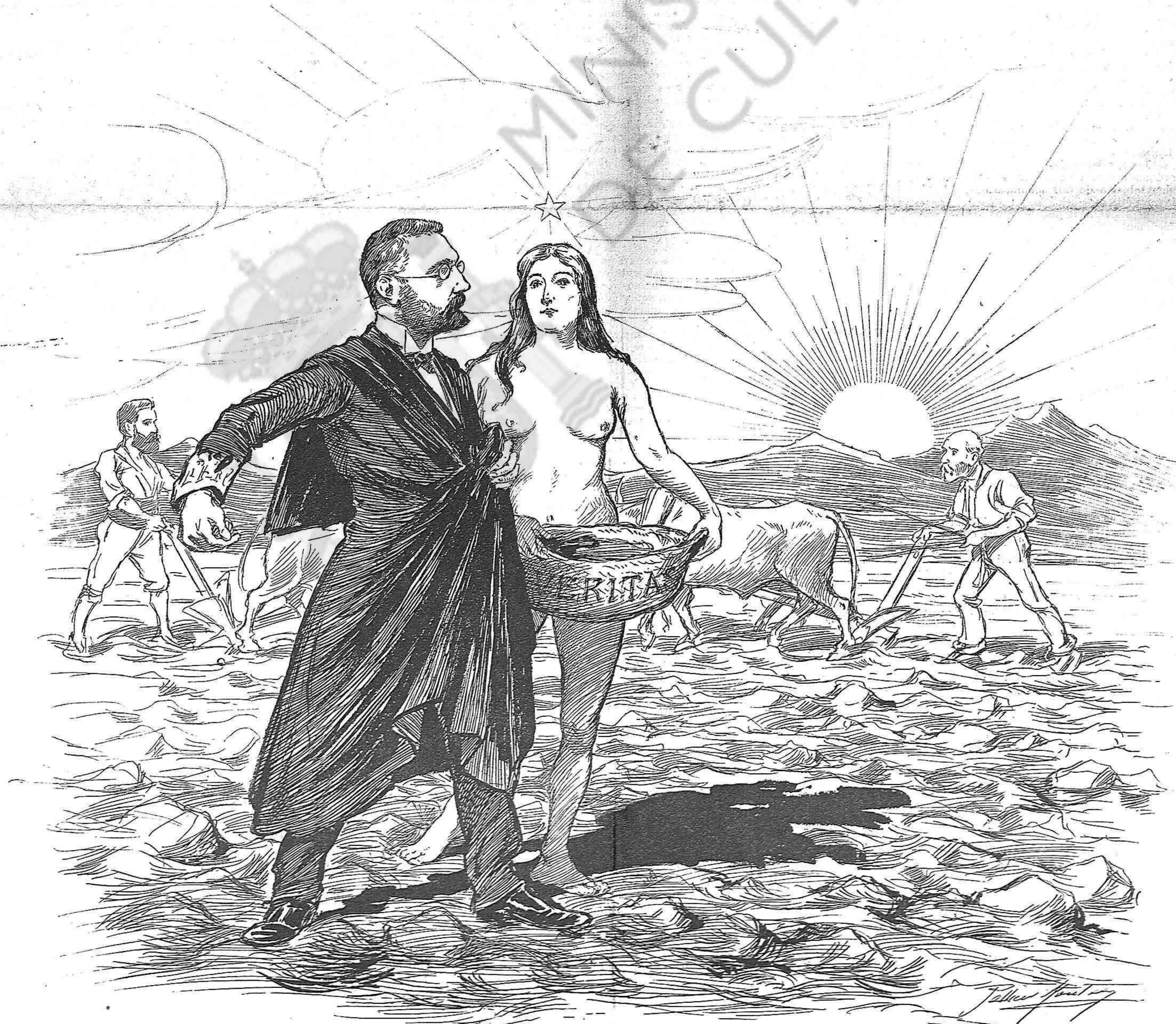
Sembri, sembri, don Miquel, que pera collir, s' ha de sembrar primer.