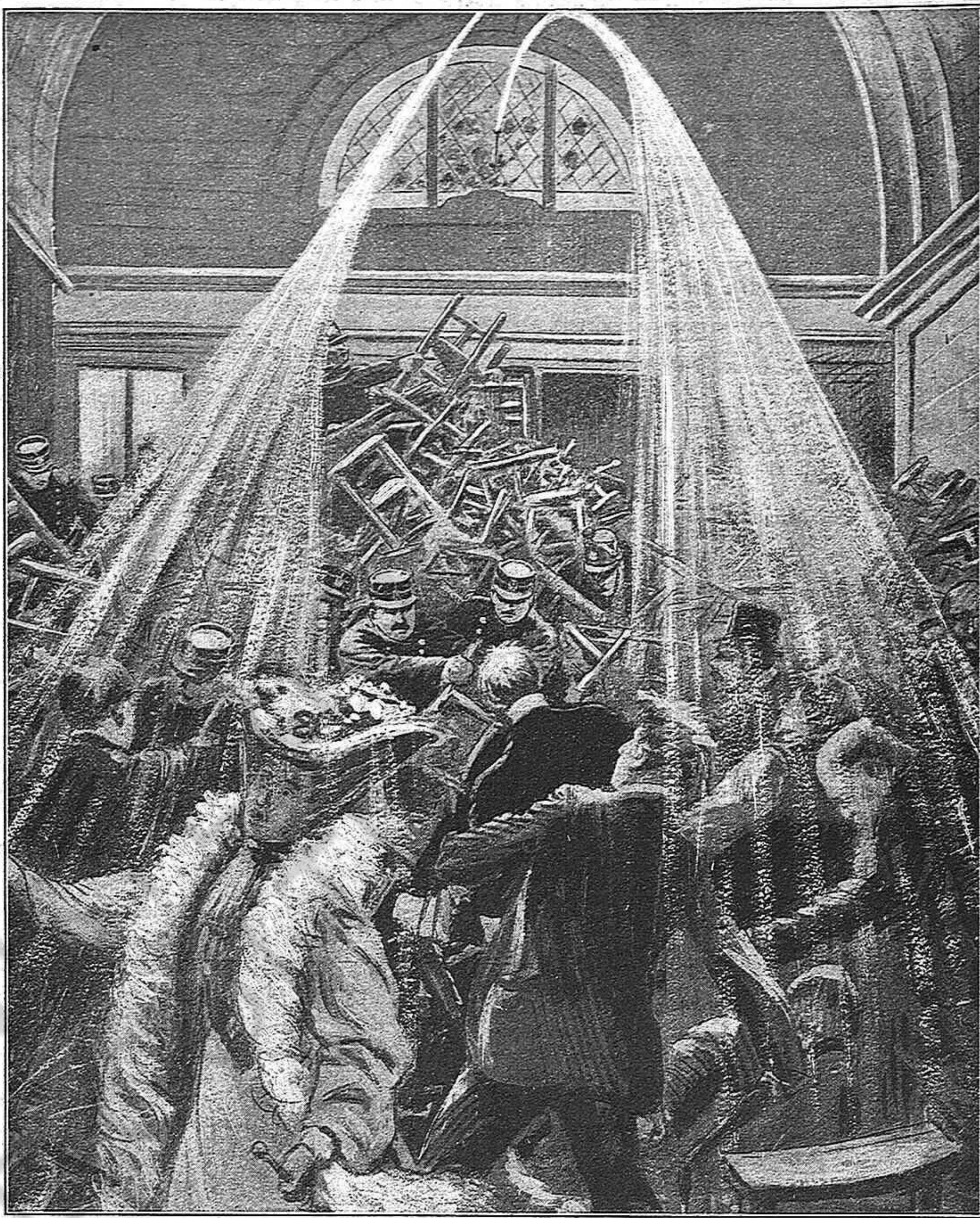
En vista de la resistencia dels fanátichs congregats en el temple, els bombers els dispersan refrescantlos ab copiosos xorros d' aygua.

ESCENA OCORREGUDA Á LA IGLESIA DE SAINT PIERRE-DU-GROS-CAILLOU, DE PARÍS, AL VERIFICARSE L' INVENTARI ORDENAT PER LA LLEY