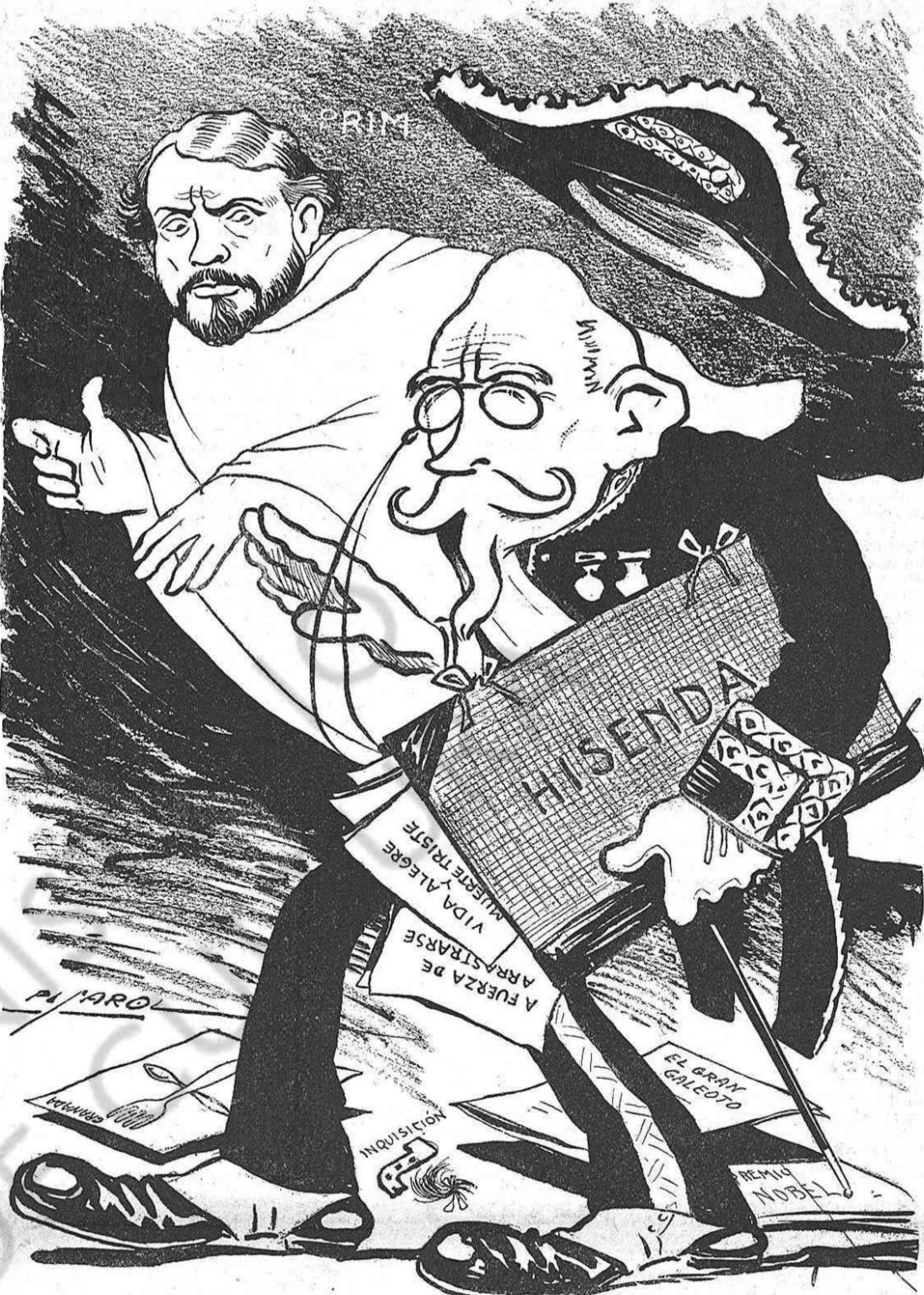
EN PRIM:—¡Don Joseph, don Joseph, vosté que va ser ministre ab mí, y ab en Ruiz Zorrilla y ab tots els homes de la Revolució de Setembre, tenir á última hora aquesta debilitat!... ECHEGARAY:—Noy, es alló que dich en un dels meus dramas: Vida alegre y muerte triste.