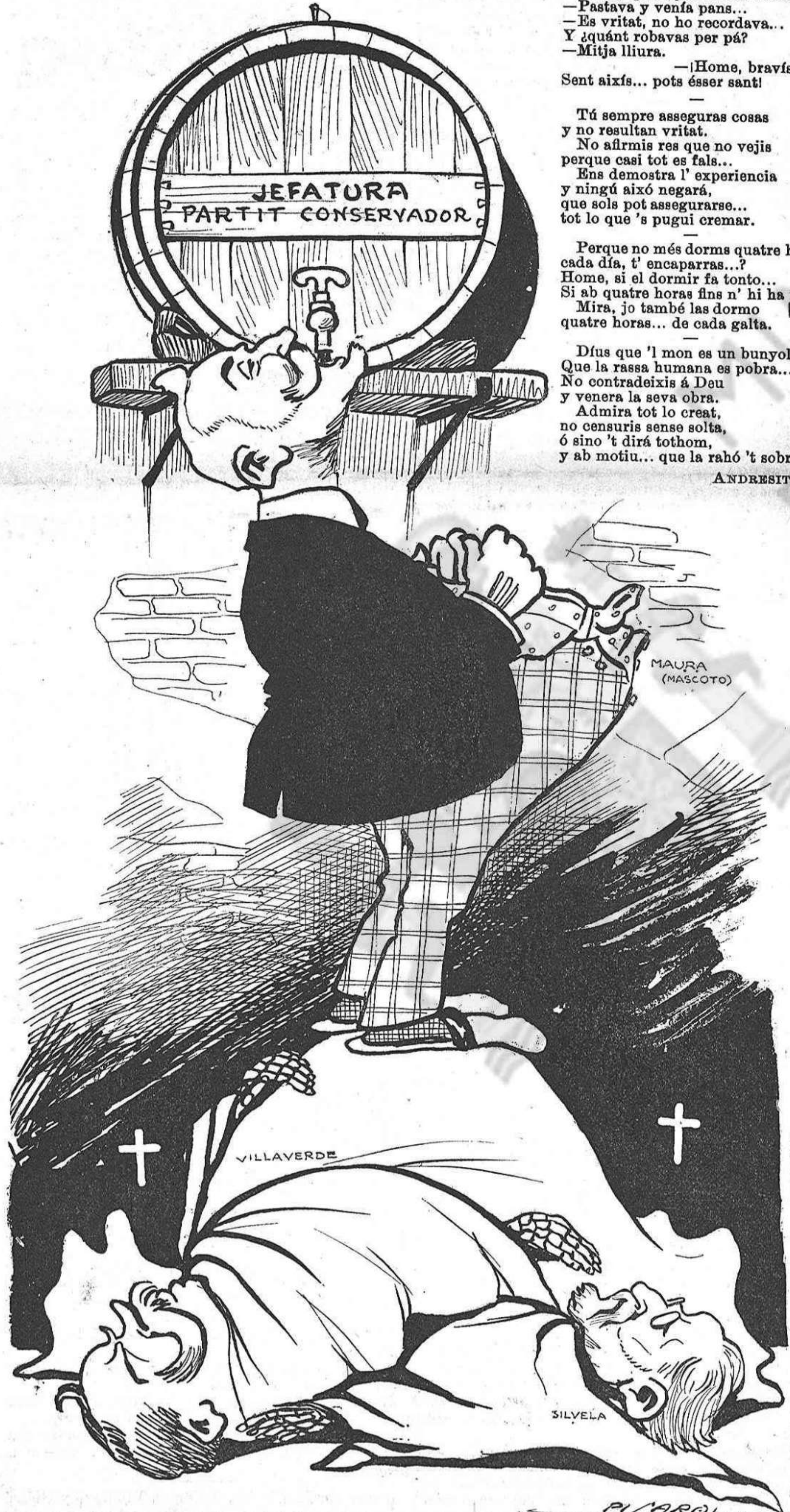
—D' aixó se 'n diu xiripal... Gracias á n' aquests dos morts, he pogut arribar á puesto.