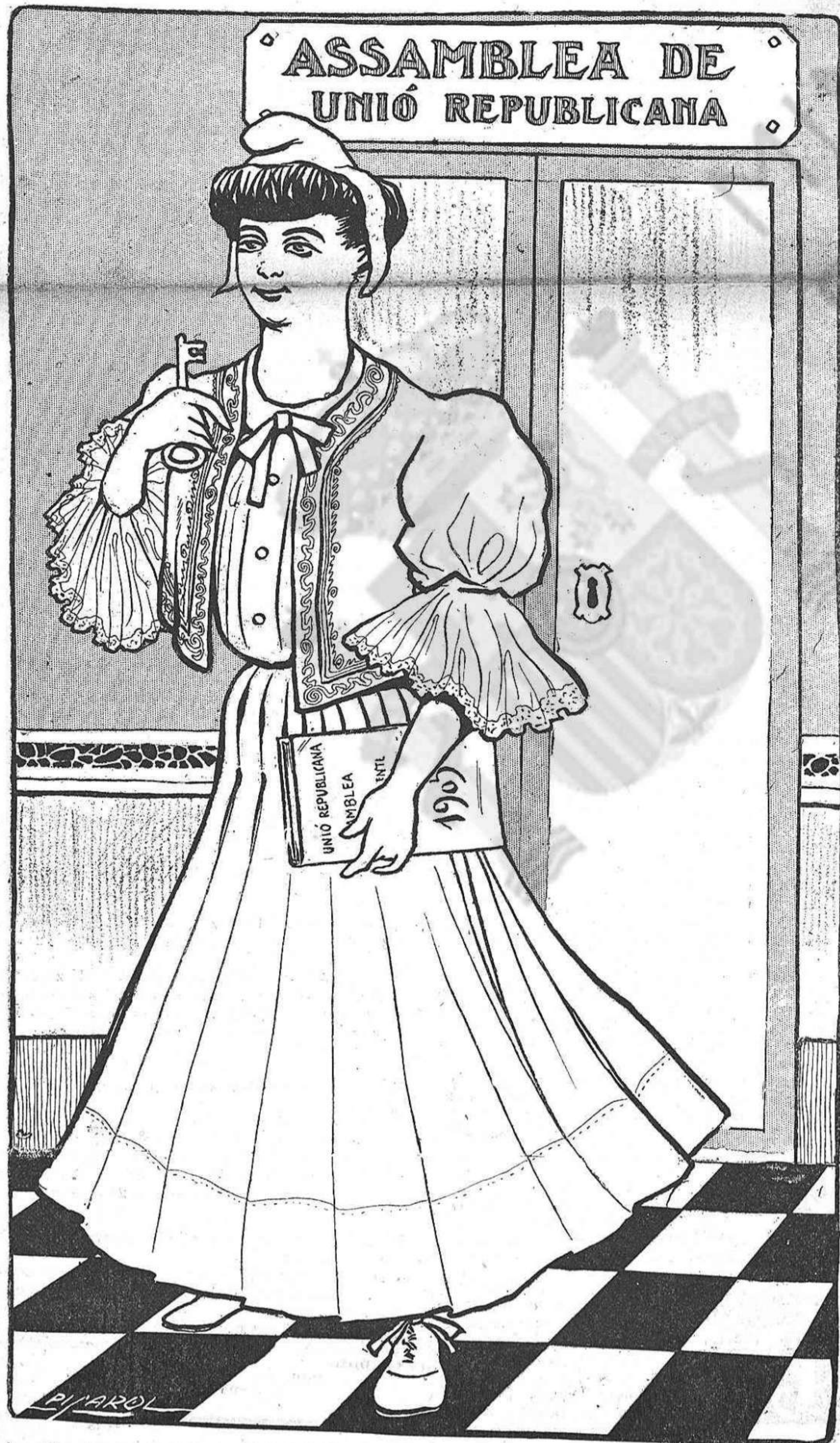
—Aquí m tenen vostés sortint de l' Assamblea, més sana, més àgil y més forta que may.