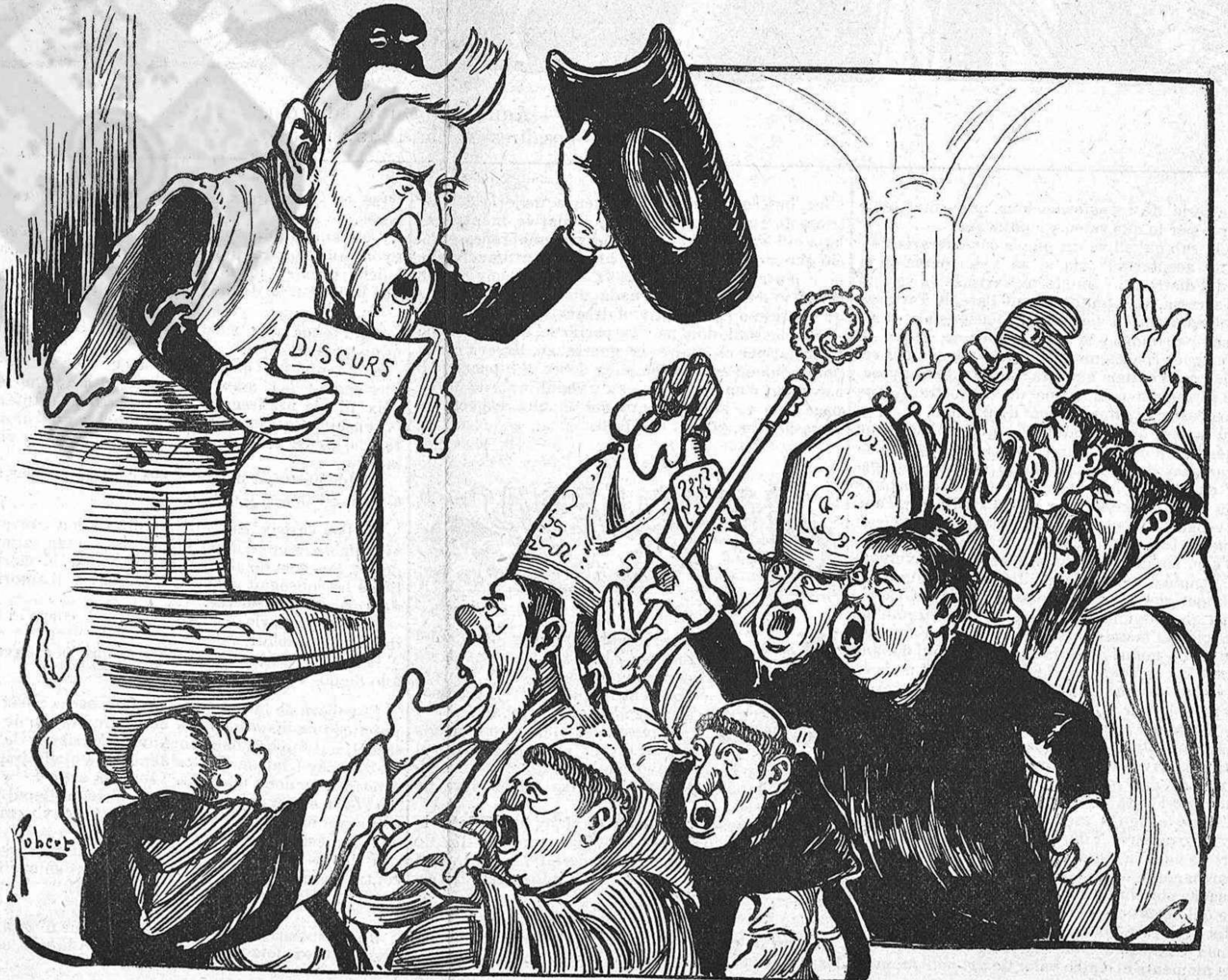
Jo soch democrata y católich intransigent....