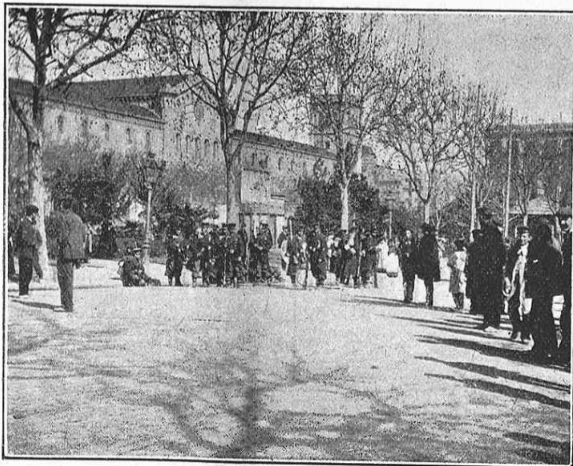
Cassadors d' Alba de Tormes, vigilant la plassa de l' Universitat.