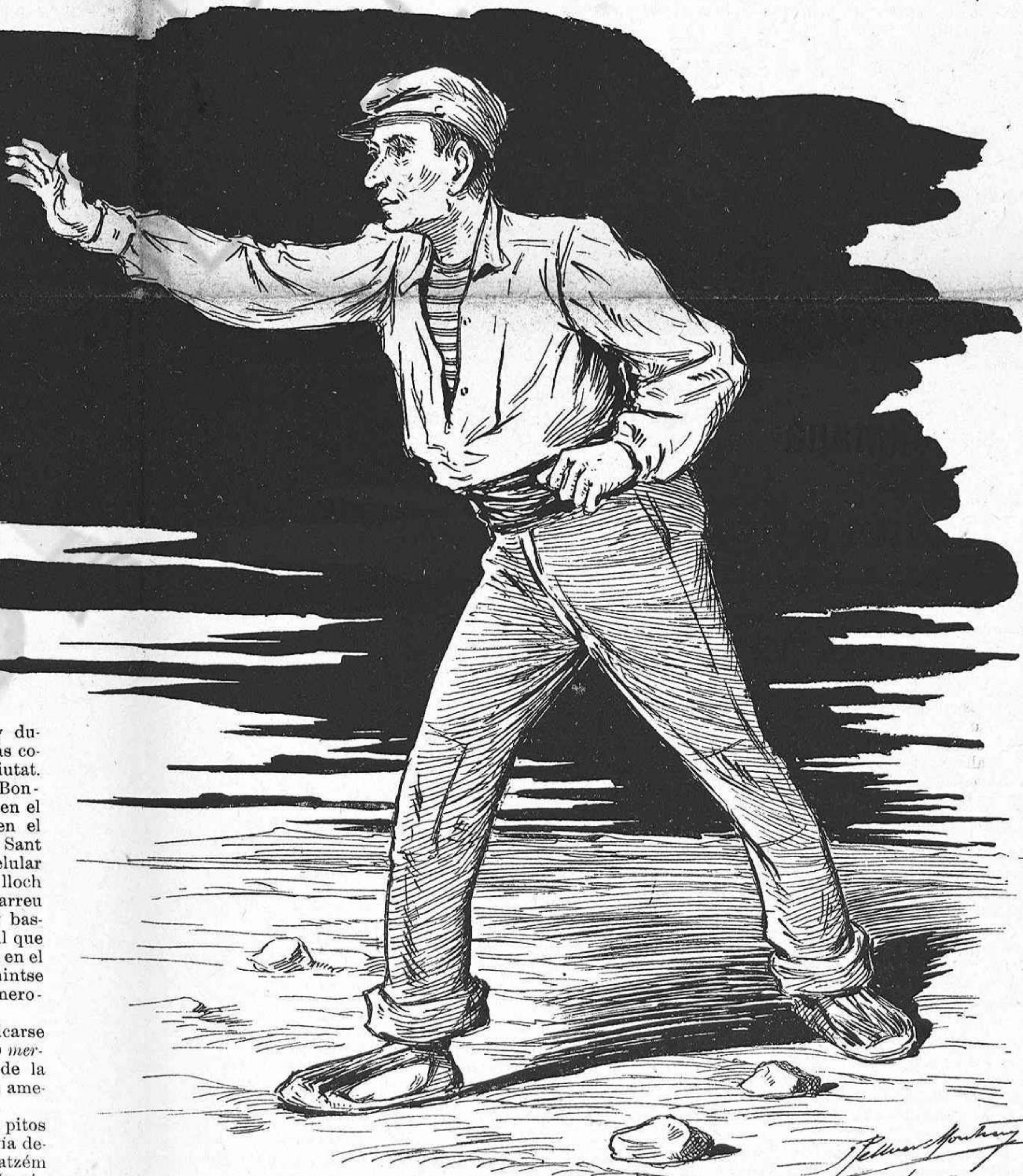
Quan la pedra ha sortit de la má, no se sab ahont vá.

Tots aquests successos contribuían á sembrar la intranquilitat y l' alarma per tota la població, y l' inquietut anava en augment ab las noticias que 's rebían de fora. A Badalona s' havian paralisat las fá-