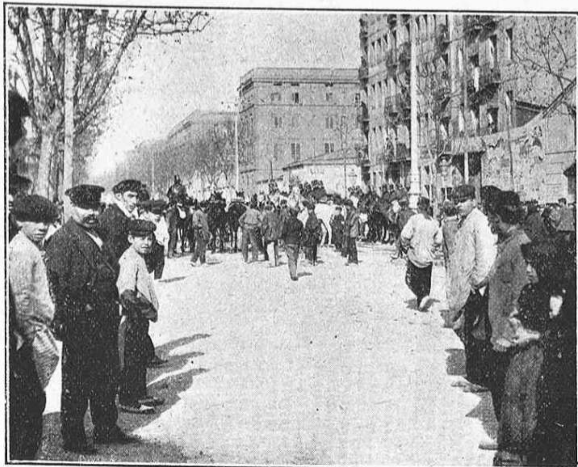
Un esquadro de Tetuán, davant de las cotxeras del tranvía eléctric.