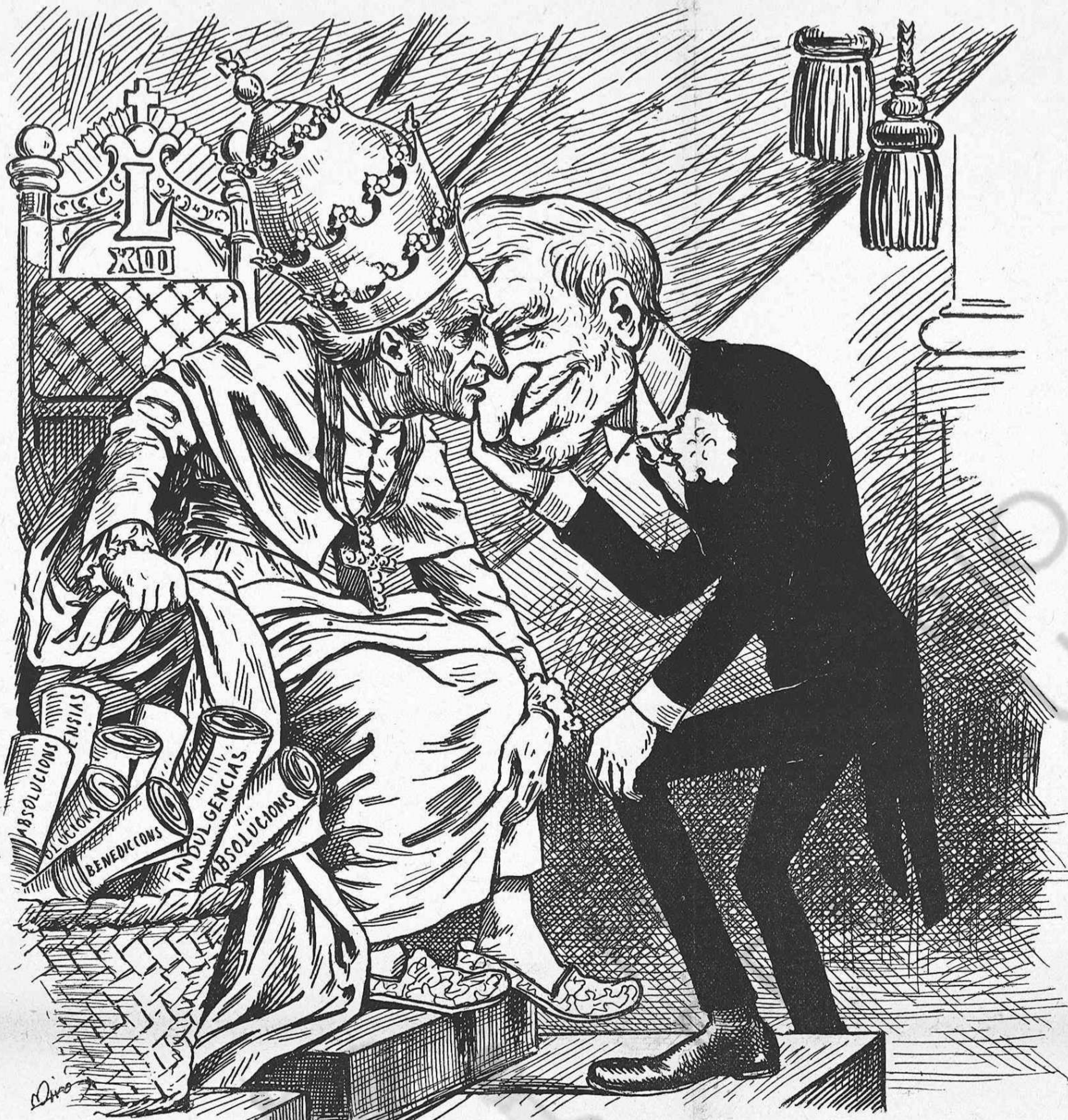
—Quina rebaixa li sembla que podem ferhi al pressupost del clero? —No hi sento d' aquesta orella.

—Ben net. Fent que 'ls marinos ballin menos y naveguin mes. —Es imprescindible que... —Vaya. —Y que... —Naturalment! —Y ademés volém que 'l ministre del nostre ram sigui de la facultat. —¿Y ara? Qué no ho es per ventura el Duch de Veragua? —Vosté dirá! —Oh! jo diré que sí. —Ell es almirant? —Sí, senyors; honorari. —Del mateix modo que 'l Dr. Thebussem, carter. —Ademés porta patillas. —També 'n portan els picadors. —¿Are que parla d' aixó! Y té ganadería. —¿Y qué té que veure el tenir ganadería ab las aptituds per desempeñar el ministeri de marina? —Res absolutament. Y per aixó invoco jo aquella qualitat. Ademés el Duch de Veragua sap nadar entre dos ayguas, y ¡fixintsil es Duch de ver agua. —Ah! —Y ha estat á América, per mar. —Oh! —Y tot li va vent en popa. —Donchs á pesar de tantas qualitats, no 'ns convens, Sr. Sagasta. Volém un ministre de marina que sigui marino. —Perden el temps ab una pretensió tant injusta. Per sobre las condicions enumeradas, té encare el Sr. Duch de Veragua la que basta ella sola pera tenir els mérits suficientes que necessita la cartera que desempeña. —¿Quina?