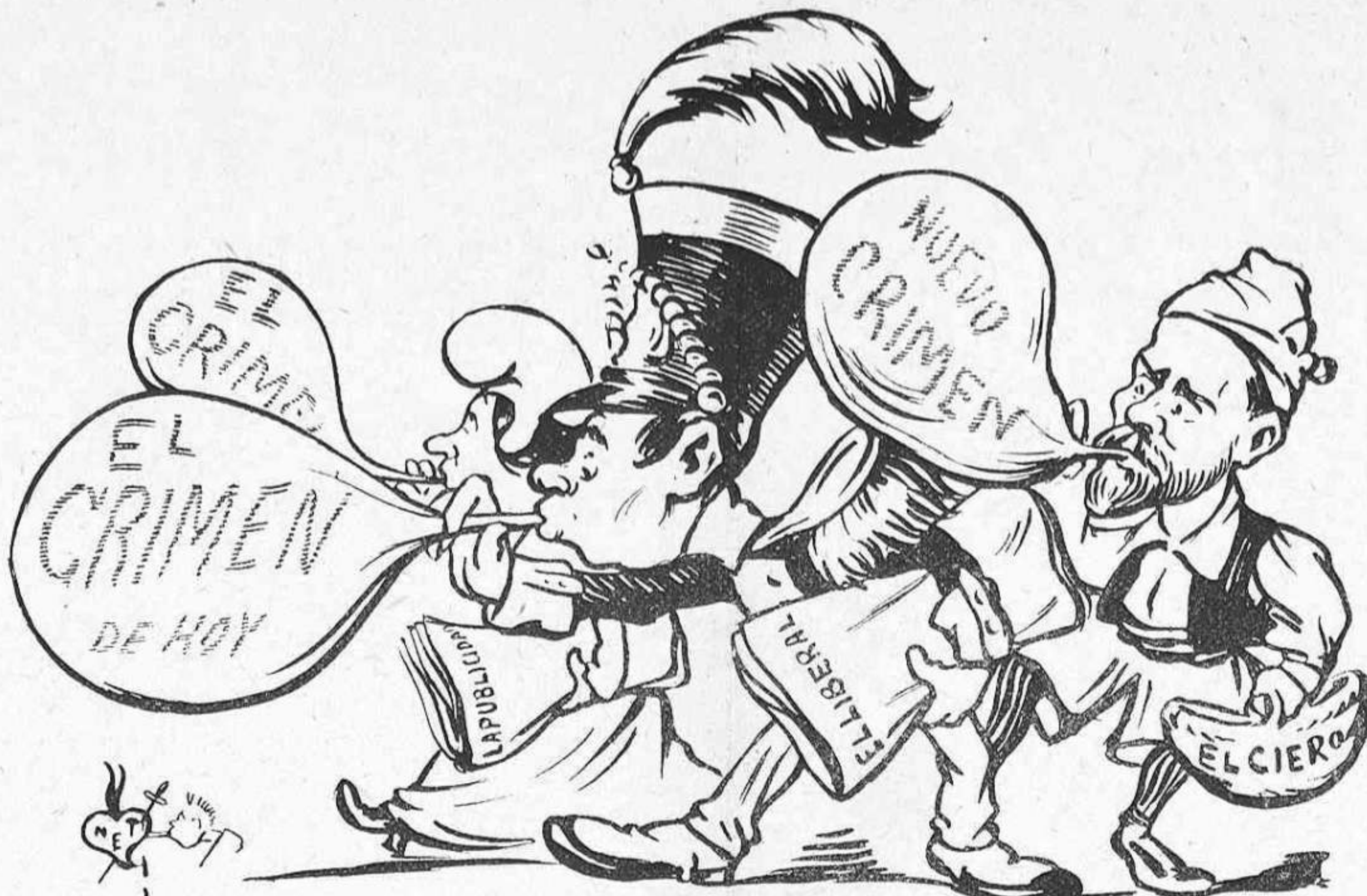
Inflant el crim del día.

sort y varen aumentar l' éxit de la Electra , fent sentir en tots els teatros ahont se representava l' cant de la Marsellesa, que semblava que le jour de gloire etait arrivé .