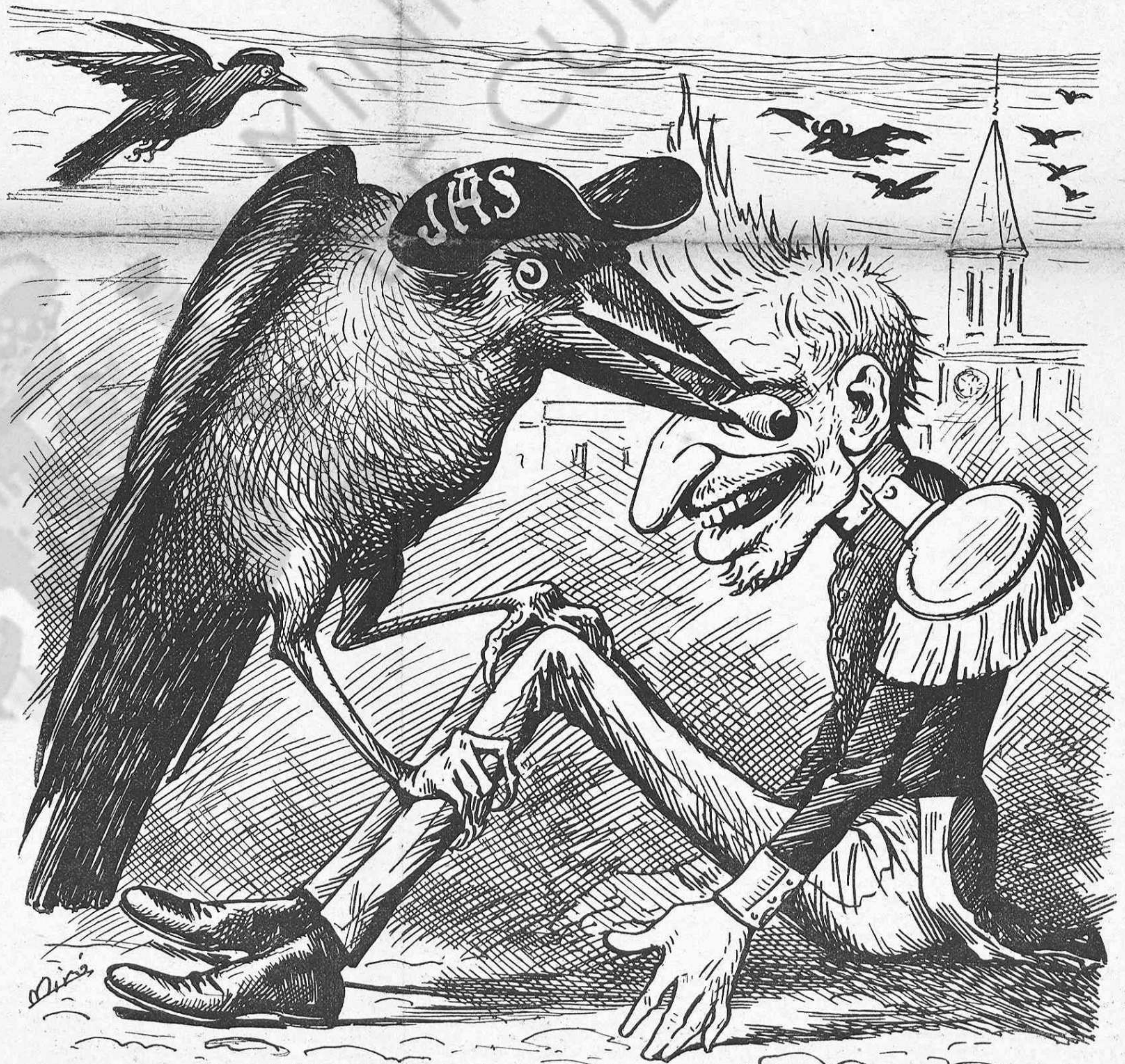
Per no haverlo aixelat a temps, aquest aucellot li traurá 'ls ulls.