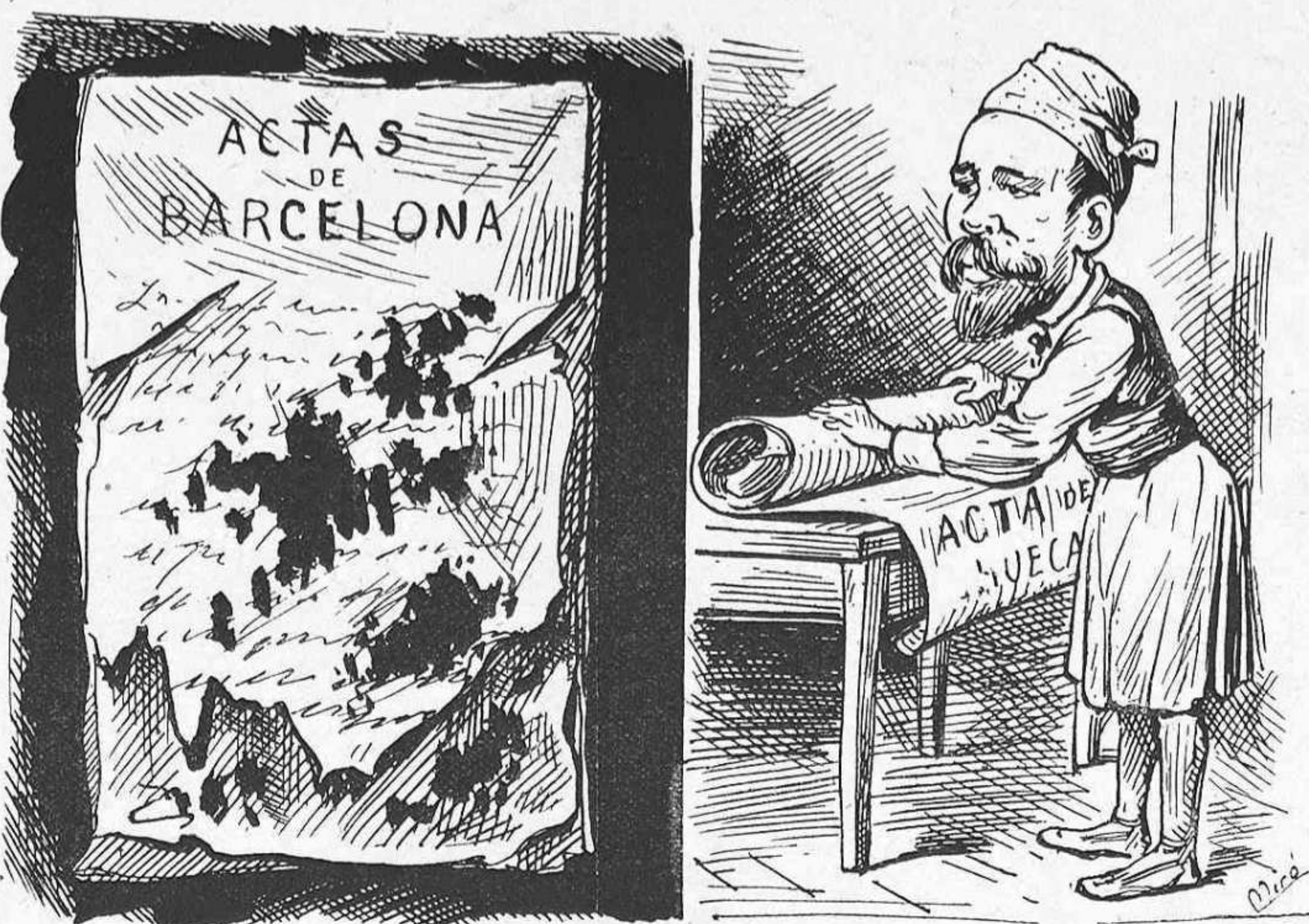
Aprobada la de Sueca, qu'era la mes bruta, las altres poden esperarse... Y ademés primer es El Noticiero que Barcelona.

clases conservadoras, com se veurá llegint els conceptes que dedica a justificarlo.