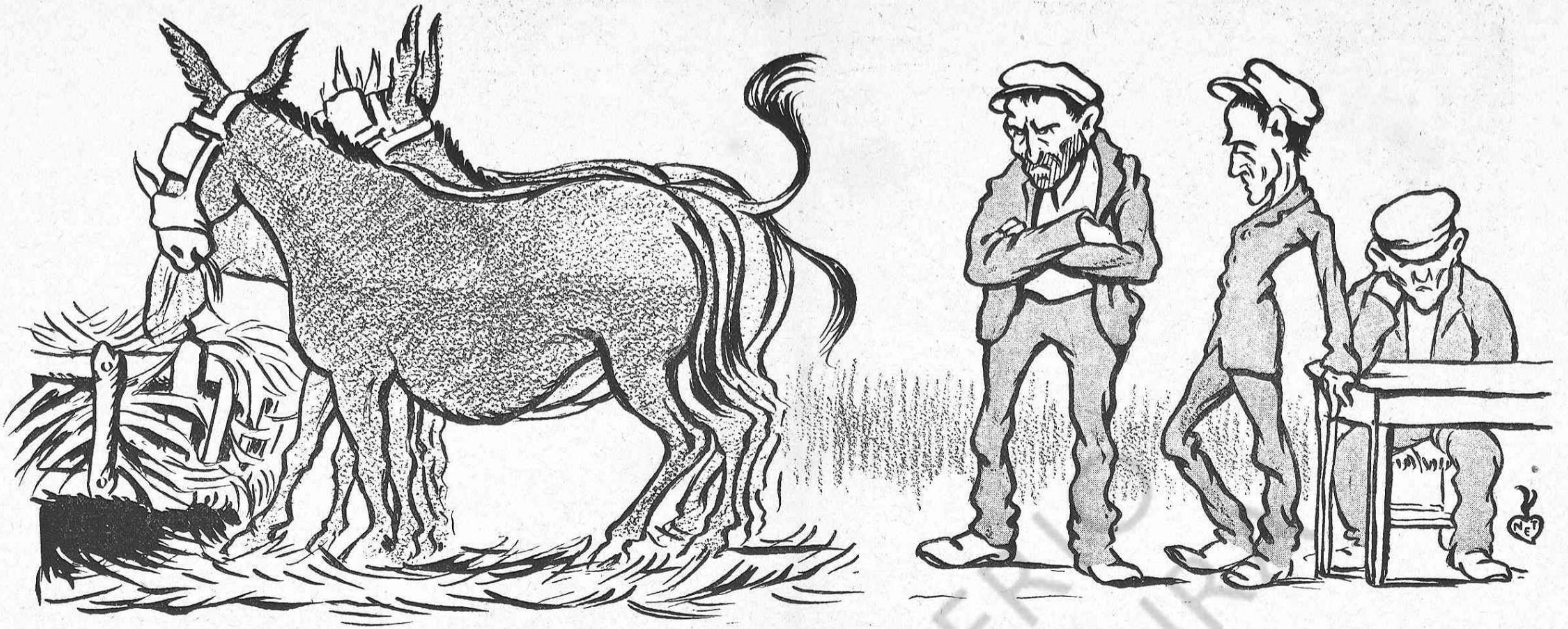
Las mateixas causas produheixen distints efectes.

«He pedido y logrado que se encasille á algunos de los míos.» Aixís textualment sense ferhi embuts. Per aixó ha estat tan temps callant el pollastre de Antequera. Perque, massa que ho diu l' adagi de la seva terra: