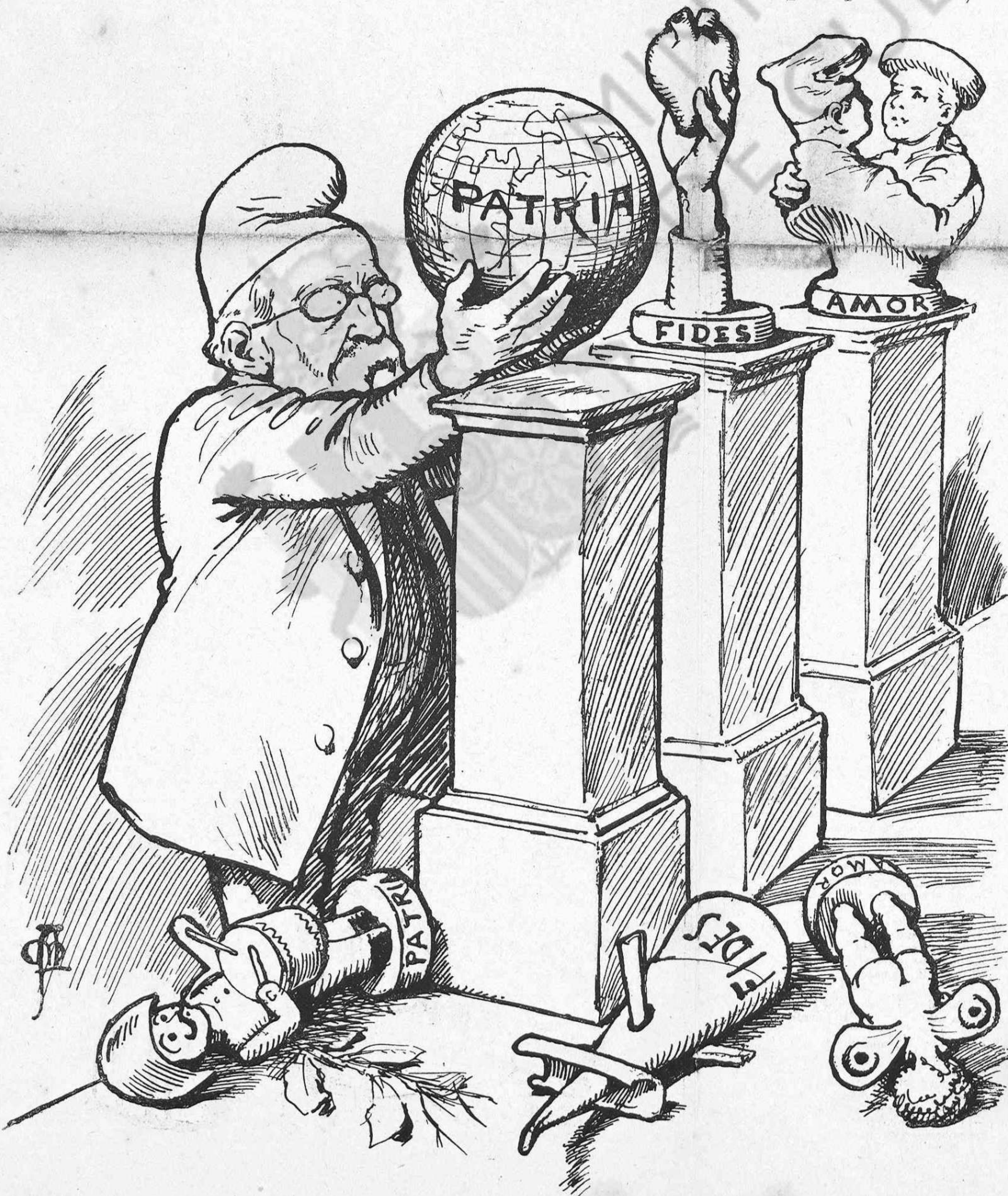
—Aquí 'us deixo aquests símbols nous de trinca, en substitució dels que teníau, que per infantils y mansos no anavan en lloch.