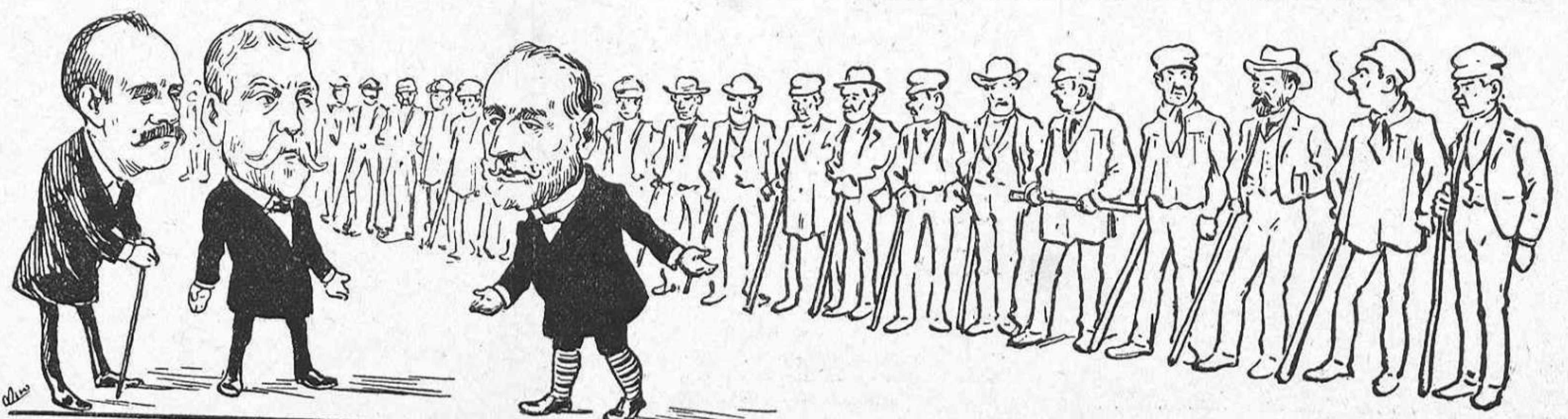
Els cacichs barcelonins, fraternalment aliats, passen revista á las forsas ab las quals se proponen guanyar la próxima batalla.