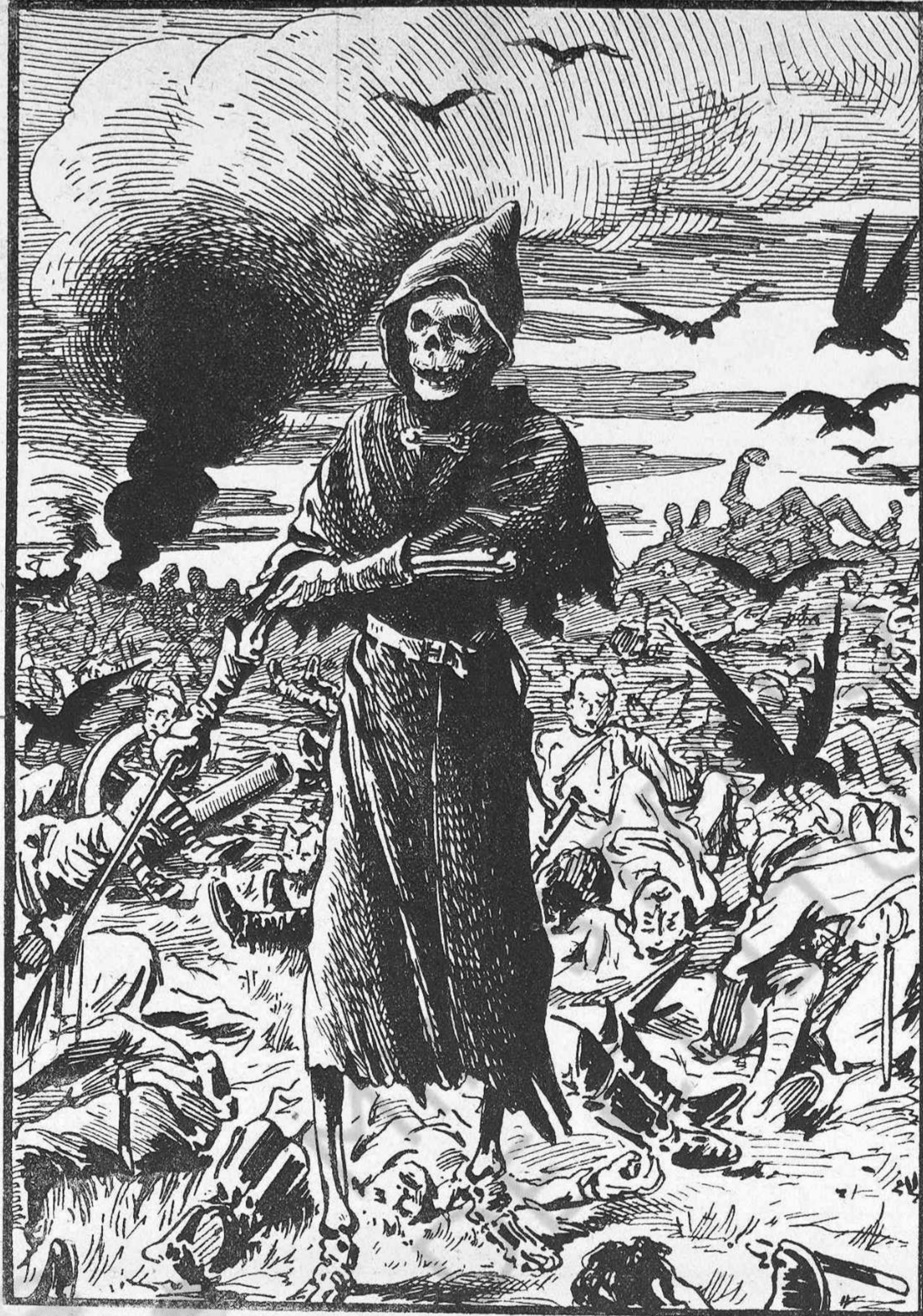
¿QUAN ACABARÀ LA MATANSA?—La guerra del Transvaal, comensada l'endemà del Congrés de la Pau, ha produït fins ara més de 60,000 víctimes, sense contarhi donas ni noys, ruïnes ni desastres.