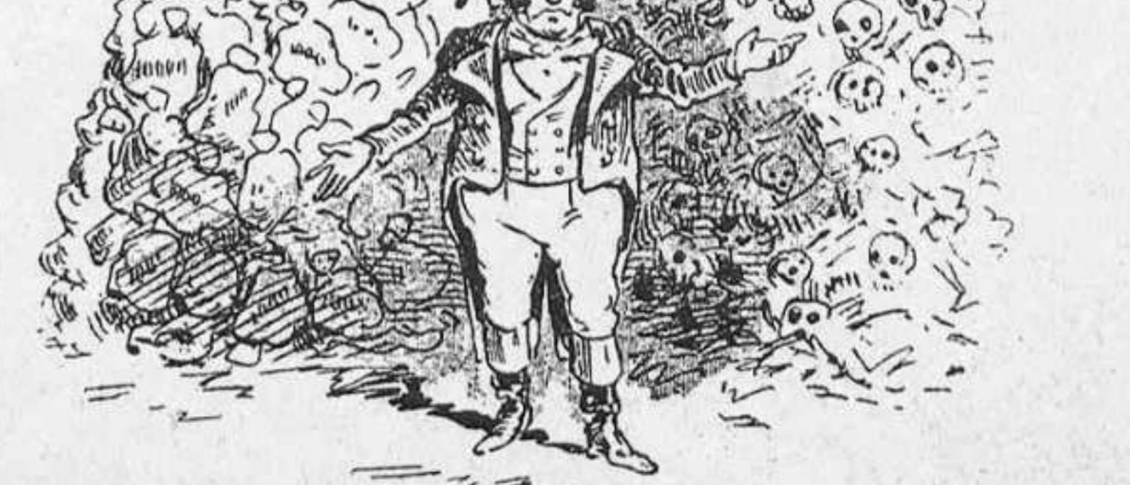
—¿La guerra del Transvaal? Aquí tengu lo que 'ns ha costat y lo que 'ns ha valgut... ¡Ey! sense contar 'l odi del mon enter.

Partits els dos difunts á la mateixa hora de la te- rra, van trobar-se pel camí y junts se dirigiren al cel.