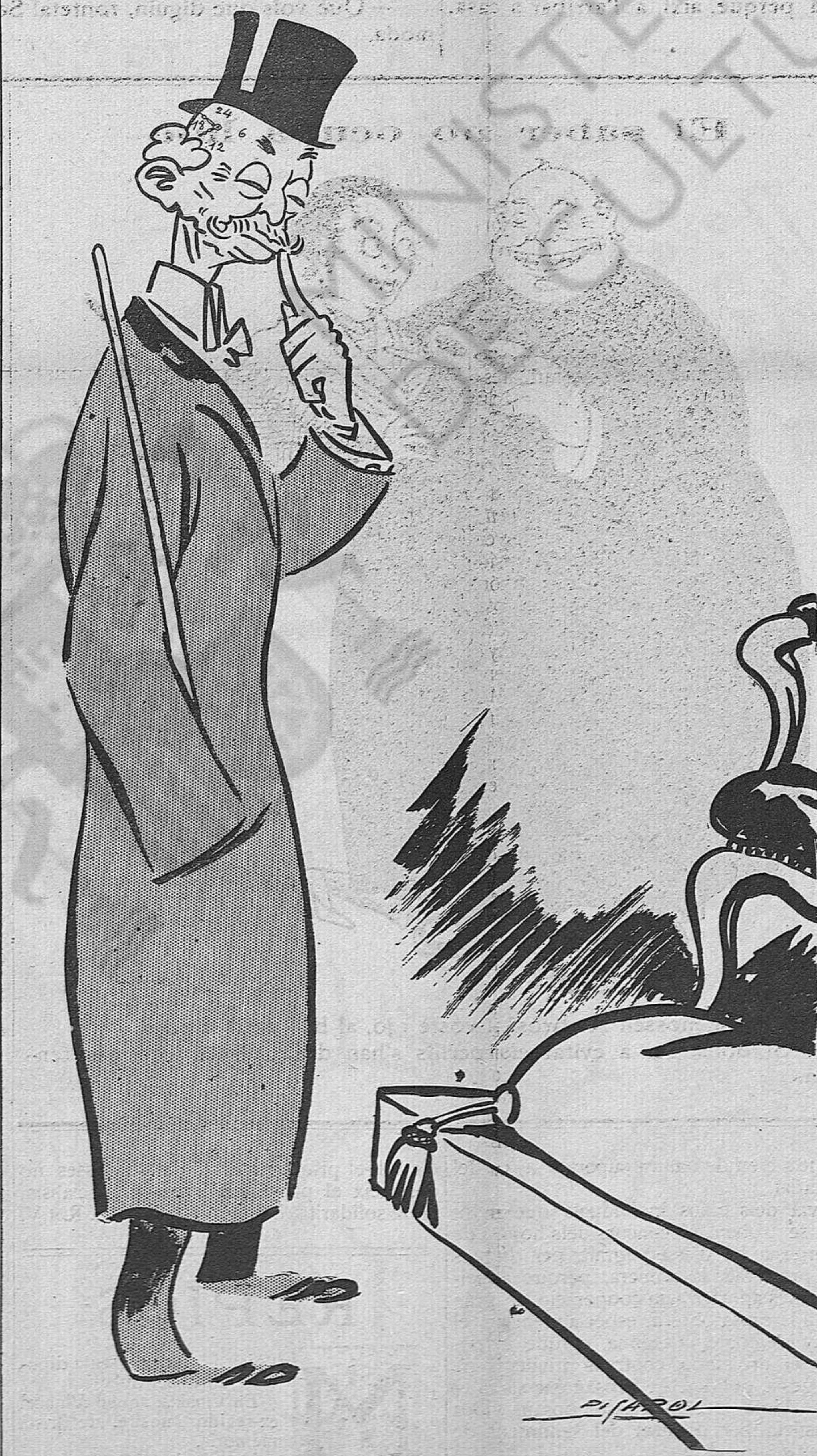
—No fumem, no fumem!... Que «quien va a Sevilla... pot-ser el treuràn de su sillan»...