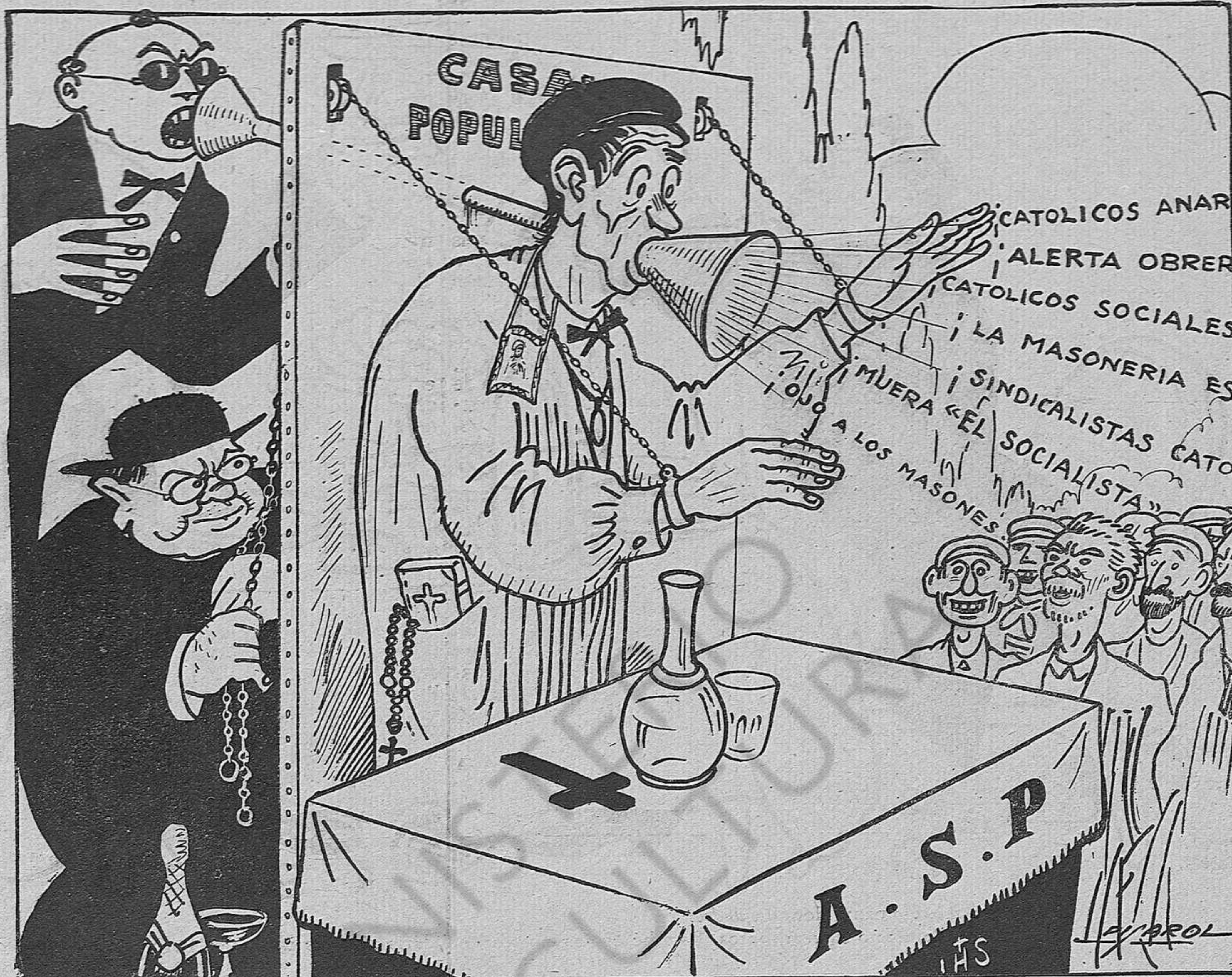
—A la brega, companys!... Ha arribat l'hora d'emancipar-nos de tota mena de tiranies!...