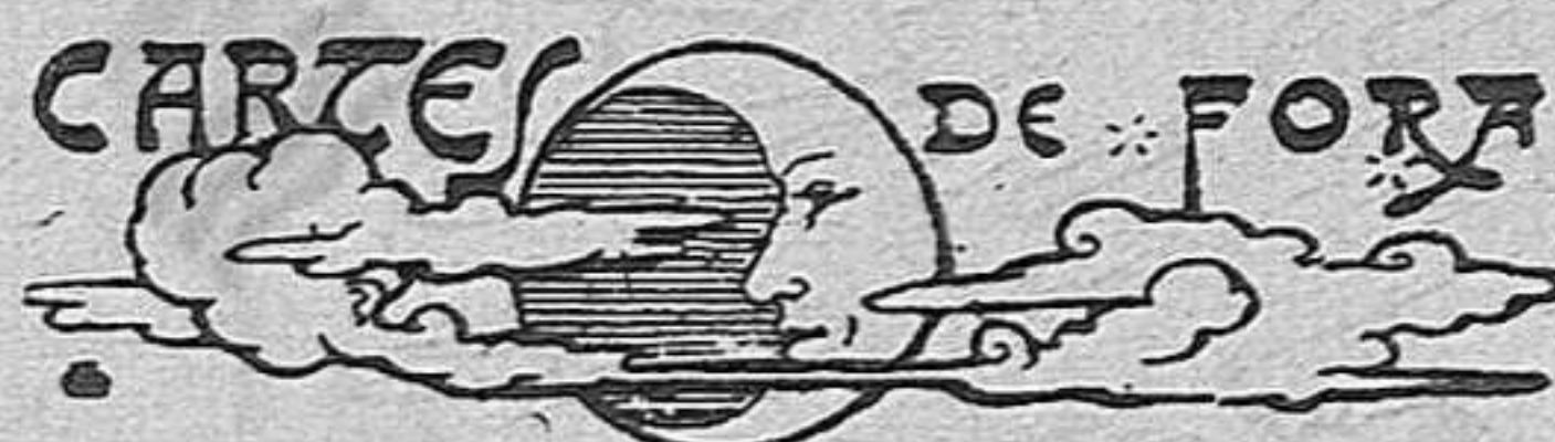
Figueres, 6 d'Abril.

En aquesta ciutat se publica el periòdic republicà Empordà Federal, portaveu de la U. F. N. R., el qual ha celebrat el segon cap-d'any de sa publicació amb un número extraordinari i un modest banquet. El sopar va tenir lloc ahir, dissabte, a les vuit de la vetlla, a l'Hotel del Comerç, sentant-se al costat dels actius redactors d'Empordà Federal bon nombre d'amics i correligionaris. Durant l'àpet va regnar, entre'ls reunits, l'alegria acostumada en aitals actes. El número extraordinari no ha pogut eixir fins avui, diumenge, car porta setze planes d'articles dels millors escriptors, glories de Catalunya—Pere Corominas, Alexandre Plana, Ribera i Rovira, Ignasi Iglesias, Prudenci Bertrana, Carles Costa, Apeles Mestres i altres,—i un de llarguíssim i molt raonat, tractant de política figuerenca, del nostre il·lustre diputat, en Joaquim Salvatella. Continuï, el nostre honorat i valent portaveu del republicanisme federal figuerenc, la seva tasca, i que visca molts anys per al bé de Catalunya i la llibertat. —Per al proper mes de Maig—probablement el dia 4—es prepara una conferència, que tindrà lloc